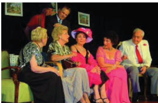
Obra de teatre durant l'edició de l'any passat.