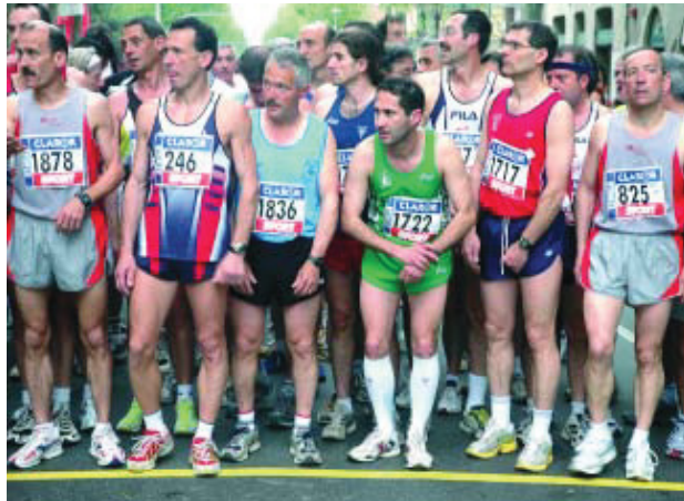
En edicions anteriors, hi van participar entre 1.600 i 1.800 atletes.

Aquests Trofeus Internacionals Ciutat de Barcelona són dues curses professionals on es convidava una vintena d'atletes de l'elit nacional i internacional, tant en sèries masculines com femenines.