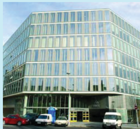
L'edifici integra un auditori per a 400 persones.

El nou edifici integra les instal·lacions administratives, un espai per a la gent gran, botiga amb material especialitzat, cafeteria-restaurant, auditori per a 400 persones, el centre de recursos educatius, de rehabilitació integral i el servei bibliogràfic, encarregat de la producció de llibres en braille i suport sonor. Altres espais de gran interès de la nova seu són la biblioteca braille, sonora i tècnica especialitzada per a persones amb discapacitat, com també les