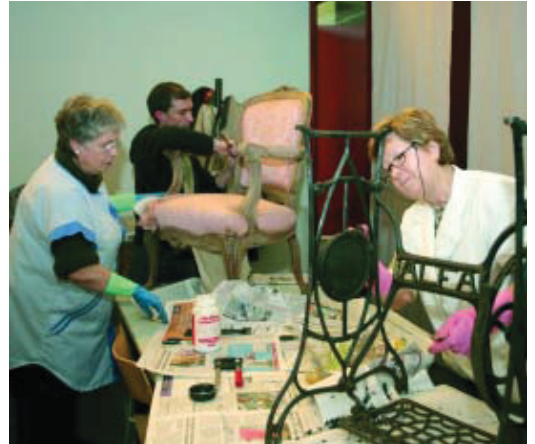
Un dels tallers que es fan al centre.

El centre cívic Sagrada Família celebra el 14 d'abril el seu desè aniversari i l'ampliació de les seves instal·lacions. En aplicació d'un criteri basat en la solidaritat i el concepte de gènere, les seves activitats s'agrupen al voltant de quatre àrees: l'Espai Infantil, que és una zona de lleure participativa, educativa i solidària adreçada, les tardes de dilluns a divendres, a infants d'entre 3 i 12 anys; l'Espai per a la Gent Gran, que és un punt de trobada, de relació i de contacte amb la vida del barri, amb tertúlies, jocs, balls i excursions; el punt d'informació general sobre els recursos del Districte i de la ciutat, obert de 10 a 21 h; i finalment, l'espai cultural, que inclou nombrosos tallers i una programació cultural gratuïta centrada d'una manera especial en la música. L'equipament disposa també d'un servei de cessió d'espais i de suport organitzatiu per a tots aquells ciutadans, enti-