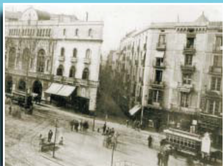
Imatge del pla de la Boqueria, punt neuràlgic dels primers tramvies, amb dos tramvies amb imperial.

Per cobrir aquesta primera línia, l'empresa explotadora del servei va adquirir vuit cotxes construïts a la fàbrica de Geo Starbuck & Cia, de Birkenhead, Anglaterra. Tenien una capacitat de 36 places distribuïdes 18 a l'interior i 18 més a la imperial. També es van comprar dos cotxes més fabricats a Barcelona per l'empresa Balcells, amb 12 places a l'interior. Com que aquests vehicles no eren impulsats ni per l'electricitat ni pel vapor, va caldre comprar 80 cavalls per al servei. Si té fotografies o documents del seu barri, en pot fer donació a l'Arxiu Municipal del Districte, 93 291 62 28