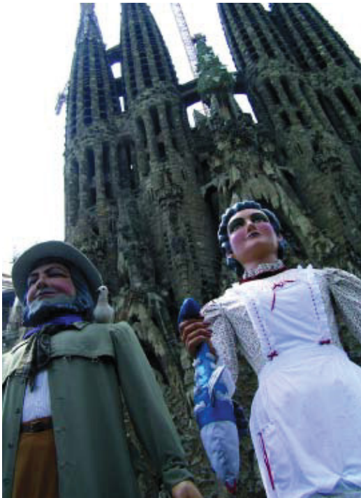
Gegants durant la celebració de la Festa Major.