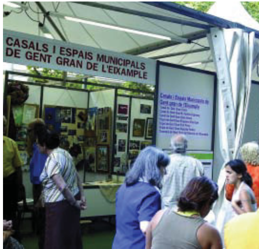
Una imatge de l'edició anterior de la mostra.

El diumenge és el dia que tradicionalment es dedica als actes de cultura popular. A l'avinguda Mistral, a l'espai de la mostra, hi haurà una petita cercavila de gegants i els Castellers de la Sagrada Família faran una exhibició,