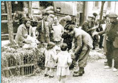
Fira del gall a la Rambla de Catalunya l'any 1932.

Si té fotografies o documents del seu barri, en pot fer donació a l'Arxiu Municipal del Districte, 93 291 62 28