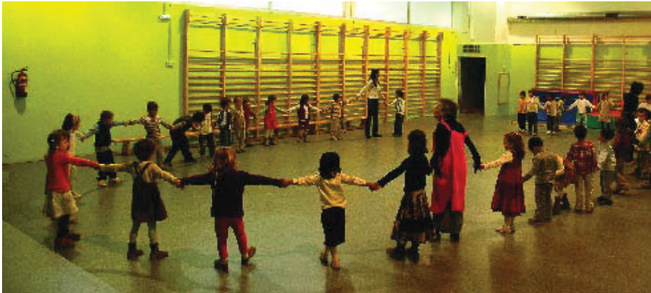
El pavelló esportiu de l'escola Fort Pienc acollirà algunes activitats que ara es fan al Poliesportiu de l'Estació del Nord.