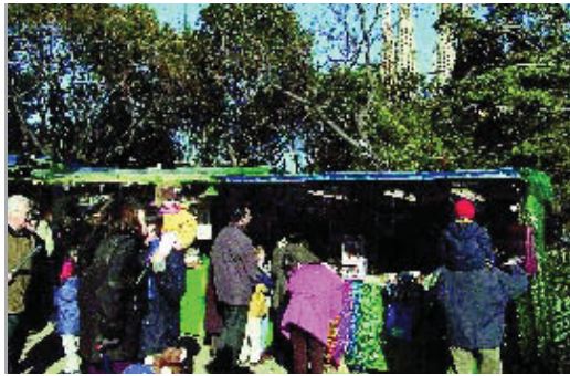
La Fira de la Sagrada Família, especialitzada en decoració de Nadal.

La Fira de Nadal de la Sagrada Família inclou a partir d'aquesta edició una fira d'aliments artesans. D'altra banda, els artesans de la Fira de Reis han passat un control de qualitat