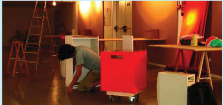
Al setembre i octubre es van començar els projectes artístics que s'exposaran a principi del 2007.

Són una plataforma juvenil que promou la comprensió de la diversitat cultural i el respecte als drets humans a través de propostes innovadores