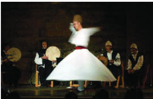
Dances sufís, en una imatge d'arxiu del festival.