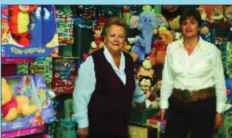
Joguines Xènia fa realitat els somnis infantils des de 1962.