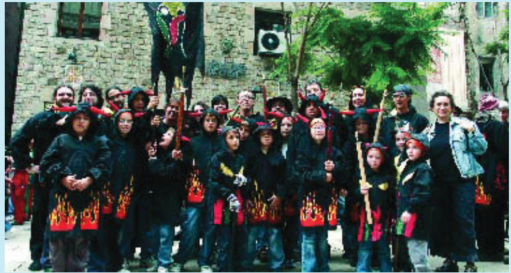
Tota la família dels Diablers de l'Esquerra Infernal.