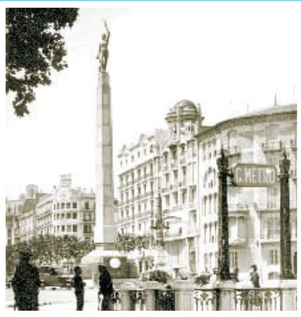
El monument definitiu a Francesc Pi i Margall, l'any 1935.

Si té fotografies o documents del seu barri, en pot fer donació a l'Arxiu Municipal del Districte, 93 291 62 28