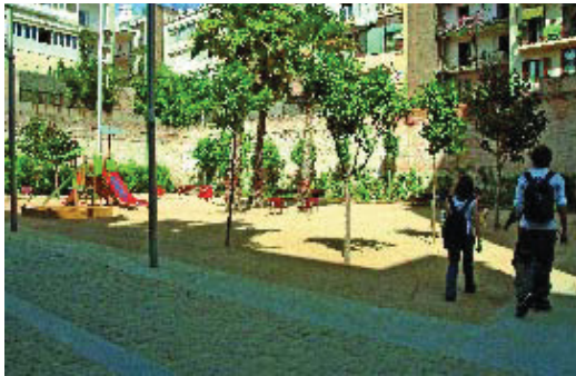
Un interior d'illa a l'Eixample.

A la primavera s'obriran al públic com a espais de lleure un interior d'illa al carrer Calàbria, 90, i un altre a Roger de Llúria, 132, a tocar del barri de Gràcia