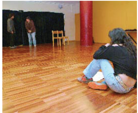
Assaig d'un dels espectacles d'aquesta primera mostra.

Al Laboratori, hi tenen cabuda tant companyies que volen muntar una obra completa com creadors que volen treballar una part d'un projecte. Entre totes les propostes presentades i documentades amb una ex-