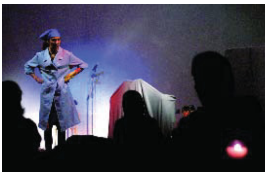
Hi haurà activitats fins a la matinada.