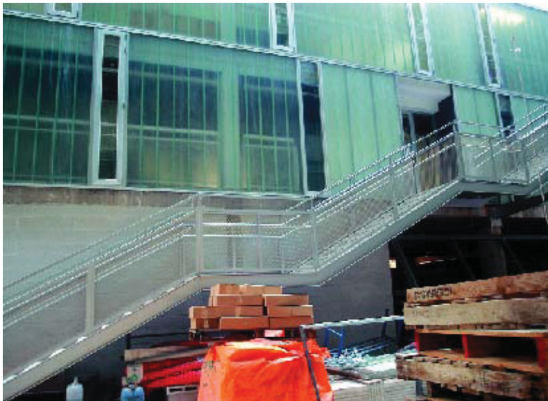
Les obres de construcció dels habitatges es troben a la recta final.