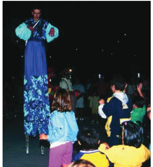
Edició del 2005 de la Festa Major de l'Esquerra de l'Eixample.

L'edició d'enguany de la Festa Major de l'Esquerra de l'Eixample arriba carregada d'activitats per a grans i petits. La majoria han estat organitzades, una vegada més, per l'Associació de Veïns i Veïnes del barri en col·laboració amb diverses entitats. Les celebracions començaran divendres 29 amb el tradicional pregó, enguany a càrrec de Lluçia Ferrer, reconegut radiofonista vinculat al barri, i continuaran amb nombrosos actes lúdics i culturals a l'aire lliure. Entre aquests actes cal destacar el clàssic sopar i ball al carrer, el qual es farà una vegada més al tram de Provença entre Viladomat i Calàbria, les havaneres del grup Port Bo o el retrobament amb dos clàssics de la Festa Major, els Ballets de Catalunya, entitat històrica del barri que recupera el folklore català, i el Cor Vivaldi, que ha actuat per tot el món. No hi faltará tampoc el Correfoc, la Trobada de Puntaires, el concert de rock