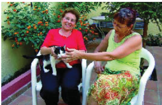
Es parlarà sobre teràpia assistida amb animals de companyia.