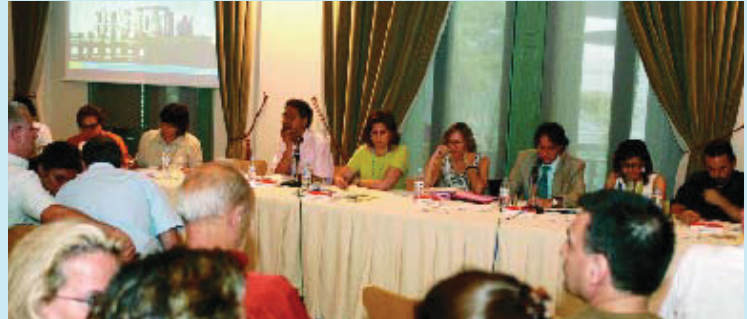
El plenari es va celebrar al començament d'estiu.

Al plenari del juliol es va informar que al solar de la Model hi haurà equipaments municipals. També s'hi van presentar dues pàgines web dedicades al jovent i al comerç