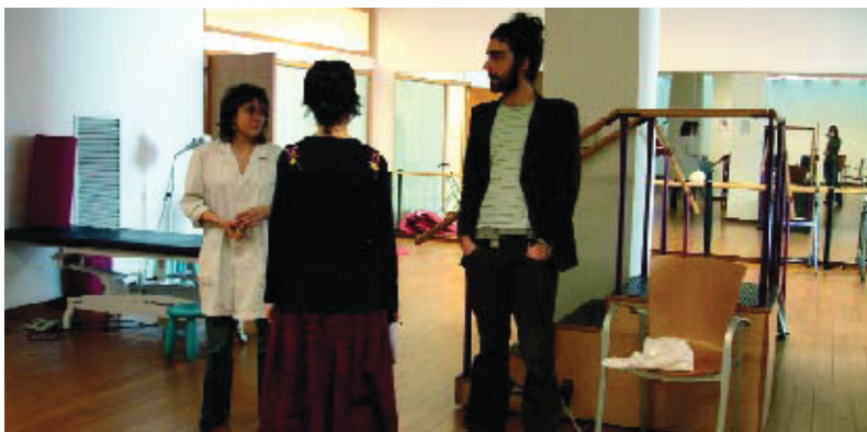
Els artistes de Laboratorium, a la residència de gent gran, preparant el projecte.