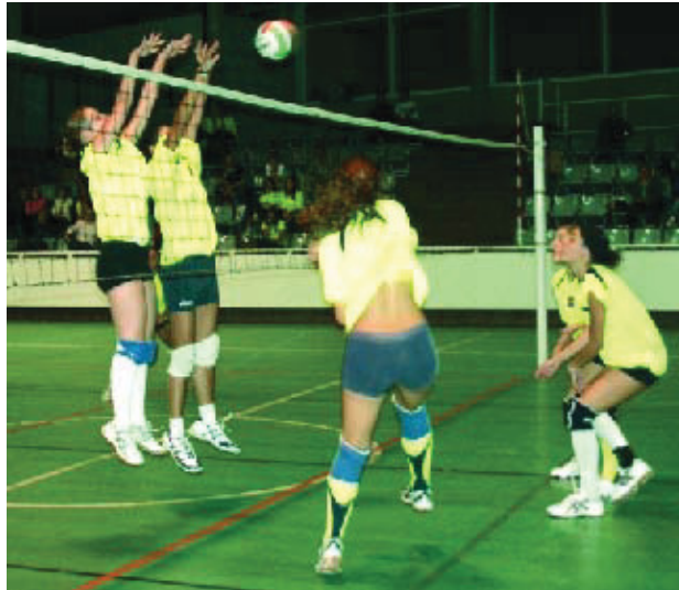
Moment d'un partit del CVB Barça.

Des del setembre fins al juny i de dilluns a divendres, dues hores al dia, els equips cadets i juvenils del CVB Barça utilitzaran el pavelló de l'Aiguajoc Borrell per efectuar els seus