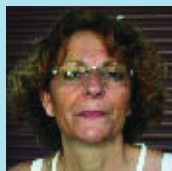
Neus Solsona Autònoma

Sí que ho sabia i no hi estic gaire d'acord, perquè m'hauria agradat més tenir una àrea verda. Malgrat tot, no dubto que els equipaments públics no siguin importants.