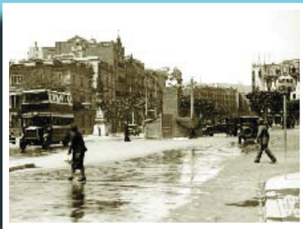
Monument provisional a Francesc Pi i Margall, obra de l'escultor Felip Coscolla.

Si té fotografies o documents del seu barri, en pot fer donació a l'Arxiu Municipal del Districte, 93 291 62 28