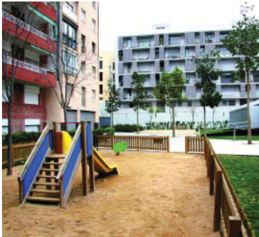
S'han recuperat diversos interiors d'illa.