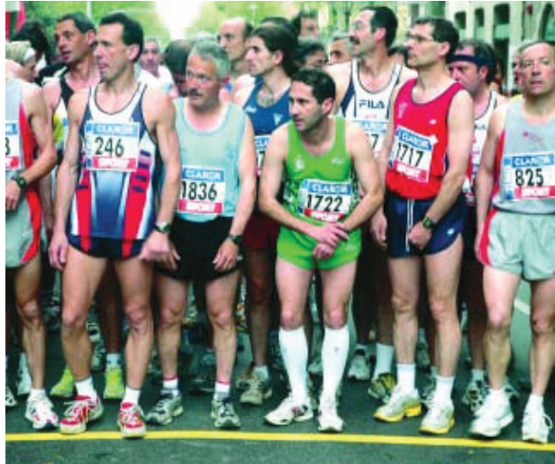
Tot just abans del tret de sortida, d'una edició passada.

La Milla tornarà a repetir el format que tan bons resultats ha donat als organitzadors aquests últims anys: hi haurà onze sèries populars i dues