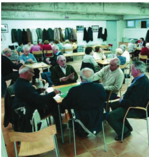
Un grup d'avis al centre de dia de l'Espai per a Gent Gran Fort Pienc.

El casal vol celebrar els seus primers vint anys amb sardanes, concerts, un sopar a la fresca i altres activitats per a tots els veïns