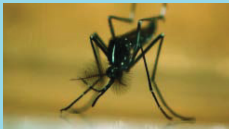
El millor per fer front a aquest mosquit és la prevenció.

Controlar el mosquit tigre, una tasca que necessita la col·laboració de tothom