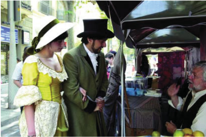
La Fira Modernista de l'any passat a la Dreta de l'Eixample.

La Festa de la Sagrada Família comença el 21 d'abril i la de la Dreta de l'Eixample el mes de maig, començarà amb la celebració de la Fira Modernista