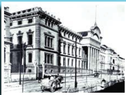
L'Hospital Clínic i l'entrada a la Facultat de Medicina, poc temps després de la seva inauguració.

Si té fotografies o documents del seu barri, en pot fer donació a l'Arxiu Municipal del Districte, 93 291 62 28