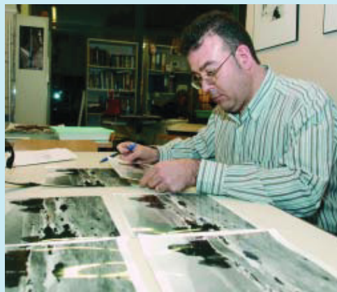
Un usuari treballa a l'espai.

L'Espai de Fotografia Francesc Català-Roca celebrarà el seu quinzè aniversari durant la Fotofesta del 26 i el 27 de maig