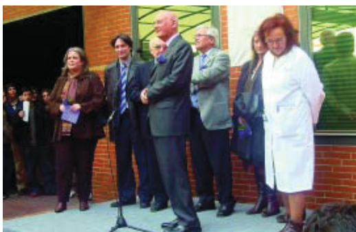
Un moment dels actes del dia 8 de març.