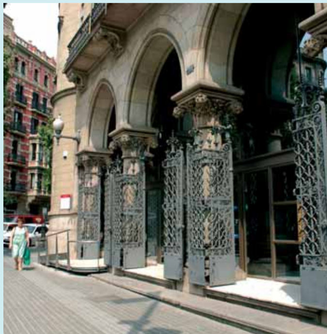
El Ple se celebra cada dos mesos a la seu del Districte.