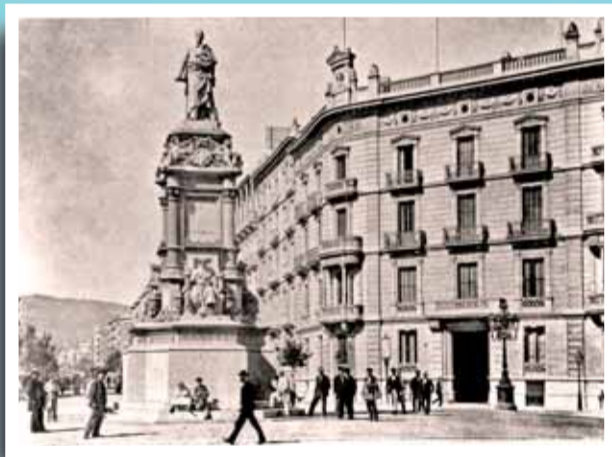
El monument a Güell i Ferrer a la cruïlla de la Rambla Catalunya - Gran Via el 1896.

Si té fotografies o documents del seu barri, en pot fer donació a l'Arxiu Municipal del Districte, 93 291 67 26