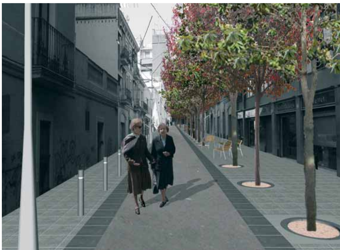
Perspectiva virtual de la proposta de renovació del passatge d'en Sagristà.

Aquest mes s'han engegat dos processos participatius sobre la urbanització de l'interior de l'illa ONCE i del passatge d'en Sagristà. Els ciutadans estan convidats a dir-hi la seva