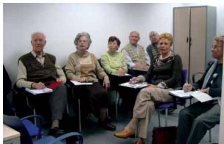
El programa s'adreça als habitants del districte.