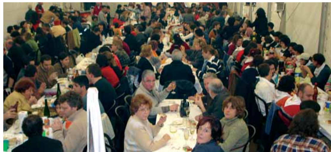
Sopar popular celebrat en una edició passada de la Festa.

A més de la carpa xarx@ntoni, dissabte 21 se celebrarà el II Campionat de Wargaming, un joc informàtic per equips; el Linuxshow, una activitat festiva per posar-se al dia en informàtica, i l'Install Party de Programari Lliure, en què tothom que vulgui podrà baixar el seu PC de casa per instal·lar-hi programes informàtics gratuïts. La nit serà per al gran ball de Festa Major, amb The Supremes i l'orquestra Arturo y la Màquina del Sabor. Diumenge al migdia, si pot ser amb solet, es farà el vermut popular a l'avinguda Mistral, i a la tarda hi haurà trobada de corals i esbarts. La fi de festa serà protagonitzada pels diables i la Porca de Sant Antoni. Per a més informació, vegeu l'Agenda.