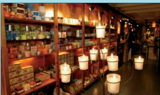
S'hi pot trobar una gran varietat d'espelmes.