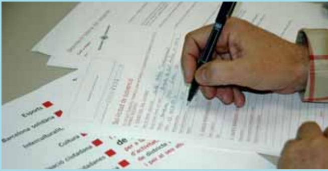
Els formularis especifiquen els papers que s'han de presentar.