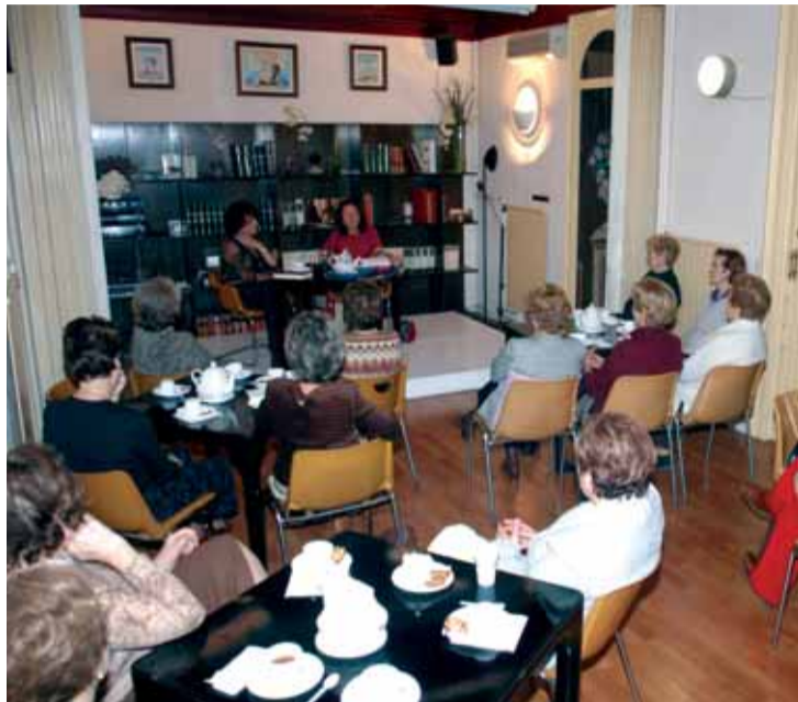
Xerrada-tertúlia de dilluns a la tarda.