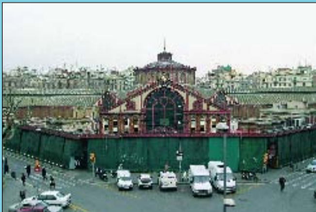
Ara Convertit en centenari, el mercat té pendent una reforma que ja està en estudi.