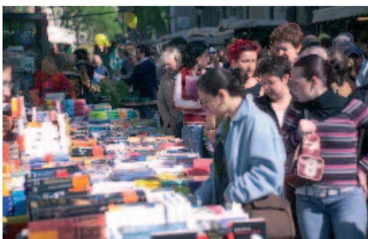
A més del carrer, Sant Jordi es viurà a centres cívics i escoles.

B iblioteques, centres cívics i escoles es preparen amb diferents activitats per celebrar la Diada de Sant Jordi. El dia 23, a les 21 hores, es projectarà al pati de la Casa Elizalde, la pel·lícula de Ventura Pons "El per què de tot plegat". El film té com a argument el llibre del mateix títol de Quim Monzó. Altres activitats seran: la passejada literària pel districte el dia 24, la mostra i signatura de llibres