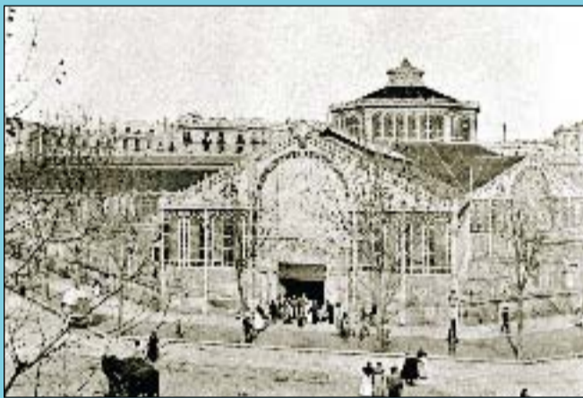
Abans Aspecte que ofería el mercat a la cantonada dels carrers Comte Borrell amb Manso el 1896.

Si té fotografies o documents del seu barri, en pot fer donació a l'Arxiu Municipal del Districte, 93 291 62 28