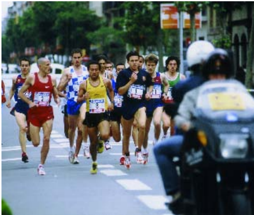
El recorregut d'aquesta cursa és exactament de 1.609 metres (1 milla).

Des de 1985, la Milla de la Sagrada Família, organitzada per la Funda-