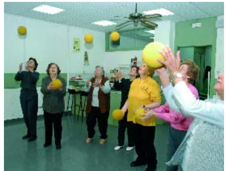
Una de les classes que es fan al matí.

Tota l'oferta de classes, activitats socials i culturals, com també els jocs de taula, estan pensats perquè les persones grans puguin gaudir de la vida de manera dinàmica i passar una bona estona. En la proposta actual de classes, que es fan totes al matí, hi ha idiomes (català, francès i anglès), manualitats, patchwork, gimnàstica, tai-txi, dibuix i pintura i també unes sessions per exercitar la memòria. La tarda és el moment dels jocs de taula. S'hi poden trobar molts socis en