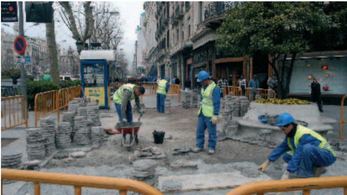
Al passeig de Gràcia es va començar fa algunes setmanes amb les voreres.