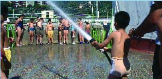
Les activitats van adreçades a infants i joves fins a 17 anys.