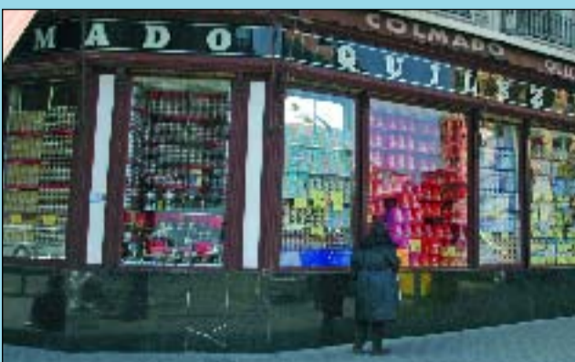
Quílez és una botiga especialitzada en whisky.

L' aparador d'aquesta botiga ocupa un xamfrà sencer de la cruïlla de rambla Catalunya amb carrer Aragó. Només de veure el que hi ha exposat ja ens fem la idea que dins hi trobarem productes que a pocs llocs més tenen a la venda. És una botiga especialitzada en whisky: en tenen més de 200 referències. Hi ha olis verges extra de totes les denominacions d'origen: 200 referències de vinagres; 180 d'aigües... Tenen peces numerades de pernil ibèric de gla de primera qua-