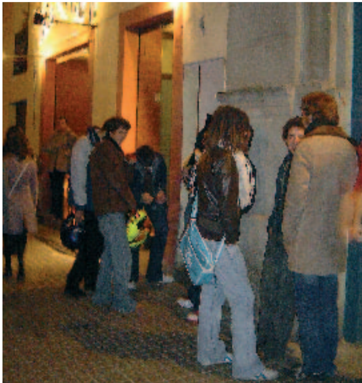
Anar de copes amb els amics és una de les activitats habituals.