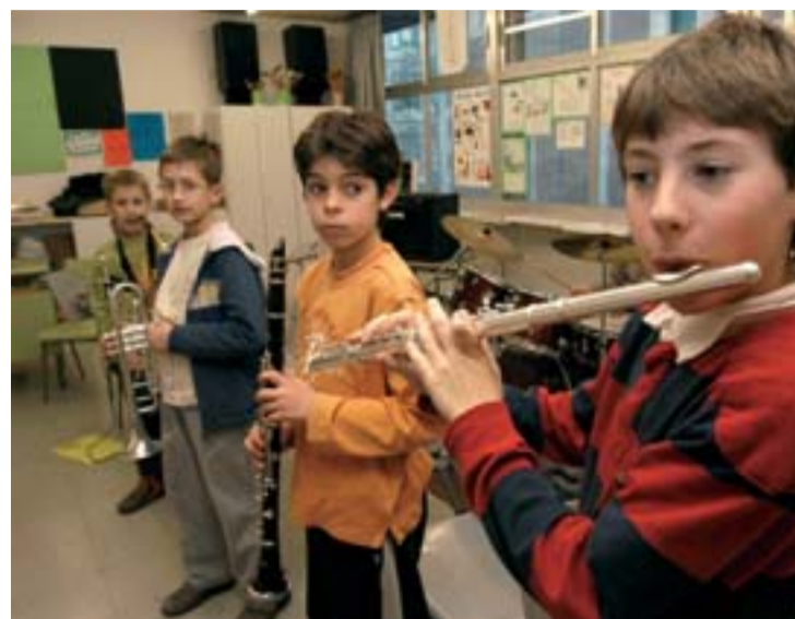
Moment de l'assaig de la Peque Band de Jazz.