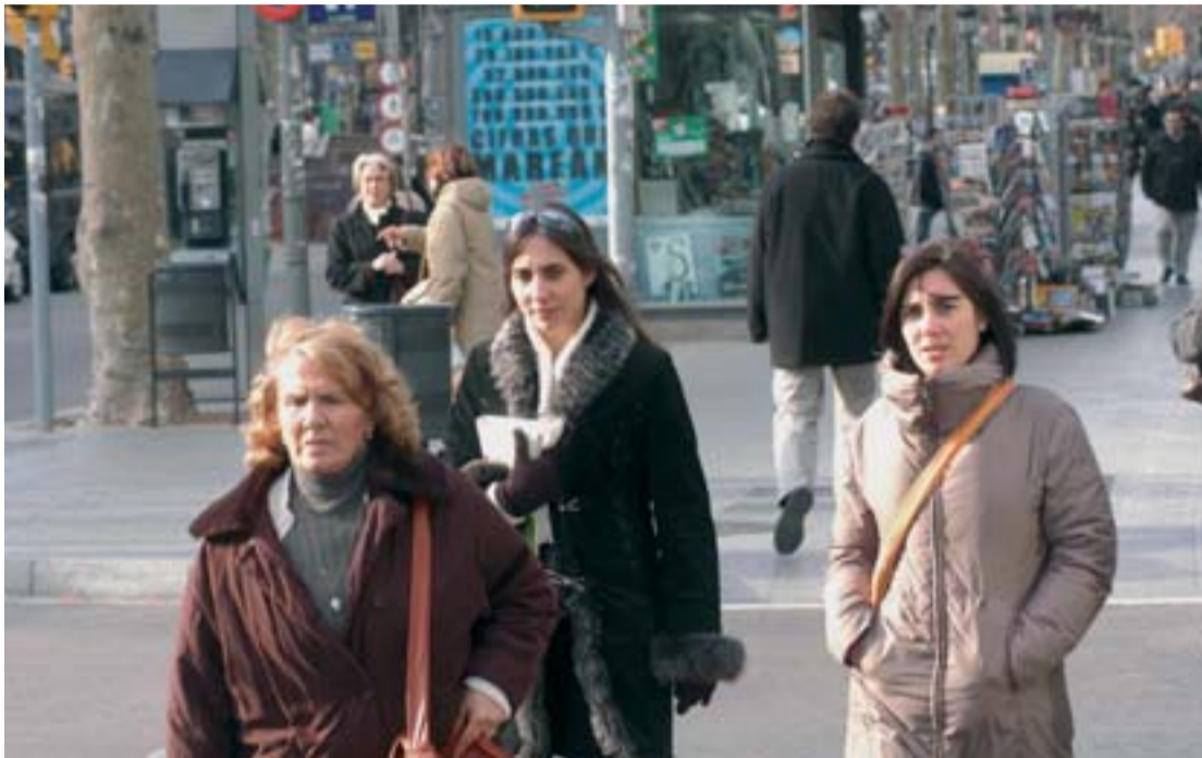
Les dones són una part molt important de la vida associativa de l'Eixample.

És un dels districtes amb més associacions de dones. I també el que té l'índex més elevat de dones grans després de Ciutat Vella. La situació d'aquest col·lectiu és un dels reptes del Consell de Dones