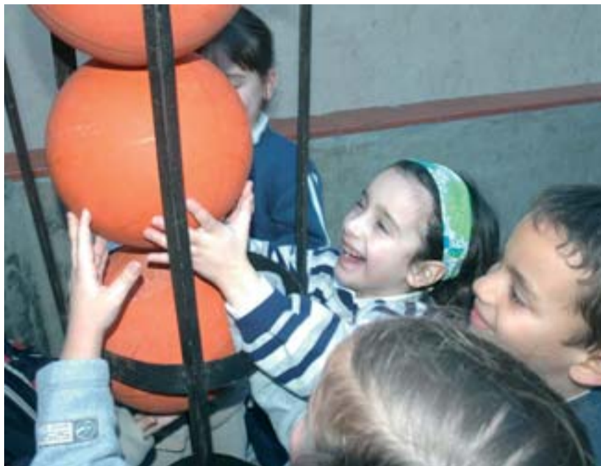
L'escola de bàsquet del centre ha nodrit de títols el club.

Els orígens de CP Roser es remunten a 1932, quan un grup de joves alumnes dels escolapis de Sant Antoni van crear un equip de bàsquet amb el nom de Conquesta. Després del període de la Guerra Civil, aquest equip encara continuava viu, però es coneixia amb el nom de "Juventud de Acción Católica de España". En veure l'auge d'aquest esport a Catalunya i la gran acceptació que tenia entre els nens i joves del barri, es van veure amb cor de formar més equips, fins i tot un de femení i una escola de bàsquet que seria, a la fi, la que nodriria els equips superiors i donaria, i dona, més vida i títols al club.