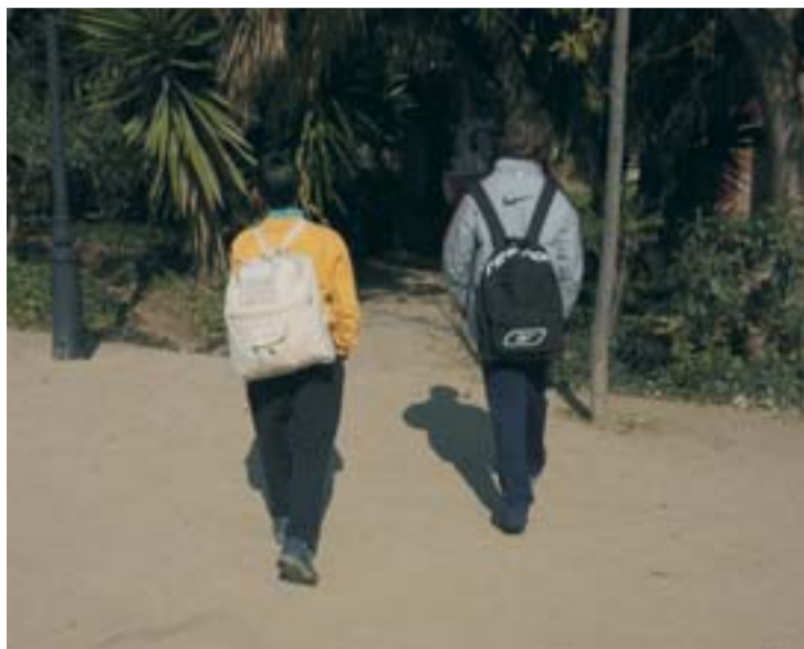
El programa vol prevenir problemes de comportament en els joves