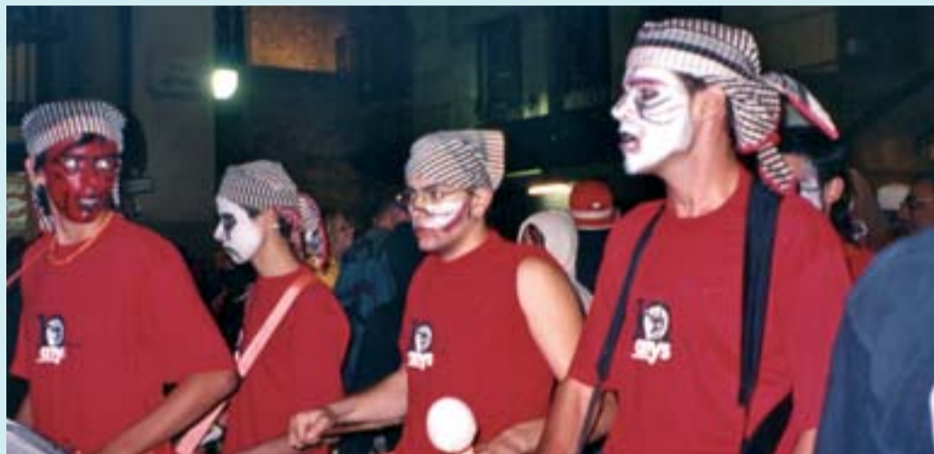
La colla té 12 percussionistes, a més de 15 diables.

Nascuts l'any 1994 per generació espontània, aquesta colla de diables de l'Eixample fa a la vora de deu actuacions cada any