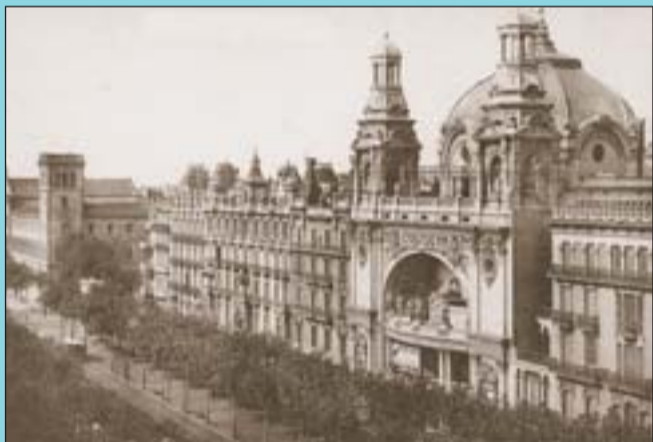
Abans El conjunt de cases de la Gran Via entre Balmes i Rambla Catalunya abans de la guerra.

Si té fotografies o documents del seu barri, en pot fer donació a l'Arxiu Municipal del Districte, 93 291 62 28