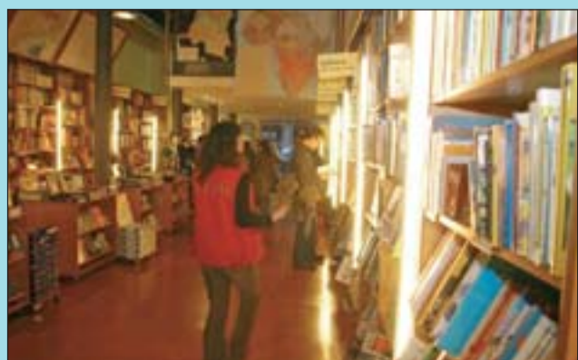
Milers de llibres omplen les prestatgeries d'Altair.

El fet de viatjar respon a motivacions molt diverses i la llibreria Altair, que acaba de fer els vint-i-cinc anys, és una referència ineludible per a qualsevol tipus de rodamón o per a aquells que s'interessen en el coneixement d'altres cultures. L'establiment va obrir en un petit local al carrer Riera Alta, més tard va traslladar-se al carrer de Balmes i actualment es troba a la Gran Via, en un local de grans dimensions ple de guies, mapes, música i literatura d'altres països, i articles que difi-