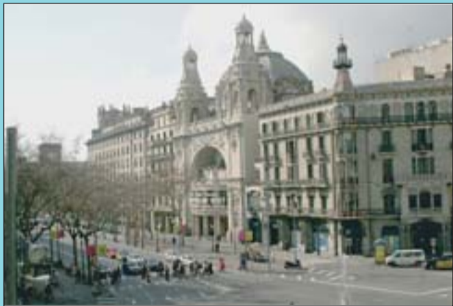
Ara En l'espai dels immobles enderrocats, s'hi va bastir un nou edifici que avui acull l'Institut Català de la Salut.