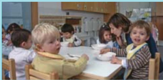
Escola Bressol Municipal El Tren de Fort Pienc.