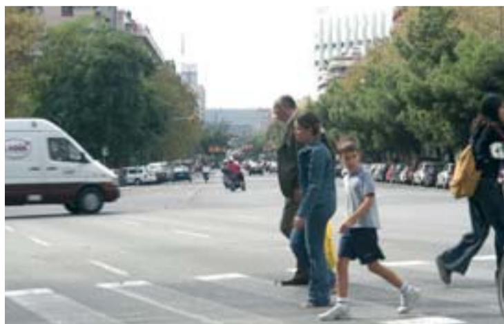
L'avinguda tindrà un bulevard amb parterres enjardinats.

Algunes de les aportacions de veïns i veïnes ja s'han incorporat al projecte de remodelació de l'avinguda de Roma. Es preveu que les obres comencin abans de l'estiu en el tram entre els carrers de Casanova i Comte d'Urgell.