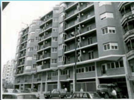
Grup d'habitatges construït per la cooperativa a la travessera de Gràcia, 262.