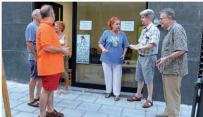
Membres de les associacions a la porta de la seva nova seu.