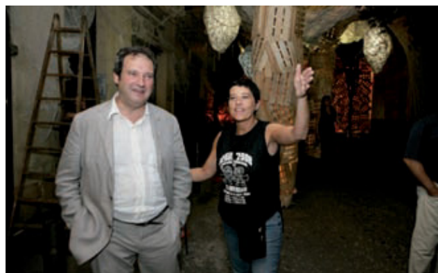
L'alcalde, Jordi Hereu, al carrer Verdi, mentre s'acabaven els guarnits.

El carrer Verdi del Mig va obtenir el primer premi del concurs de guarniments de carrers de la Festa Major de Gràcia, celebrada del 15 al 21 d'agost.