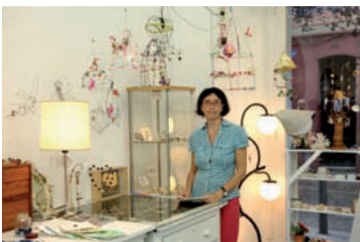
Fan creacions personalitzades amb botons.