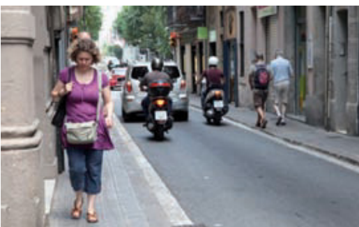
La travessera de Gràcia tindrà voreres més amples.