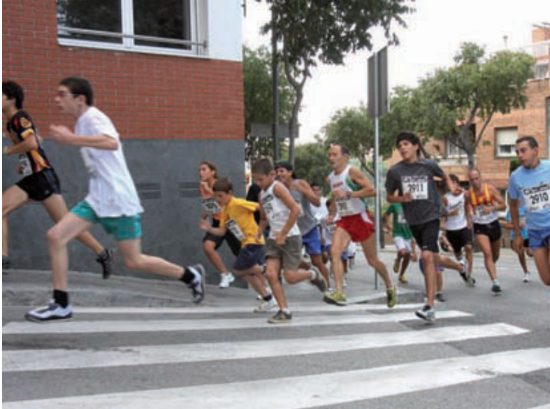
Un moment de la cursa popular Escalada de la Glòria de l'any passat.