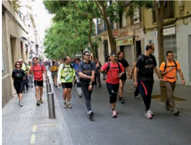
La marxa, al seu pas per Gràcia, l'any passat.