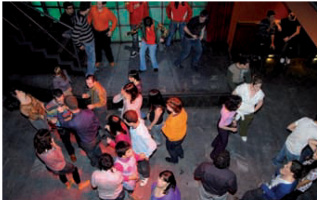
Trobada organitzada per Ludàlia a un local musical de Barcelona.