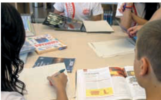
Pont Biblio-escola explica als alumnes com documentar-se.