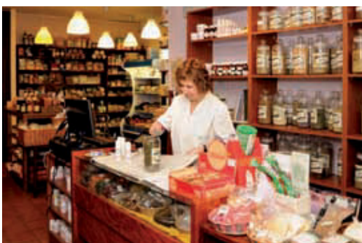
Combinen la tradició i la innovació.