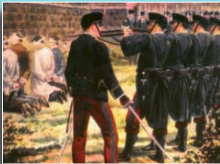
Part de la imatge de la portada del llibre "El procés de Montjuïc".

Si té fotografies o documents del seu barri, en pot fer donació a l'Arxiu Municipal del Districte, 93 368 45 66