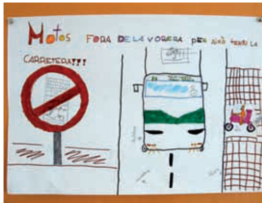
Dibuix dels alumnes de l'escola Turó del Cargol.

“Si es fessin camins escolars, crec que molta més gent sortiria al carrer i els nostres pa-