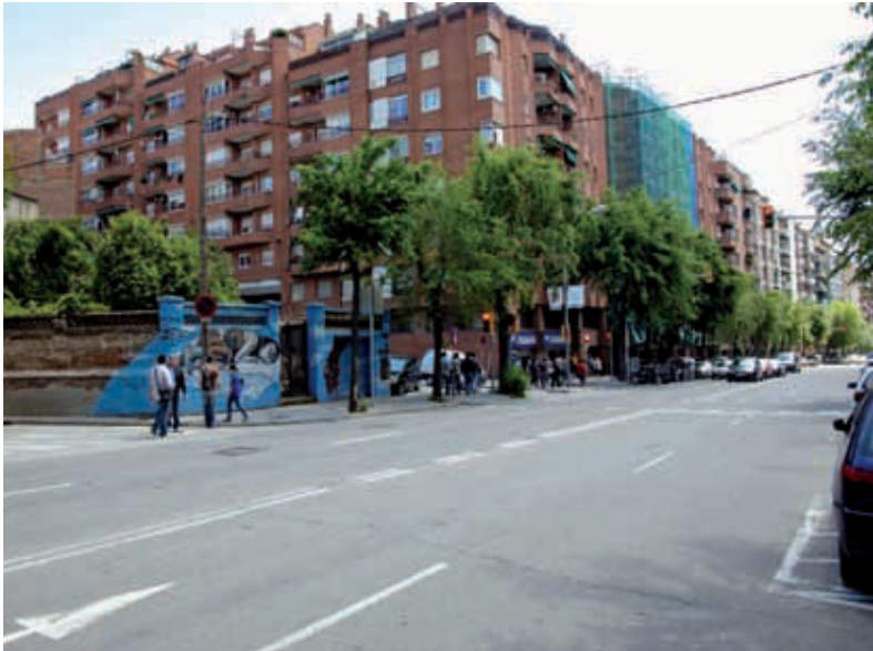
La vorera de la banda del Besòs de l'avinguda doblarà la seva amplada entre Medes i Maignon.

A mitjan mes comencen les obres de millora de la vorera de la banda del Besòs de l'avinguda Vallcarca, el tram comprès entre els carrers Medes i Maignon