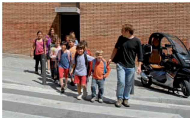
Alumnes de l'escola Turó del Cargol creuen per un pas de vianants.

Els nens i nenes, pares i mares, el Districte i el professorat de l'escola Turó del Cargol treballen conjuntament per millorar el seu camí escolar, una iniciativa que pretén afavorir un accés segur i agradable d'anada i tornada a l'escola. D'aquesta manera, es fomenta anar a peu i l'ús dels mitjans de transport sostenibles, així com l'autonomia dels escolars. Però més enllà d'això, el carrer esdevé un espai de relació, civisme i convivència per a tothom. Els establiments del barri i les associacions també estan implicades en aquest projecte, que traça un itinerari invariable escollit entre els camins més utilitzats per la majoria de l'alumnat.