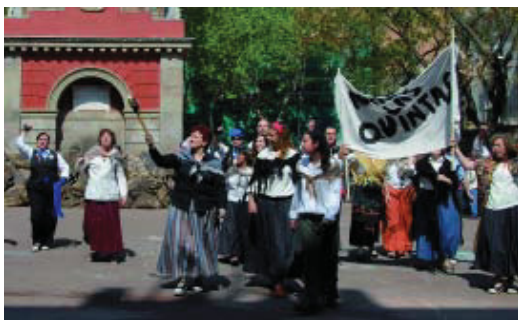
Escenificació de la Revolta de les Quintes de l'any passat.