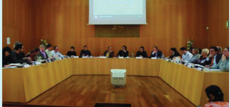
Un moment del Consell Plenari del passat 5 de març.