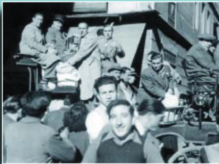
Components de la colla dalt d'un "break" en un carrer de Gràcia.

Si té fotografies o documents del seu barri, en pot fer donació a l'Arxiu Municipal del Districte, 93 368 45 66