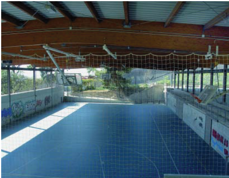
Es faran millores a les pistes poliesportives de la Creueta del Coll.

Amb aquest pressupost, els cinc barris de Gràcia podran endegar una vintena de projectes urbanístics que no estaven previstos en aquest mandat