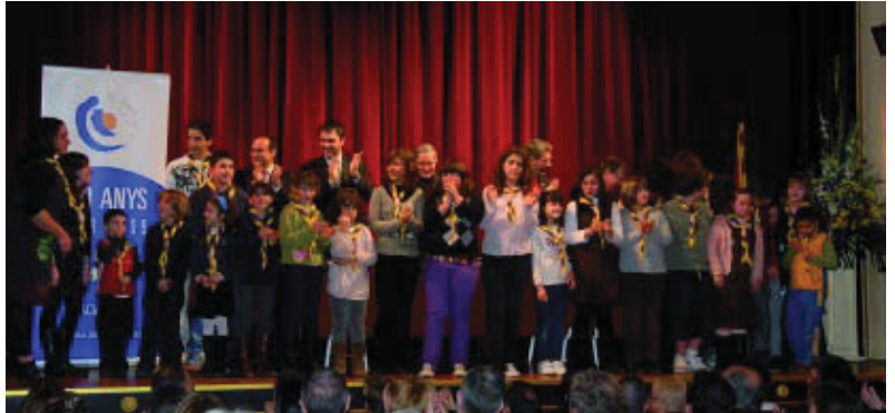
Moment de l'acte central del 140è aniversari.

És d'una de les entitats més arrelades i amb més tradició del districte. Compleix 140 anys amb bona salut, una agenda plena de propostes i apostant pel jovent i el futur