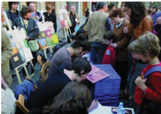
Primera trobada d'il·lustradors al Pla de Salmeron, l'any passat.

A Gràcia, hi tenen lloc dues activitats específiques que ja són tradició: l'intercanvi de llibres i la Trobada d'il·lustra-