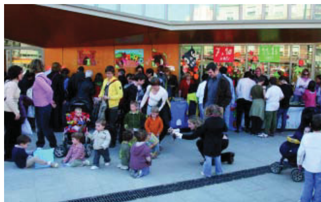
Activitat davant la Biblioteca Jaume Fuster, el Sant Jordi de l'any passat.

A més de les parades de llibres que ompliran tot el dia els carrers i les places, el 23 d'abril, Dia de Sant Jordi, tindran lloc a Gràcia dues activitats específiques que ja són tradició: l'intercanvi de llibres i la trobada d'il·lustradors. L'intercanvi de llibres es durà a terme a la tarda a la plaça Rius i Taulet i a la Lesseps, davant de la Biblioteca Jaume Fuster. Per obtenir llibres, cal haver-ne portat abans a la biblioteca de l'escola (els alumnes) i a la biblioteca del barri (els adults). Pel que fa a la trobada d'il·lustradors, se celebrarà durant tot el dia al Pla de Nicolás Salmerón. L'il·lustrador Ignasi Blanch és l'autor del cartell de la trobada d'aquest any.