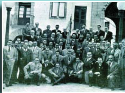
Foto familiar dels components de la colla als seus inicis.

Si té fotografies o documents del seu barri, en pot fer donació a l'Arxiu Municipal del Districte, 93 368 45 66