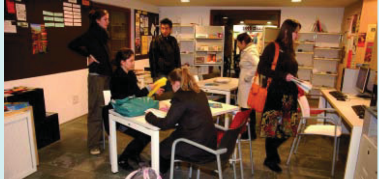
El Punt d'Informació Juvenil ha guanyat espai amb el trasllat.