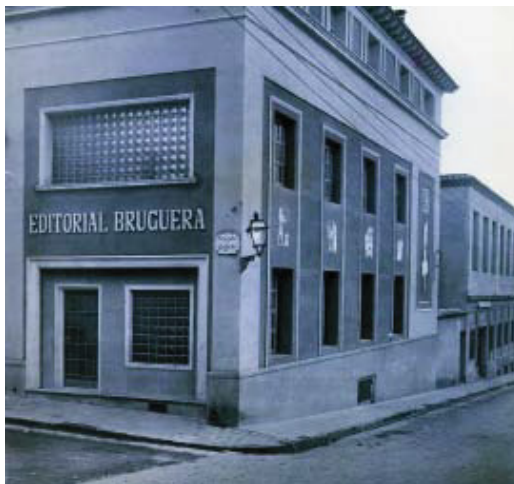
Imatge d'un dels edificis de l'editorial Bruguera, l'any 1955.

El Districte i el centre cívic del Coll conviden a veïns i extreballadors de l'editorial a participar en la creació d'un gran arxiu documental