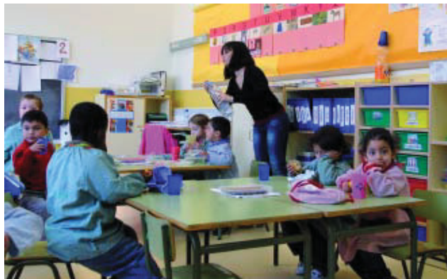
Les famílies poden visitar les escoles per conèixer-les millor.

Les escoles públiques de Gràcia estan fent jornades de portes obertes per tal que els pares puguin conèixer millor l'oferta educativa del districte abans de fer la preinscripció i matriculació per al curs 2009-2010. La campanya s'acabarà el maig i comprèn totes les etapes educatives: escola bressol, primària i secundària. La novetat per al proper curs és l'entrada en funcionament de l'Escola Bressol Municipal Vallcarca (av. Vallcarca, 227-229) i del CEIP Bailèn, situat provisionalment a la plaça del Poble Romaní, mentre es construeix l'equipament definitiu al carrer Bailèn, 225-231. Aquests dos col·legis admeten inscripció per al curs vinent.