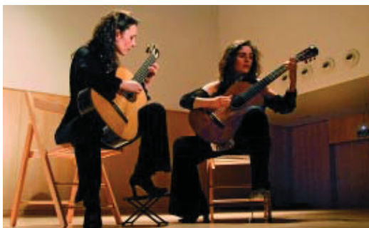
Concert a l'auditori de la Biblioteca Jaume Fuster.