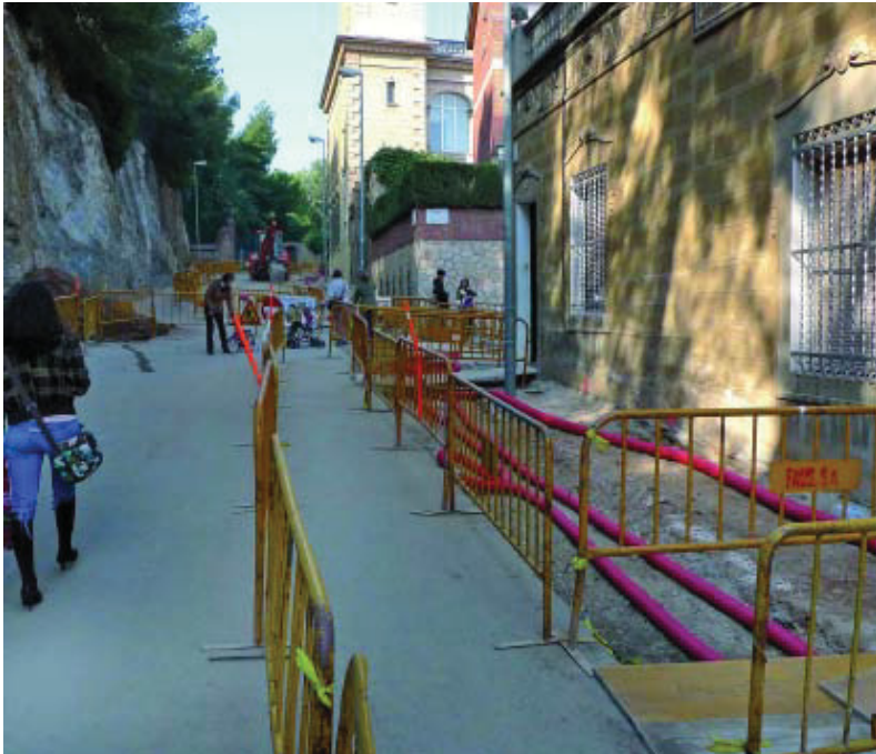
Obres a l'avinguda Sant Josep de la Muntanya, a l'alçada del carrer Mercedes.

La remodelació de l'avinguda del Santuari de Sant Josep de la Muntanya forma part del Pla de millora integral de l'espai públic de la ciutat per als anys 2008-2011, obres que requereixen una inversió econòmica total de 136 milions d'euros