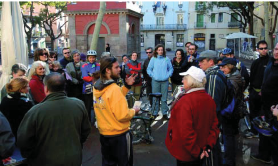
Participants al Bicibarris a la plaça Rius i Tauler.