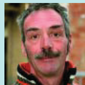
Germen Soriguera Autònom

No hi guanyarem gaire, els veïns, més aviat penso que serà el turista el que en sortirà beneficiat. Esperem que estigui acabat per fer-ne una valoració més ajustada.