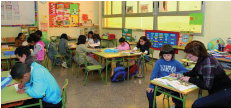
Les escoles obren les portes a pares i mares.

Consorci d'Educació de Barcelona Tel. 93 551 10 00 www.bcn.cat/gracia www.edubcn.cat