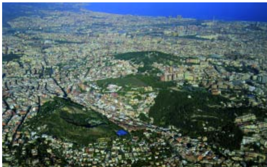
Imatge aèria del parc dels Tres Turons.

El nou planejament dissenyat per als Tres Turons preveu convertir aquest espai de la ciutat en un centre fonamental de l'anomenat verd estratègic urbà, les concentracions d'espai verd que les grans ciutats necessiten per esponjar la densa trama urbana.