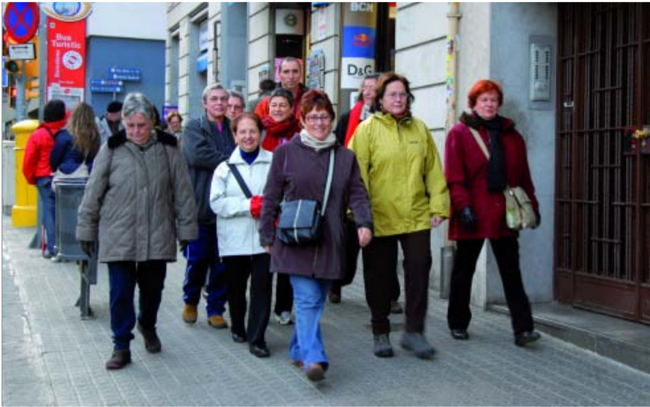
Participants a una de les caminades, passant per la travessera de Dalt.