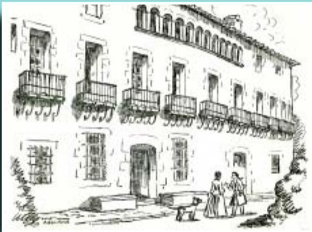
Dibuix de Can Sitjar fet per Lola Anglada.

Si té fotografies o documents del seu barri, en pot fer donació a l'Arxiu Municipal del Districte, 93 368 45 66