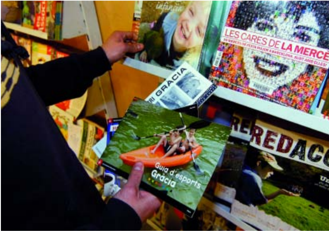
El nou equipament ofereix tota mena d'informació d'interès per al jovent.