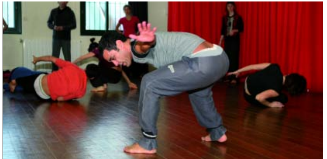
Assaig als espais de La Caldera.

Fundada el 1995 per nou coreògrafs i artistes que necessitaven un local on assajar, La Caldera ha crescut fins a esdevenir un espai viu de creació obert al barri