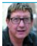
Josep Maria Contel

El que va començar com una aventura a una escola de Gràcia, dibuixar tebeos, ha dut l'Arnal Ballester a ser reconegut com un dels millors il·lustradors d'Espanya en ser-li atorgat el Premi Nacional d'Il·lustració el 2008