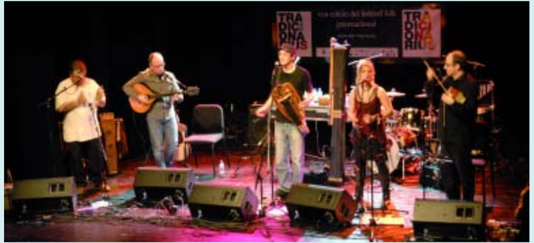
Actuació d'enguany al Tradicionàrius.

Com cada any, i ja en fa 22, el Tradicionàrius omple els carrers i alguns locals de la ciutat de música i balls tradicionals fins a l'abril