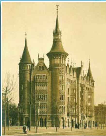
Imatge de la Casa de les Punxes poc temps després de la seva construcció.

Si té fotografies o documents del seu barri, en pot fer donació a l'Arxiu Municipal del Districte, 93 368 45 66