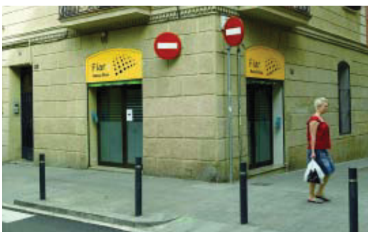
La seu de la Banca Ètica Fiare, al carrer Providència.