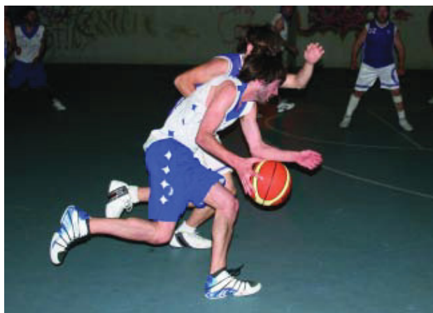
L'equip de bàsquet de l'Europa acaba una gran temporada.