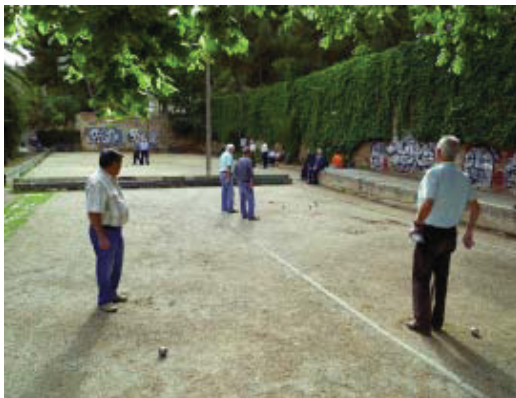
Les pistes de petanca també entren en el pla de millores.

El Districte de Gràcia preveu invertir, aquest any, més de 2,9 milions d'euros en la millora de l'espai públic als barris. La reparació d'espais malmesos i el manteniment integral són prioritaris