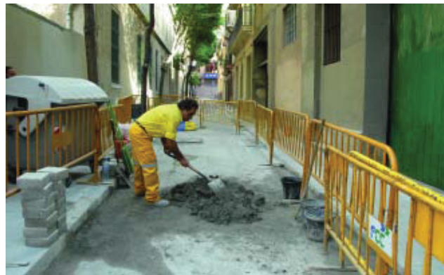
Obres de millora al carrer del Sol.

El Districte de Gràcia concep l'espai públic com un dels escenaris essencials per a la convivència i la qualitat de vida. Per això els darrers anys treballa amb l'objectiu de millorar-lo amb la intenció de crear espais que puguin satisfer els desitjos i les necessitats de les persones que en fan ús i que s'hi puguin desenvolupar les activitats més diverses, tot respectant el dret de totes les persones a gaudir del seu entorn més proper. En aquest sentit, s'estan duent a terme actuacions de reparació, renovació i manteniment integral d'espais malmesos.