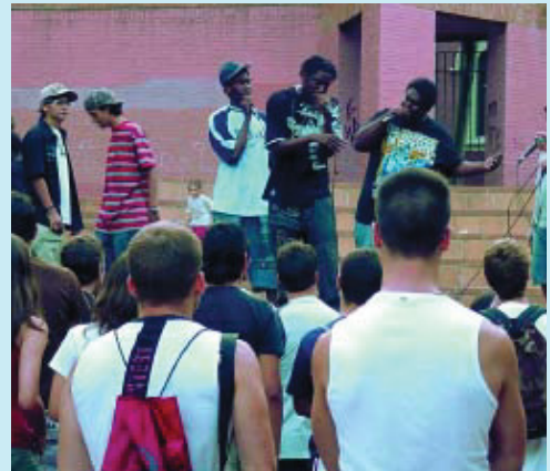
Activitat de la Festa Major d'una edició anterior.

Els actes festius es concentraran en tres punts: el carrer Grassot, la plaça de La Sedeta i el passeig Sant Joan entre Còrsega i Indústria. Seran cinc dies durant els quals la música serà protagonista. Hi haurà havanes, ball per a la gent gran, concert de rock, sardanes, swing i una orquestra per la revetlla de Sant Pere. Un dels actes principals serà la trobada castellera de diumenge 29 de juny al passeig Sant Joan, la qual comptarà amb les colles dels Castellers de la Vila de Gràcia, els Marrecs de Salt i els Castellers de Lleida. La ballada de sardanes, amb música