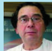
Jordi Tetass Ass. comerciants Astúries (Torrent de l'Olla-Gran de Gràcia)

És la festa del comerç i ens la prenem amb molta il·lusió, perquè hi ha molt de contacte amb la gent i això és molt agradable. És com el dia del "bon rotllo".