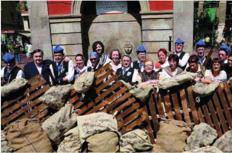
Festa trabucaire en commemoració de la Revolta de les Quintes, l'any passat.