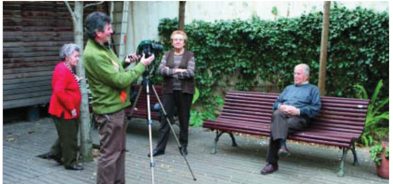
Alguns participants al pla comunitari durant una sessió fotogràfica per il·lustrar el fullet.