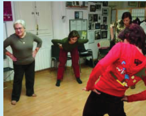
Grup de persones que participen en les activitats de La lliga.

El treball de la Lliga Reumatològica no només es concentra a millorar la qualitat de vida de tots aquests malalts, gràcies a les entrevistes amb el psicòleg, l'assistent social i les activitats esportives o els grups d'ajuda mútua, sinó a fer d'interlocutora amb l'Administració per millorar el sistema assistencial. Un dels seus últims guanys ha estat la posada en marxa del Pla director de les malalties reumàtiques amb el Depar-