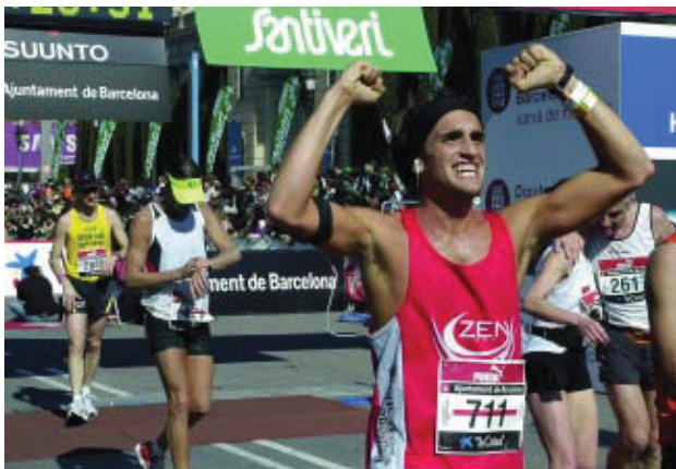
Moment en què ja es va arribar a la meta.