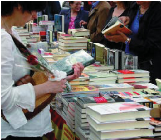
Com cada any, els llibres són els protagonistes de Sant Jordi.

Dos espais de Gràcia, la plaça Rius i Tauler i la plaça Lesseps, davant la Biblioteca Jaume Fuster, esdevenen punts d'intercanvi de llibres el dia de Sant Jordi. És la iniciativa "Sant Jordi diferent i sostenible"