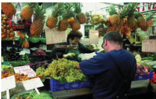
Caldria consumir més fruita i verdura.