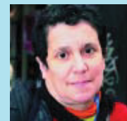
Nativitat Artigas Centre de documentació Arabdis

Doncs la veritat és que no ho tinc previst. Hi he anat altres cops, però ara estic una mica desinformada.