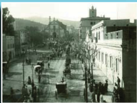
Colles de Sant Medir davant de l'església dels Josepets, en els primers anys del segle XX.

Si té fotografies o documents del seu barri, en pot fer donació a l'Arxiu Municipal del Districte, 93 368 45 66