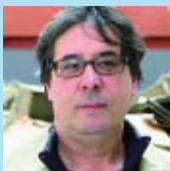
Pedro Cano Fotògraf

Jo faré una de les exposicions de fotografia que es faran allà i, per tant, sí que hi aniré, almenys a la inauguració.