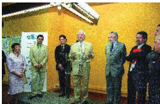
Un moment de l'acte inaugural.