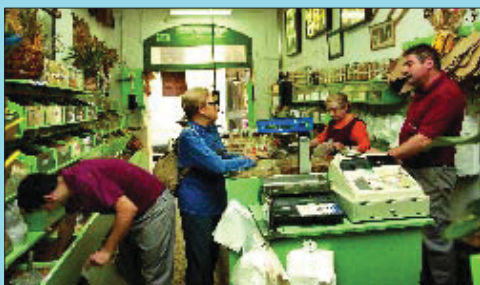
Legums, fruits secs i cereals des de fa més de 100 anys.

Pocs establiments hi ha com la Graneria Sala, que en un instant ens transporten a una època enyorada. En una societat que avança cap als productes envasats i prefabricats i on es perd el contacte amb allò de més genuí que puguin tenir, les caixes plenes de cereals, llegums i gra dels graners Sala són una invitació a la nostàlgia i a l'esperança de veure que encara hi ha llocs on les coses són simples i naturals. Comprar llegums, fruits secs o cereals és tan senzill com mirar, triar i que t'omplin una