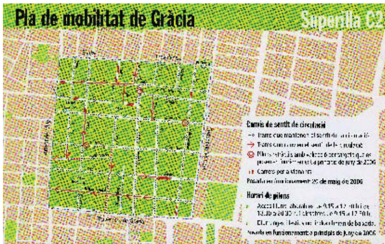
Plànol amb els canvis de sentit i la ubicació dels pilons retràctils.

Poden sol·licitar la targeta d'accés els comerciants i industrials que siguin titulars d'IAE, que tinguin el local a la zona de la C2 i que acreditin la necessitat de vehicle per a la seva activitat, així com els propietaris o llogaters d'una plaça de pàrquing, encara que no siguin residents a la superilla, sempre que puguin demostrar la titularitat del lloguer o la propietat. També ho poden fer els veïns empadronats que disposin de vehicle d'empresa o renting . Les sol·licituds es tramiten a l'Oficina d'Atenció al Ciutadà, al carrer de Francisco Giner, 46.