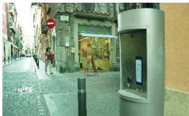
Portes d'accés al carrer de la Perla a l'alçada de Verdi.

El 20 de maig passat, els carrers de Robí, Alzina, Església, Manrique de Lara, Verdi, Guillerries, Vallfogona, Torrijos, Bruniquer i Ramón y Cajal van canviar el seu sentit de circulació i a principi de juny es van posar en funcionament els pilons situats als carrers Encarnació, entre Joan Blanques i Montmany; La Perla, entre Verdi i Torrijos, i Torrent d'en Vidalet, entre Congost i Tres Senyores. L'accés està garantit als veïns, comerciants i industrials.