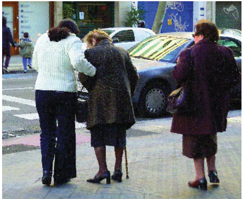
L'ajut a les persones grans és un dels serveis prioritaris.

ment a determinats llocs i, fins i tot, l'educació d'hàbits. Existeixen serveis complementaris, com el de neteja o el de bugaderia.