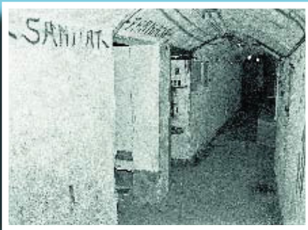
Passadís del refugi de la plaça Revolució, desaparegut l'any 1994.

Si té fotografies o documents del seu barri, en pot fer donació a l'Arxiu Municipal del Districte, 93 285 03 57