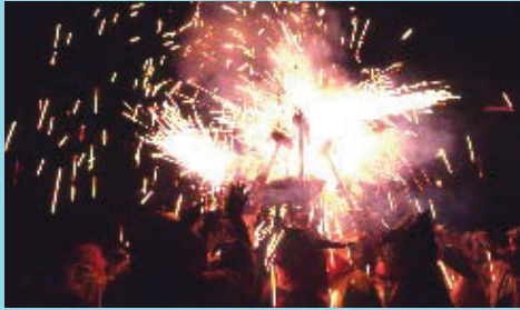
Els focs artificials són millors si els utilitzem amb seguretat.