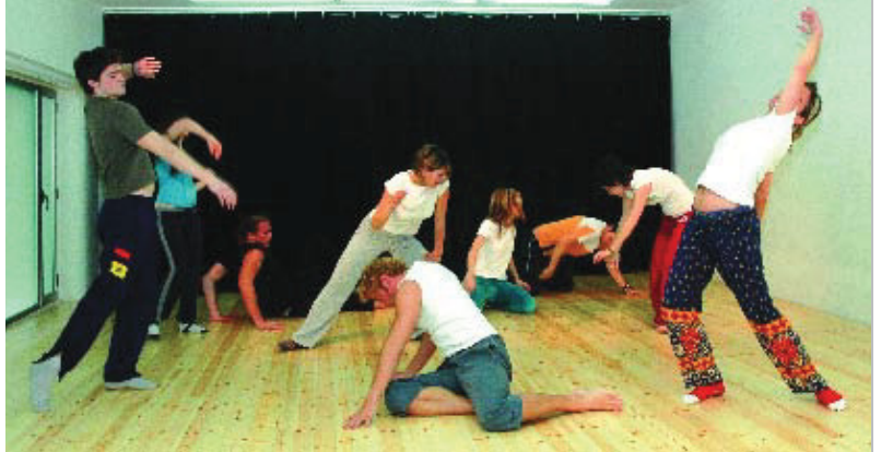
Alumnes de l'escola durant l'assaig d'una obra.