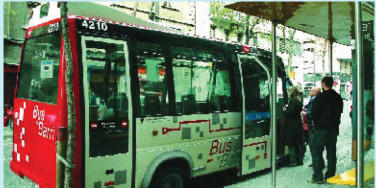
Els busos de barri van ser utilitzats el 2005 per 3.400.000 viatgers.

La línies de bus de barri 114, 116 i 124, que recorren els carrers de Gràcia, funcionen des d'ara també els diumenges i els festius