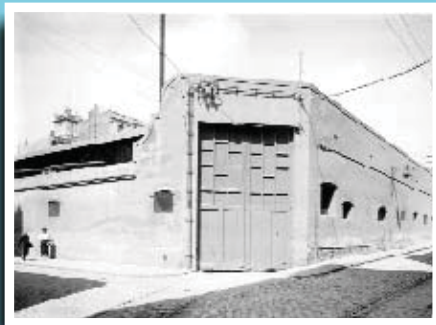
Porta d'entrada a l'antiga cotxera de l'Ensanche, a la cantonada del torrent de les Flors amb Bruniquer, l'any 1958.

Si té fotografies o documents del seu barri, en pot fer donació a l'Arxiu Municipal del Districte, 93 285 03 57