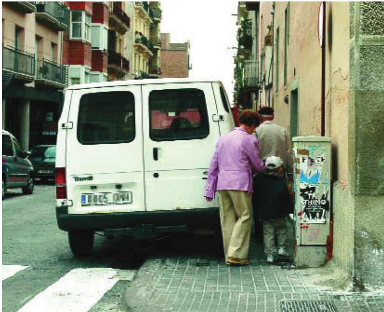
El vianant recuperarà el protagonisme al centre de la vila.

L'espai comprès entre els carrers Providència, torrent de les Flors, torrent de l'Olla i travessera de Gràcia es convertirà en una gran illa de vianants. Veïns, comerciants, industrials i artesans hi podran continuar accedint