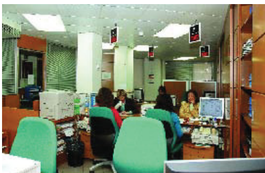
L'Oficina d'Atenció al Ciutadà tindrà instal·lacions noves.