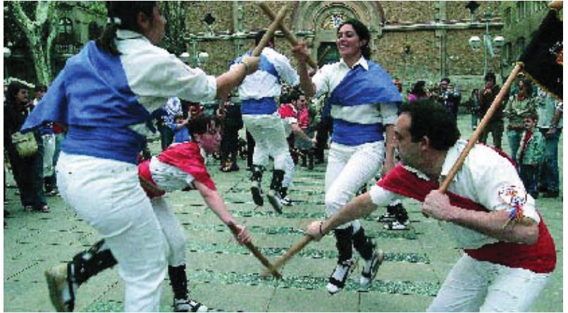
Els actes commemoren la Revolta de les Quintes (1870).