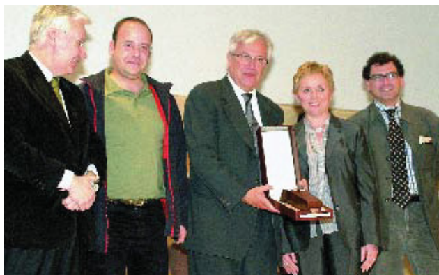
La presidenta de l'Associació d'Artesans rep el premi de mans de l'alcalde Clos.