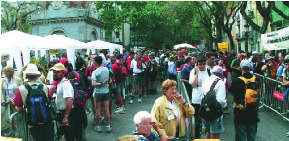
La plaça de Rius i Taulet és el punt de partida de la marxa.

La XIX edició de la Marxa Gràcia – Montserrat, que se celebrarà els pròxims dies 20 i 21 de maig, ha de ser coberta pels marxadors en un temps màxim de 18 hores