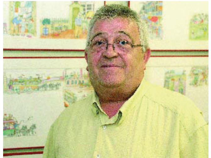
Lavi i el pare de Torres ja vivien amb passió la Festa Major.

Amb el suport de tots els carrers, vam començar a buscar col·laboracions amb