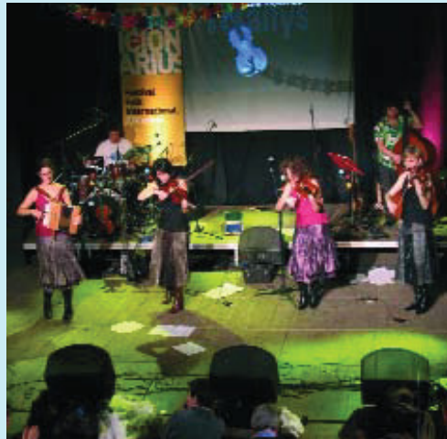
El concert del desè aniversari de Les Violines va ser una gran festa.

La formació va celebrar el seu desè aniversari als Lluïsos de Gràcia, acompanyada d'artistes com Gerard Quintana o Kepa Junquera