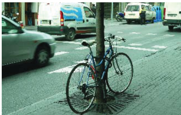
Les bicis mal aparcaes, un dels molts problemes detectats.

El Districte ha posat en marxa un pla pilot per eradicar l'incivisme i les pràctiques indègudes al carrer de Gran de Gràcia, al tram que hi ha entre el Pla de Nicolás Salmerón i la travessera de Gràcia. Si la prova funciona, s'estendrà a altres zones del districte. El pla pilot, que es va desenvolupar del 23 de gener al 28 de febrer, ha constatat d'una fase informativa i una altra, posterior, sancionadora. Abans de la campanya, es va fer una diagnosi per conèixer exactament els problemes que calia combatre, que han estat bàsicament les motos a les voreres, les bicicletes unides als fanals i les bosses d'escombraries deixades a les papereres.