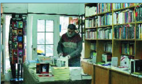
Fundada el 1976, Cap i Cua compleix 30 anys el desembre.