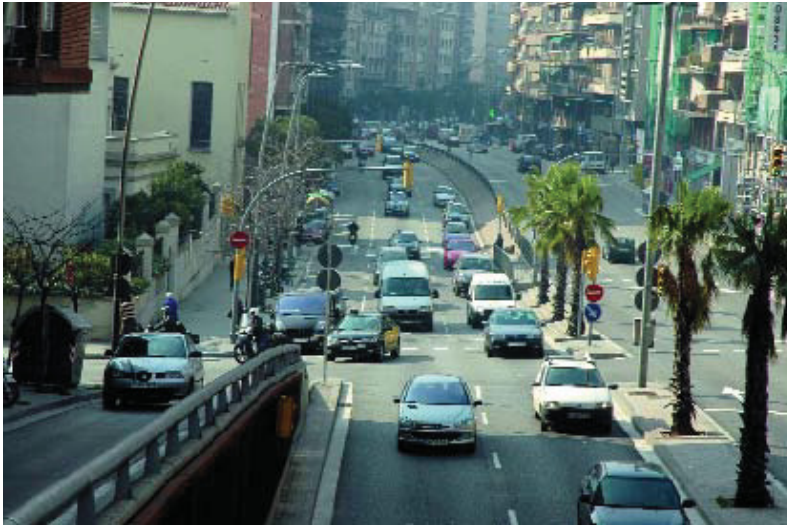
La ronda es remodelarà entre el carrer Escorial i la via Augusta.

Durant la dècada dels setanta, la travessera de Dalt va separar els barris i va convertir-se en un espai problemàtic que no satisfia ni els veïns ni l'Ajuntament democràtic. Ara la ronda es transformarà en un projecte que és el resultat d'un intens procés de participació ciutadana