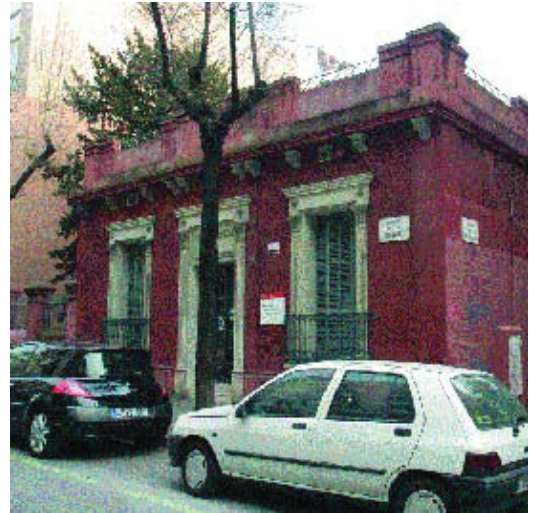
Les noves instal·lacions del CIRD estaran al carrer Camèlies, 36-38.

L'espai que encara està ocupant s'ha quedat petit per a tots els serveis que es volen oferir. Ara tenen un fons bibliogràfic i audiovisual molt important d'una gran varietat de temes que tracten aspectes relacionats amb les dones. A les noves instal·lacions, s'hi podrà ampliar aquest fons i tenir-lo tot en un sol recinte –ara està repartit entre diferents espais–, es disposarà d'una sala de consulta i estudi amb capacitat per a 14 persones, que es podrà adaptar per fer-hi actes. També hi haurà una aula per impartir-hi classes i tallers, una sala de vi-