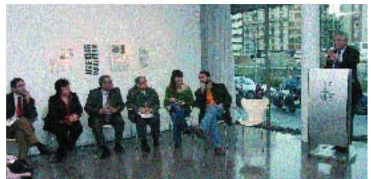
L'alcalde va presentar el projecte a la Biblioteca Jaume Fuster.

instal·larà el sistema de recollida pneumàtica d'escombraries. El pressupost de la transformació de la ronda de Mig és d'uns 25 milions d'euros. Tot i que es preveu que l'obra estigui enllestida en uns nou mesos, el seu calendari d'execució està vinculat al projecte de la L9 a la plaça de Lesseps, que actualment es troba en fase de remodelació.