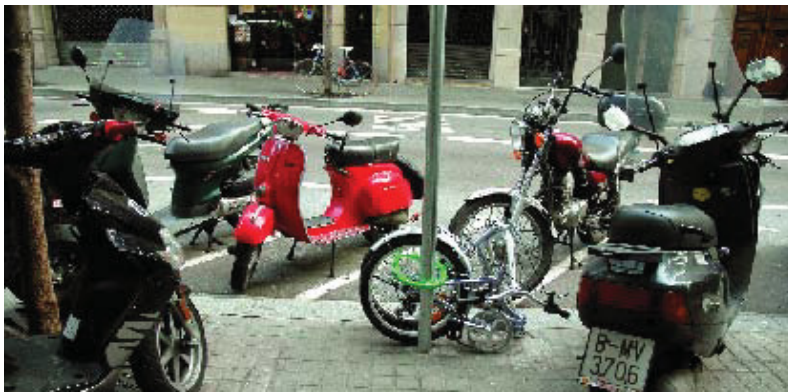
Motos aparcades a les voreres de Gran de Gràcia.

Aquest mes de març és un mes d'avaluació i balanç. Si funciona, la intenció és estendre el pla a altres zones del districte.