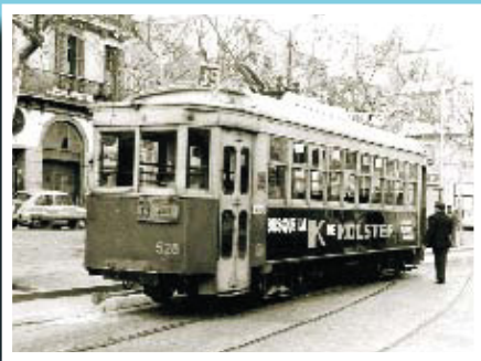
Un dels darrers tramvies que va circular per la plaça Rovira, el 5 de febrer de 1968.

Si té fotografies o documents del seu barri, en pot fer donació a l'Arxiu Municipal del Districte, 93 368 45 66