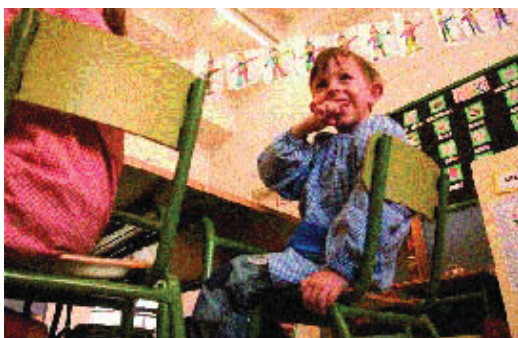
El Pla vol apropar escola i societat.