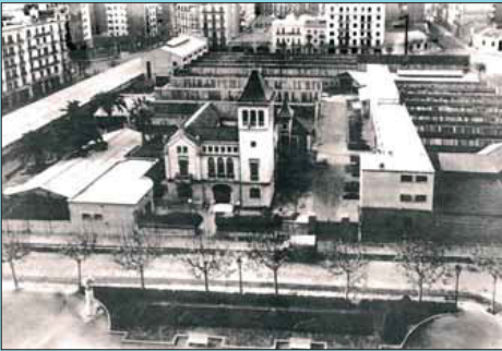
Abans La fàbrica Elizalde vista des del passeig de Sant Joan.

Si té fotografies o documents del seu barri, en pot fer donació a l'Arxiu Municipal del Districte. T. 93 285 03 57