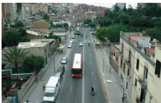
En una consulta popular, el 71,2 % dels veïns va optar pel nou nom.