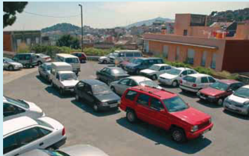
Aquest és l'aspecte actual de la plaça Laguna Lanao.

El Consell de barri del Coll, celebrat al principi de juny al Centre Cívic El Coll, va ser especialment participatiu; la major part d'intervencions van ser per fer propostes concretes