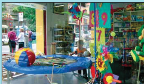
Trenta-cinc comerços graciencs participen en la iniciativa.

Ampliat amb l'objectiu que els aparadors de les botigues de Gràcia facin encara més goig, l'Ajuntament de Barcelona ha iniciat una col·laboració amb l'escola d'aparadorisme ARTiDI i alguns comerciants associats de Gràcia. Aquesta iniciativa té dos objectius, un adreçat al comerç i l'altre a l'educació. D'una banda, inclou dos tallers de tècniques d'aparadorisme per als botiguers interessats a conèixer les noves tendències en el món comercial, impartits per professors de l'escola ARTiDI. De l'altra,