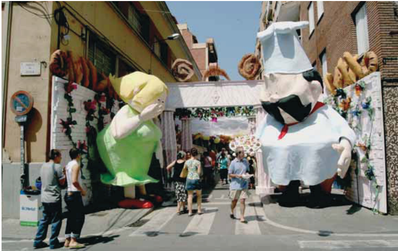
Els veïns de dalt del carrer Verdi van guanyar el segon premi de la Festa Major de l'any passat.

Fruit d'un acord sense precedents, les subvencions a la Festa passen dels 215.000 euros de l'any anterior als 380.000 d'aquest. "No creïem que fos possible", reconeixen els organitzadors