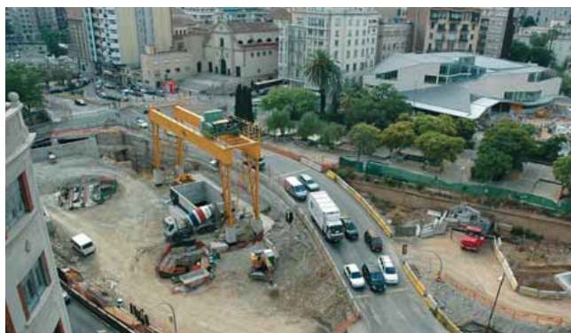
Aspecte actual de les obres de la plaça Lesseps.

Després de molts anys de negociacions, aviat començaran les obres de remodelació de la plaça de Lesseps, espai urbà que des dels anys setanta havia esdevingut una fractura, violenta i sorollosa, entre els barris de Vallcarca, la Salut i Gràcia. La seva humanització havia estat una reclamació que finalment es farà realitat gràcies a un projecte consensuat socialment que combina les necessitats de la mobilitat dels vehicles amb els espais destinats als vianants. A la remodelada plaça, presidida per la nova biblioteca pública i l'emblemàtica església dels Josepets, hi haurà una font-monument en memòria del diplomàtic francès que li dona nom: Ferdinand de Lesseps.