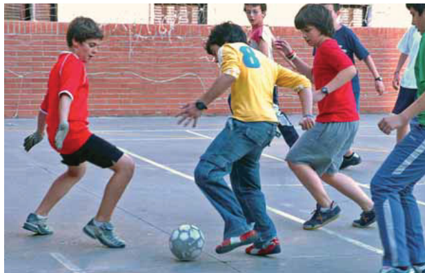
El futbol sala és un dels esports que es practiquen a l'Associació.

Més de 800 nens fent activitats extraescolars durant el curs, i més de 1.500 a l'estiu, fan de l'Associació Esportiva Gràcia un veritable motor de l'esport i l'educació