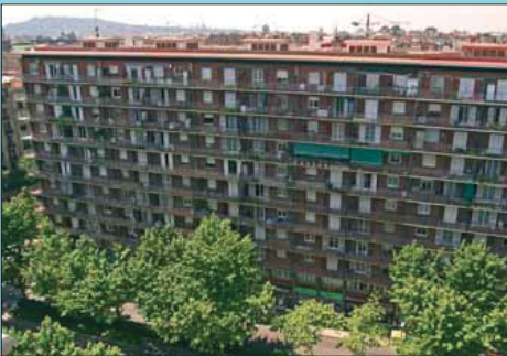
Ara Un dels blocs d'habitatges barra la visió dels espais interiors de l'illa.