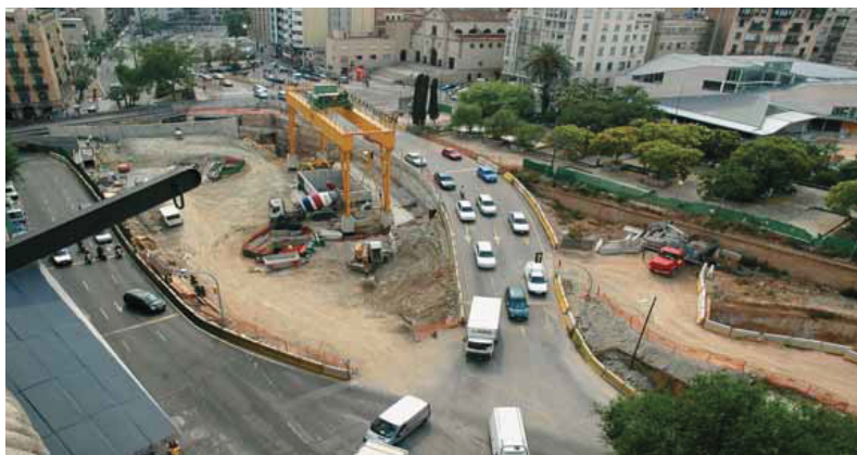
La previsió és completar la transformació de la plaça Lesseps en tres anys.

Una font-monument recordarà el cèlebre diplomàtic francès que va projectar l'obertura del canal de Suez, a Egipte, pas que comunica el Mediterrani amb la mar Roja des de 1869. Ferdinand-Marie de Lesseps (1805-1894) fou cònsol de França a Barcelona entre els anys 1842 i 1848 i es va destacar en la defensa de la ciutat durant els bombardejos del general Espartero des del castell de Montjuïc. Lesseps va viure en una torre a tocar de la plaça, que porta el seu nom des de poc després de la seva mort.