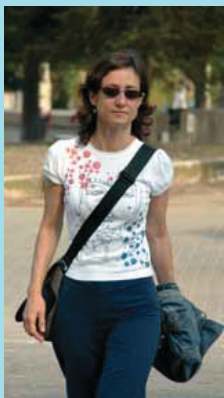
És millor portar la bossa en bandolera i no al costat.