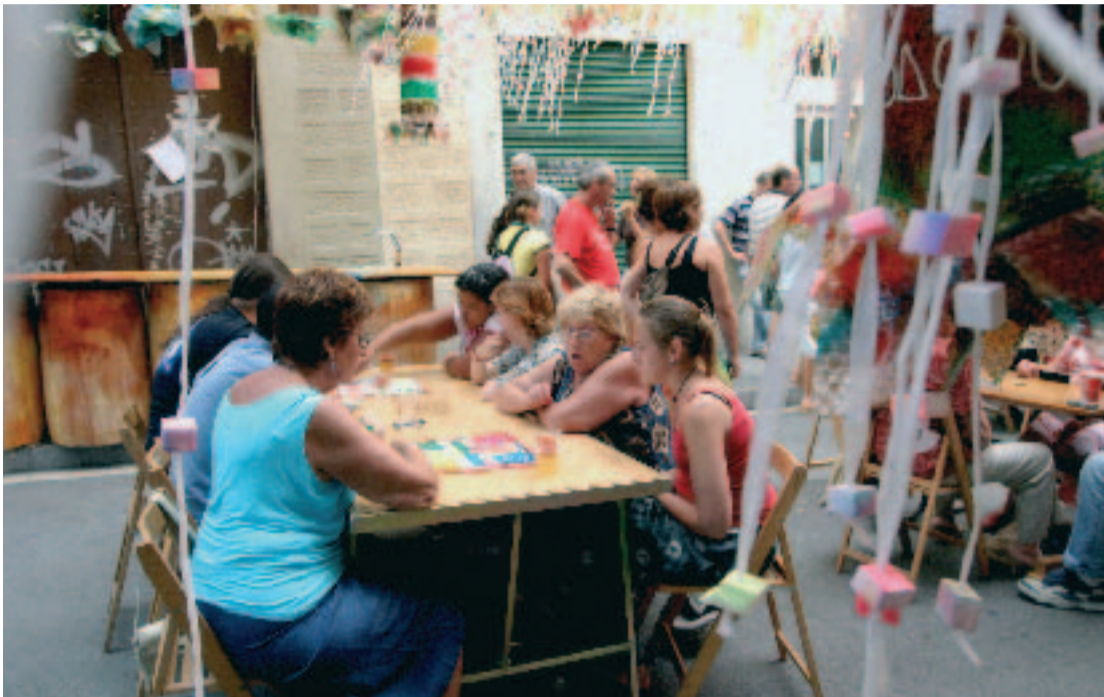
Veïns del carrer Joan Blanques (de dalt) durant la Festa Major de l'any passat.