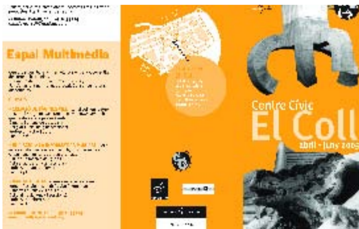
Imatge del fullet informatiu del Centre Cívic El Coll abril-juny 2005.

El Centre Cívic El Coll disposa d'un espai multimèdia, que ofereix cursos, accés lliure a Internet, jocs en xarxa i consulta de correu electrònic, entre altres serveis. Pròximament al centre es faran 4 cursos. El primer és el de Creació de pàgines web, Consta de 8 sessions i tindrà lloc del 3 al 26 de maig, el dimarts i el dijous de 20 a 22 h. El preu d'aquest curs és de 23 €. El segon curs és el d'Iniciació