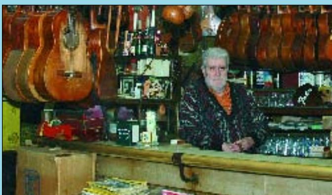
La barra del local, amb algunes de les guitarres.