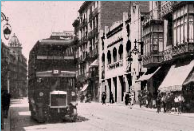
Abans El cinema Smart a la cantonada de Ros de Olano amb Gran de Gràcia, l'any 1932.

Si té fotografies o documents del seu barri, en pot fer donació a l'Arxiu Municipal del Districte. T. 93 285 03 57