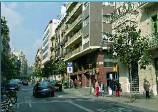
Ara Un gran immoble d'habitatges domina la cantonada.