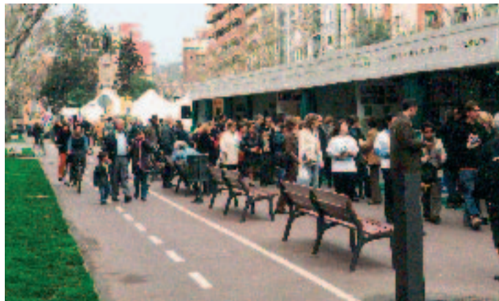
Una imatge de l'última Mostra d'Entitats, fa dos anys.

A mitjan abril, Gràcia celebrarà al passeig de Sant Joan la seva III Mostra d'Entitats. En aquesta trobada de caràcter bianual s'hi podrà veure una novetat significativa: l'estand del "G6". Sota aquest nom, tan propi de l'alta política o del futbol, s'han agrupat sis de les entitats amb més pes de l'antiga Vila de Gràcia: l'Orfeó Gracienc, els Lluïsos de Gràcia, el Centre Moral i Instructiu, el Cercle Catòlic, la Federació de Festa Major i la Federació de Colles de Sant Medir. Aquestes entitats s'han agrupat per oferir serveis comuns als seus socis, els quals, a canvi d'una única quota –la que ja pagaven– es beneficiaran de serveis que presten les altres entitats, com ara les sessions de teatre