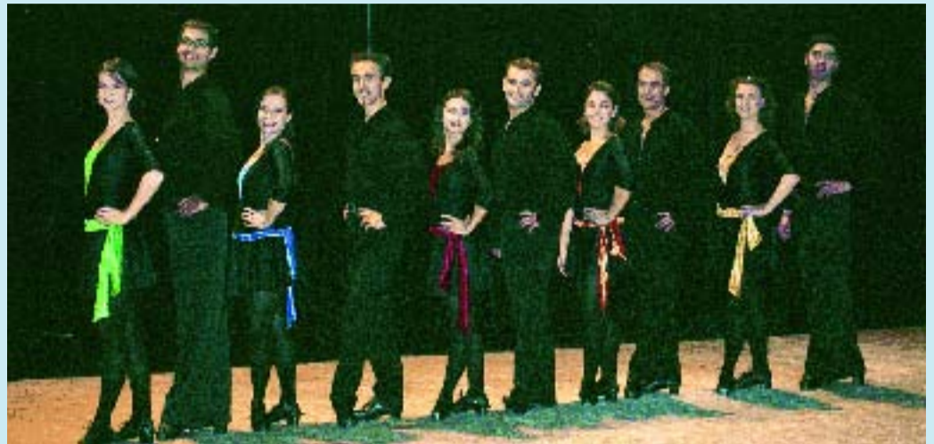
El grup Celtic Caos ha participat al festival El Feile, al Centre Artesà Tradicionari.