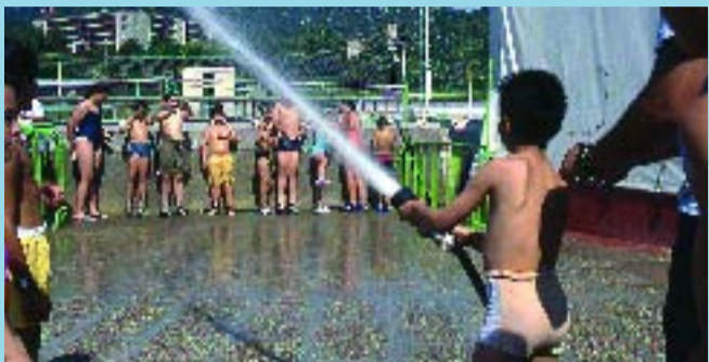
Les activitats van adreçades a infants i joves fins a 17 anys.