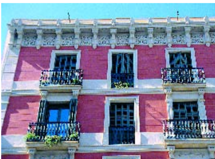
Les subvencions suposen el 30% del cost de les obres de rehabilitació.

L'Oficina de Rehabilitació de Gràcia és l'organisme que ofereix assessorament i tramita les sol·licituds d'ajuts de les obres de rehabilitació que es fan al districte. Des de l'any 2000, 435 edificis de Gràcia han obtingut ajuts per actuar sobre elements comuns, i 115 habitatges particulars s'han rehabilitat en l'interior