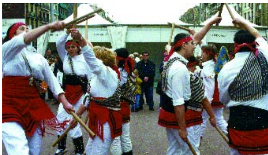
Els bastoners de Gràcia en una exhibició de l'última Mostra d'Entitats.

La pròxima celebració de la Mostra d'Entitats (15, 16 i 17 d'abril), fa que ara sigui un bon moment per fer un repàs a l'estat del moviment associatiu a Gràcia. S'observa una clara tendència a la concentració d'esforços per tal d'arribar a més socis. L'exemple més clar és la constitució del G6, un grup format per les entitats amb més història de la Vila de Gràcia, de cara a oferir serveis conjunts als seus socis a canvi de la quota que ja pagaven. De cara al futur, s'espera l'arribada de nous equipaments (biblioteca de Lesseps, locals de La Violeta) que milloraran la disponibilitat d'espais on fer activitats, una de les principals necessitats de les associacions.