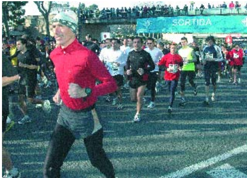
Uns 2.000 atletes van córrer per Barcelona el 6 de març.

La climatologia també va fer costat a l'organització i als participants, i