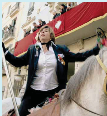
La desfilada de Sant Medir tindrà lloc el 3 de març.

De les 29 colles que hi ha a Barcelona, 23 són de Grà-