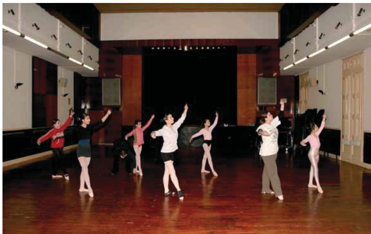
A La Violeta ara fan diverses activitats culturals.

L'acord entre l'Ajuntament i la immobiliària Vervat & van der Veen ha tardat deu mesos a arribar, i es basa en un intercanvi de propietats: Barcelona es queda La Violeta, i la companyia holandesa, un solar al número 100 del carrer Verdi. A més, el volum