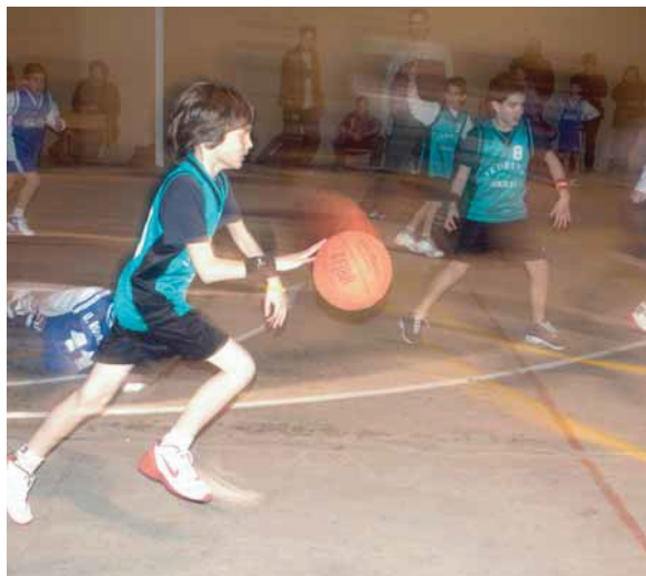
Disset dels vint equips de bàsquet de l'escola participen en competicions.

L'Escola Vedruna, escola privada concertada del barri de Gràcia, és partidària que la formació dels seus alumnes no s'acabi a les aules i que es complementi amb activitats extraescolars i lúdiques que ajuden a la formació integral de nois i noies. A la vegada, aquestes activitats vinculen encara més els alumnes a l'escola. Entre les moltes activitats extraescolars i esportives que realitza l'escola, el bàsquet és la que ha aportat més èxits i ha distingit l'escola dintre del món d'aquest esport.