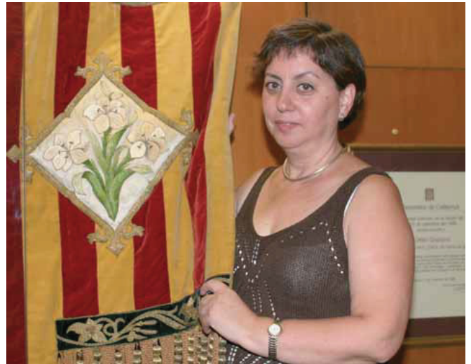
Per a la Josefina, les entitats són més que un lloc d'esbarjo.

Va néixer a “El Nostre Casal”. El vam crear un grup de gent que volíem fer teatre. I vam bastir un teatre, després vam seguir un camí itinerant per dife-