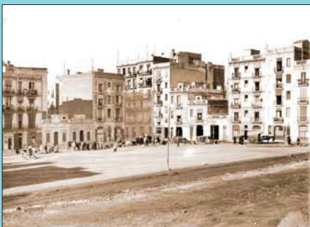
Abans Aspecte que oferia la plaça l'any 1931.

Si té fotografies o documents del seu barri, en pot fer donació a l'Arxiu Municipal del Districte, tel. 93 285 03 57