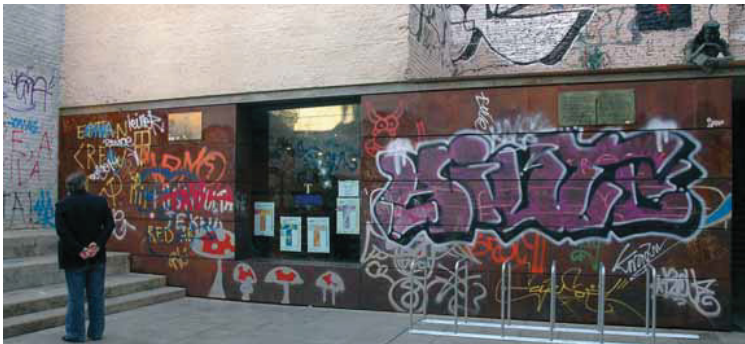
La reforma del CAT servirà també per millorar l'aspecte actual de la plaça Anna Frank.