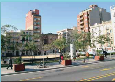
Ara Amb la construcció del pàrquing i la reurbanització, la plaça ha guanyat en extensió i accessibilitat.