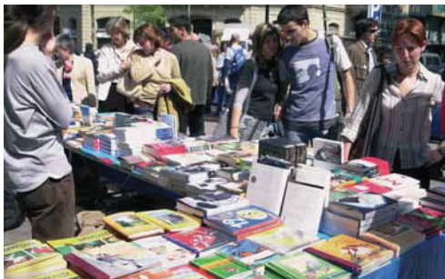
El projecte es diu “Celebrem un Sant Jordi diferent i sostenible”.

Enguany, una de les deu iniciatives reconegudes amb els Premis Acció 21 ha estat el projecte “Celebrem un Sant Jordi diferent i sostenible”, presentat per l'AMPA de l'IES Vila de Gràcia. Es tracta d'una iniciativa desenvolupada conjuntament pel CEIP J.M. Jujol, els CEIPM Patronat Domènec i Reina Violant i les biblioteques públiques Julià de Capmany i Vila de Gràcia.