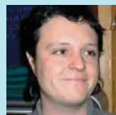
Xavi Urbano Ateneu La Torna

Para muchos se ha convertido en un lugar de encuentro para conocer gente de todas las edades, es un espacio muy auténtico. Ayuda a crear un buen clima en el barrio.