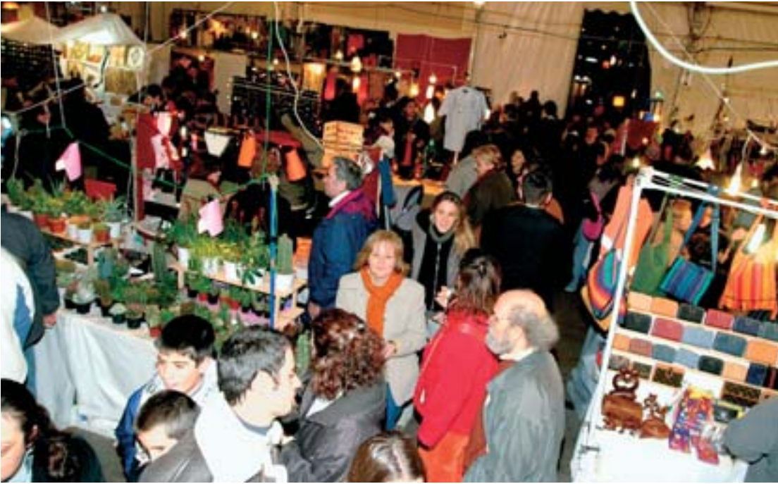
Un clàssic del Nadal a Gràcia és la fira de l'envelat a la plaça del Diamant.

Els centres culturals també han programat tota una sèrie de concerts nadalencs i un ball per a la gent gran. La recollida de joguines es farà als mercats