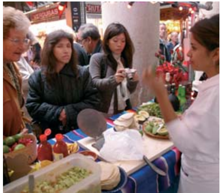
La primera jornada de les "Cuines del món" es va celebrar a la Boqueria.

Dins d'aquest context s'inscriuen les jornades "Cuines del món 2004" que acull el mercat de l'Abaceria. Aquestes jornades, organitzades