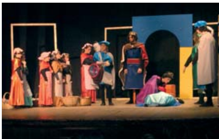
En l'edició d'enguany participen cinc grups teatrals.

El trofeu Vila de Gràcia de teatre infantil i juvenil, organitzat pels Lluïsos i pel Casal Corpus Grup de Teatre, tanca el 12 de desembre la seva cinquena edició amb novetats. El guanyador del concurs, que com és habitual es coneixerà el mateix dia de la cloenda, presentarà el seu muntatge al Teatre Lliure el 2005, dins del marc de la mostra Salta a l'escenari de l'Institut Municipal d'Educa-