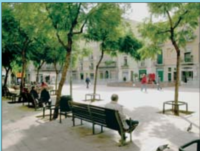
Ara els arbres, els bancs i els jocs infantils han donat vida a l'espai.