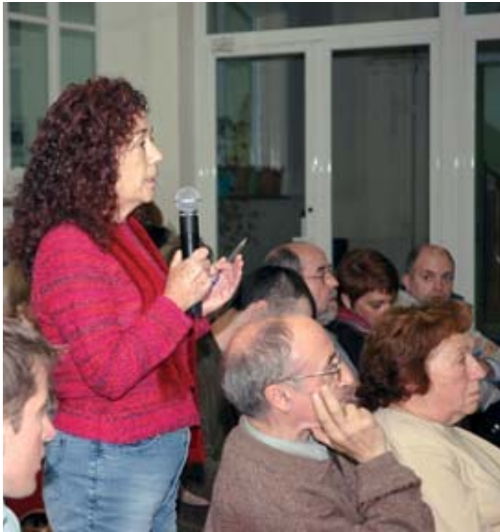
Una veïna intervenint en el consell celebrat el dia 11 de novembre.