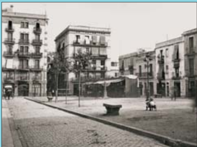
Abans cap a l'any 1920 l'indret oferia un aspecte poc acollidor.

Si té fotografies o documents del seu barri, en pot fer donació a l'Arxiu Municipal del Districte, 93 285 03 57