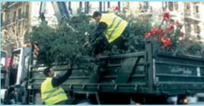
Els arbres recollits són triturats i convertits en compostatge.