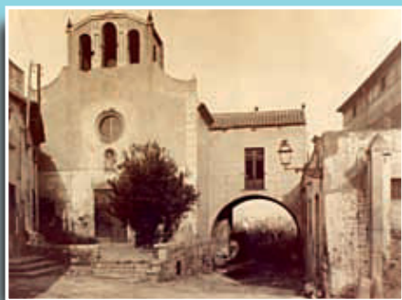
Imatge del conjunt monumental de Santa Eulàlia de Vilapicina. (Foto: Arxiu Històric de Roquetes-Nou Barris).

Si té fotografies o documents del seu barri, en pot fer donació a l'Arxiu Municipal del Districte, 93 291 67 26