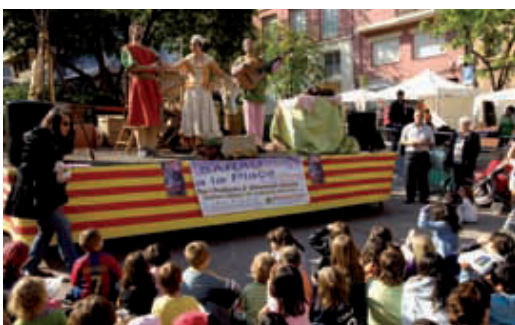
Representació teatral a la Festa Major del Baix Guinardó d'enguany.