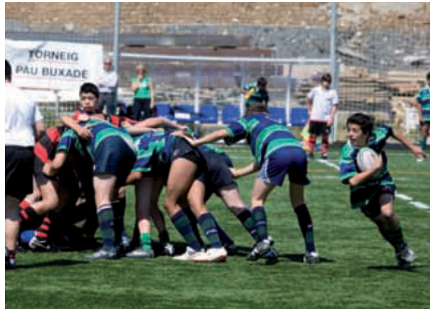
Un moment d'un dels partits del Memorial Pau Buxadé.

La jornada esportiva estava organitzada de tal manera que el nombros públic assistent va poder gaudir de diferents partits entre el Químic ER contra el Sitges RC (infantils), contra l'INEF Lleida (juvenils) i contra una