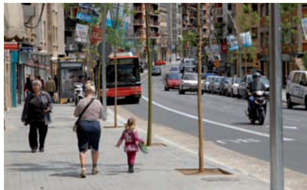
Mare de Déu de Montserrat, després de la remodelació.

Coincidint amb la Festa Major de Can Baró, el proper 19 de juny s'inauguraran dues obres impulsades per l'Ajuntament al districte d'Horta-Guinardó: la remodelació de l'avinguda Mare de Déu de Montserrat, entre la plaça Sanllehy i el carrer La Bisbal, i les escales mecàniques que salven un desnivell de 14 metres entre la carretera del Carmel i el carrer José Millán González. Les actuacions que s'han dut a terme a l'avinguda Mare de Déu de Montserrat, una de les grans artèries del districte, han consistit en una remodelació integral que inclou una nova pavimentació i enllumenat públic, a més del soterrament de les línies elèctriques aèries i la instal·lació de nous semàfors.