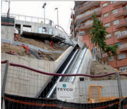
Les noves escales entre la carretera del Carmel i José Millán González.

El proper 19 de juny, en plenes festes de Can Baró, s'inauguraran dues obres que canviaran substancialment la vida del districte: la remodelació de part de l'avinguda Mare de Déu de Montserrat i les escales mecàniques que salvaran el desnivell de 14 metres que hi ha entre la carretera del Carmel i el carrer José Millán González. La de més entitat és la de la segona fase de l'avinguda Mare de Déu de Montserrat, que enllaça la travessera de Dalt i el passeig Maragall tot creuant els barris de Can Baró i el Guinardó. En concret, l'obra que quedarà enllestida el mes de juliol se centra en el tram d'aproximadament 2 quilòmetres entre la plaça Sanllehy i