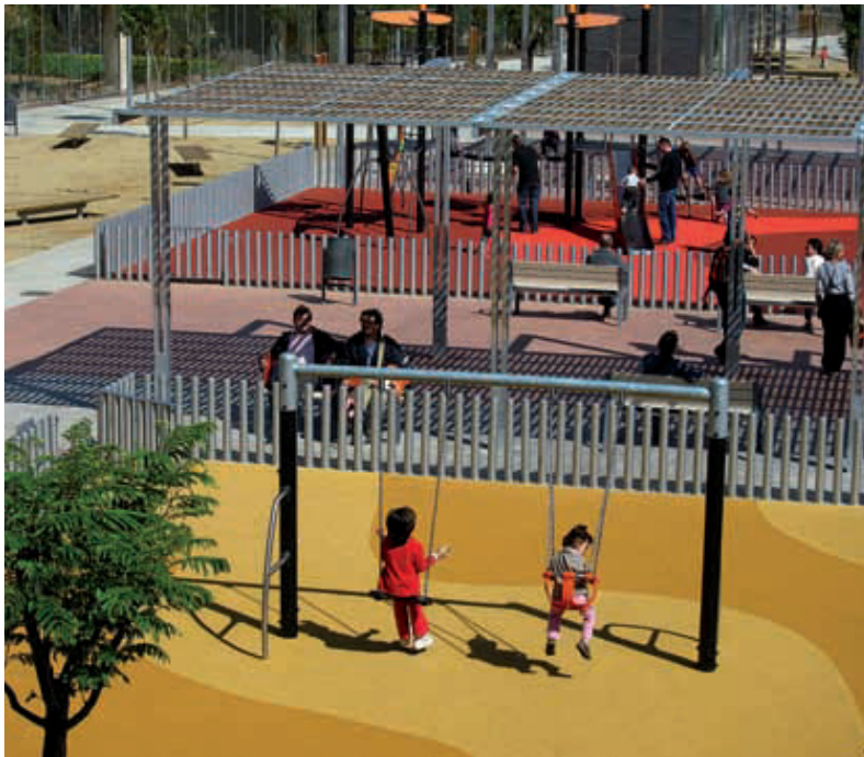
Una de les àrees de joc infantil del nou parc.

Des de final d'abril, el parc de la Unitat torna a ser un espai de lleure per al veïnat d'Horta. El parc ha retornat a l'espai públic després d'una profunda reurbanització