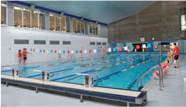
Una imatge de les instal·lacions renovades.