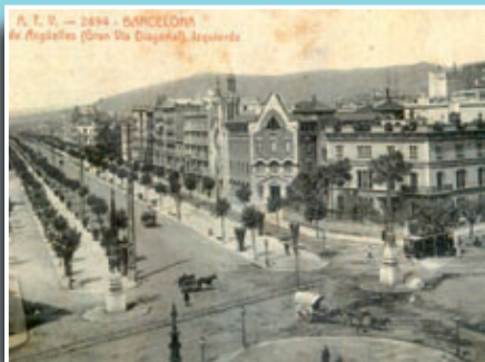
El carrer d'Argüelles (Diagonal) amb l'encreuament del pg. de Gràcia.

Si té fotografies o documents del seu barri, en pot fer donació a l'Arxiu Municipal del Districte, 93 291 67 26