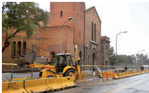
La segona fase de les obres encara la recta final.

La segona fase de remodelació de l'avinguda Mare de Déu de Montserrat –entre el carrer Secretari Coloma i el carrer la Bisbal– ja està en marxa i es preveu que les obres s'acabin el proper mes de juliol. Durant aquest període es canviaran els paviments, se substituirà el mobiliari urbà, s'instal·larà un nou enllumenat, nova senyalització i nous semàfors. També es reforçarà la xarxa de drenatge i se soterraran les línies elèctriques, s'implantarà una nova xarxa d'aigua potable, una xarxa contra incendis i una nova xarxa de reg automàtica, entre altres actuacions destinades a millorar aquest espai públic de 34.000 m².