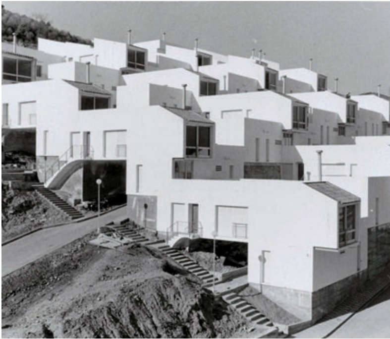
Una imatge del barri, l'any 1968.

Ajuntament i moviment associatiu, amb el suport del Districte, celebren l'efemèride amb un programa d'activitats que inclou un llibre i una exposició