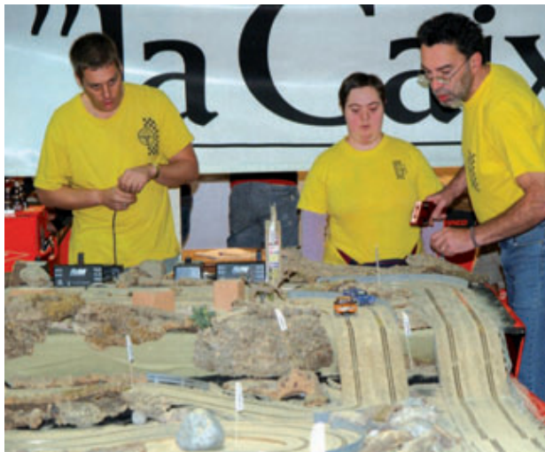
Imatge de la primera edició del Rally Winter.

Aquesta entitat, sense ànim de lucre i reconeguda per la Generalitat de Catalunya des del 2006, va néixer fa uns 10 anys amb "l'organització del primer Ral·li slot per la Festa Major d'Horta –expliquen–; una cursa pensada per la gent del barri i on, amb la il·lusió dels nostres fundadors i en els locals del Lluïsos d'Horta, començarem aquesta aventura que és el Club Slot Horta".