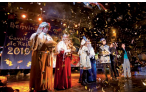
Un moment de la cavalcada de Reis del passat dia 5 de gener.