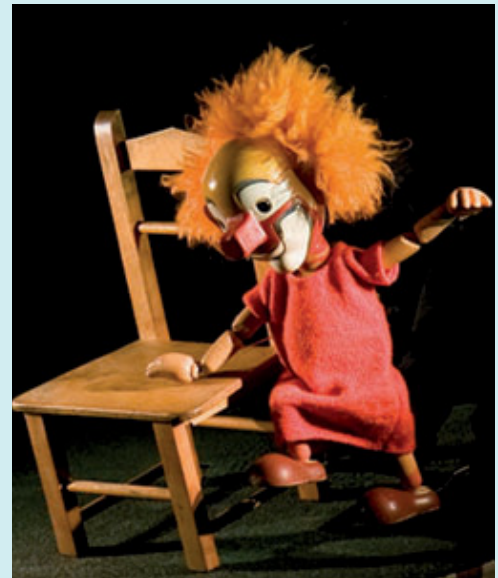
Moment de l'espectacle inaugural del 15è aniversari.