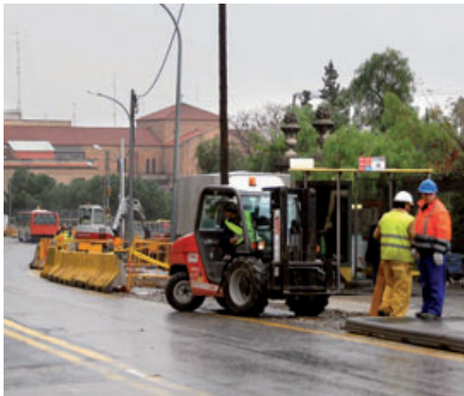
Les obres es fan entre els carrers Secretari Coloma i La Bisbal.

Aquesta segona fase consisteix en diverses obres de remodelació del tram comprès entre el carrer Secretari Coloma i el carrer La Bisbal. Actualment, s'estan duent a terme els treballs al costat de mar de l'avinguda Mare de Déu de Montserrat en dos trams: entre Castillejos i Cartagena, que té una durada prevista d'un mes i mig, i entre Cartagena i La Bisbal, amb una durada prevista de dos mesos. És previst que totes les actuacions de reforma i millora acabin el proper mes de juliol, incloent-hi també les refor-