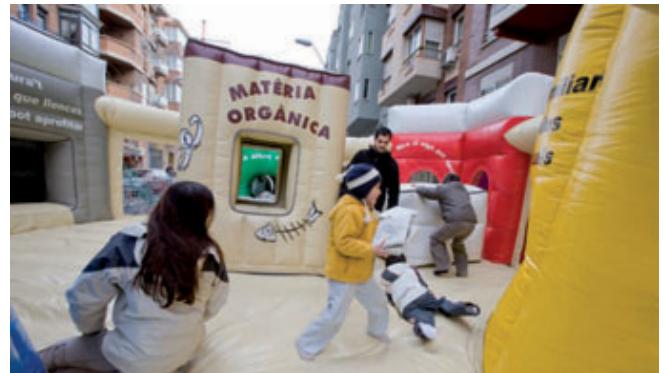
Activitats infantils a la festa de Sanllehy Comerç.