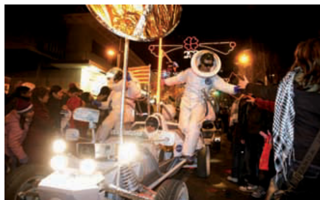
Una imatge d'arxiu de la cavalcada de Reis.

Les festes de Nadal arriben a Horta-Guinardó plenes d'activitats i de bones propostes. Tot i la conjuntura mundial, potser els Reis Mags no portaran tants regals, però sens dubte arriben ben carregats d'activitats, propostes i de l'autèntic sentit del Nadal com l'amistat, la germanor i les bones estones compartides amb la família i els amics en la participació en qualsevol de les activitats que han organitzat les diferents entitats del districte. Impossible no gaudir del Nadal, amb la gran cavalcada de Reis, les activitats a les biblioteques, els pessebres vivents o la fira de vins, entre d'altres.