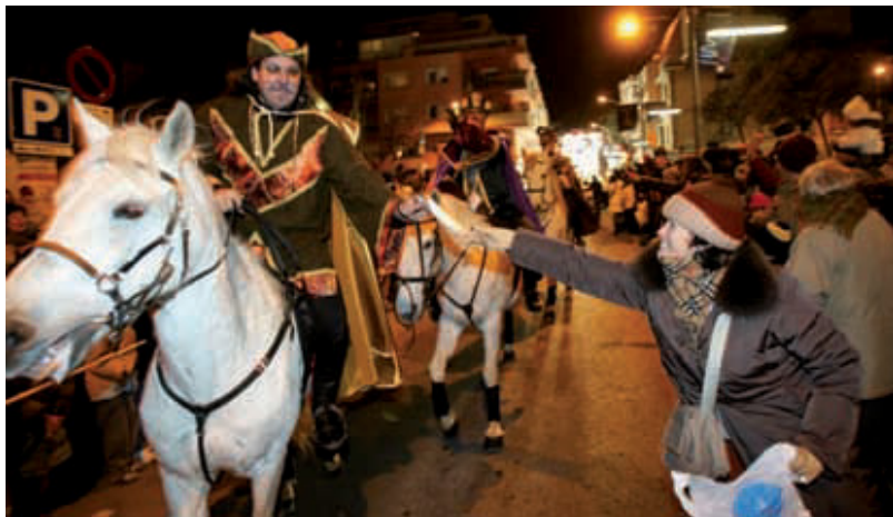
La cavalcada de Reis és una de les principals activitats del Nadal.

Enguany, les festes de Nadal al districte ofereixen un munt d'activitats per a grans i petits, perquè puguin passar-s'ho d'allò més bé en companyia de la família i els amics