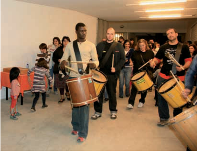
Tabalada durant la inauguració del casal de barri.