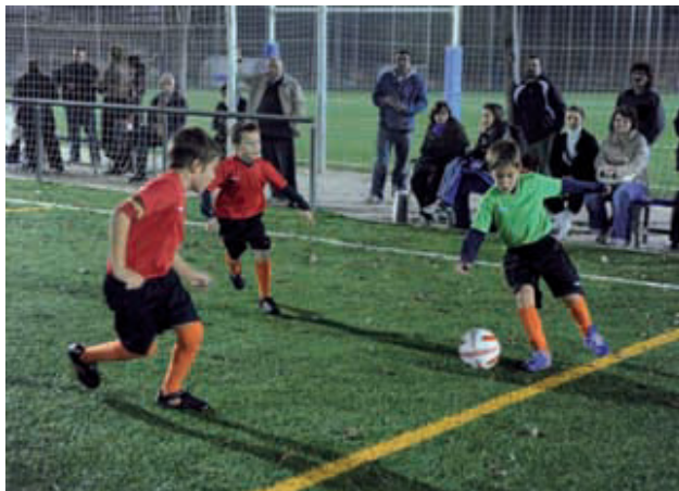
Partit dels alumnes de l'escola de futbol Hristo Stoitchkov de la Vall d'Hebron.

El director tècnic, que ahora també fa les funcions de coordinador de nou categories de la selecció catalana de futbol, afirma que intenten