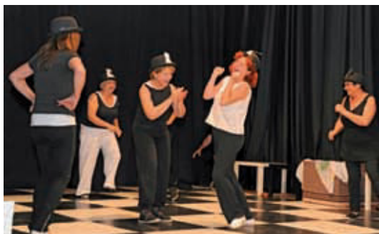
"Dames juguen i guanyen", una de les obres representades.