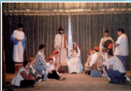
Imatge de la primera representació l'any 1993.

Si té fotografies o documents del seu barri, en pot fer donació a l'Arxiu Municipal del Districte, 93 291 67 26