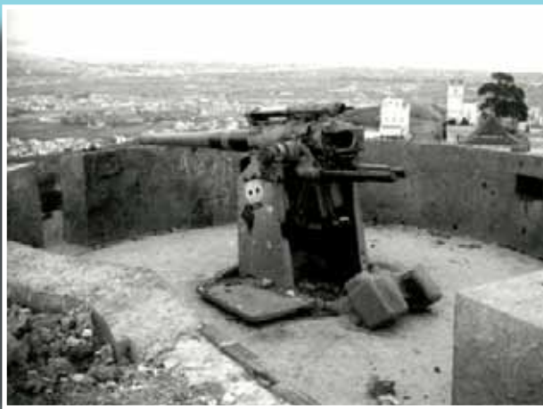
Una de les plataformes amb el seu canó Vicker del 10,5.

Si té fotografies o documents del seu barri, en pot fer donació a l'Arxiu Municipal del Districte, 93 368 45 66