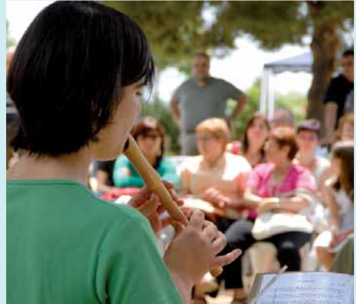
Un dels actes del Dia de la Música.

No hi ha dubte, però, que una de les propostes més agosarades de la programació va ser la celebració de concerts de música de grups de rock, pop, ska, rap i percussió, tots ells vinculats al centre cívic Carmel i al casal de joves del Coll, al mirador del parc Güell, al final del carrer Portell-Can Mora. L'activitat va resultar una impactant programació de concerts amb vistes a tota la ciutat, amb la participació dels grups Kaoticos, Trave-