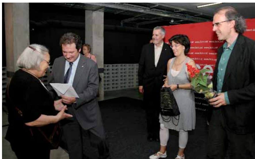
L'alcalde lliura les claus a una de les residents de la nova promoció d'apartaments.

La promoció d'apartaments amb serveis per a gent gran del carrer Can Travi, 30, ja està en funcionament. El passat 5 de juny es van lliurar les claus dels 81 apartaments en un acte al qual va assistir l'alcalde, Jordi Hereu. Aquesta promoció incorpora una millora considerable respecte a totes les que ja estaven funcionant amb anterioritat, i és que la producció d'aigua calenta sanitària i la calefacció estan centralitzades. Això vol dir que els nous apartaments substitueixen els radiadors per un termòstat amb què es regula la temperatura de la calefacció, la qual es controla des d'un sistema central per evitar problemes de seguretat. Al complex hi haurà també una ludoteca i un casal de barri.