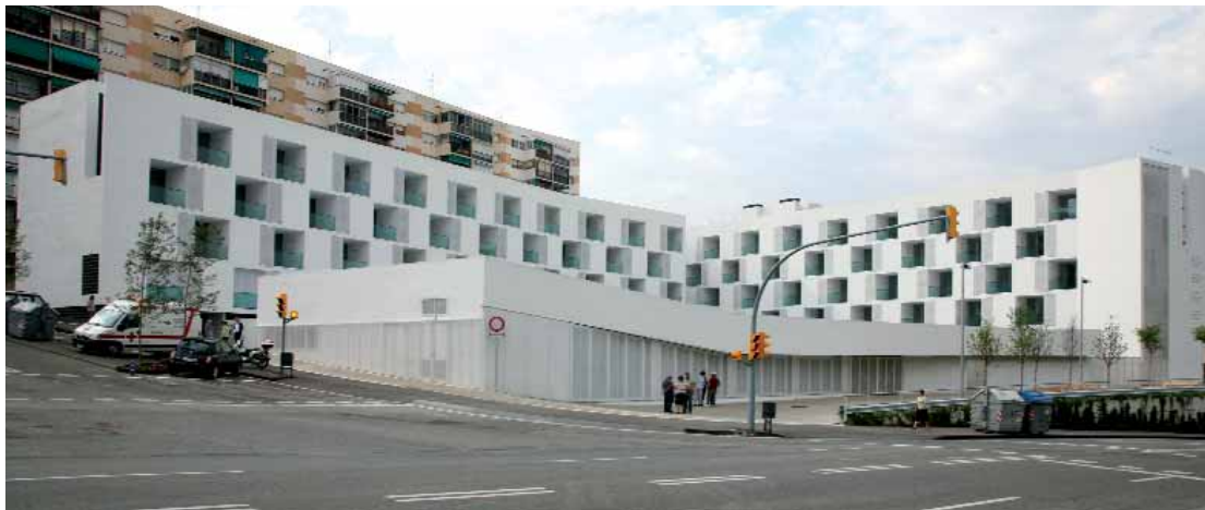
Els apartaments, amb l'edifici d'equipaments al pati central.