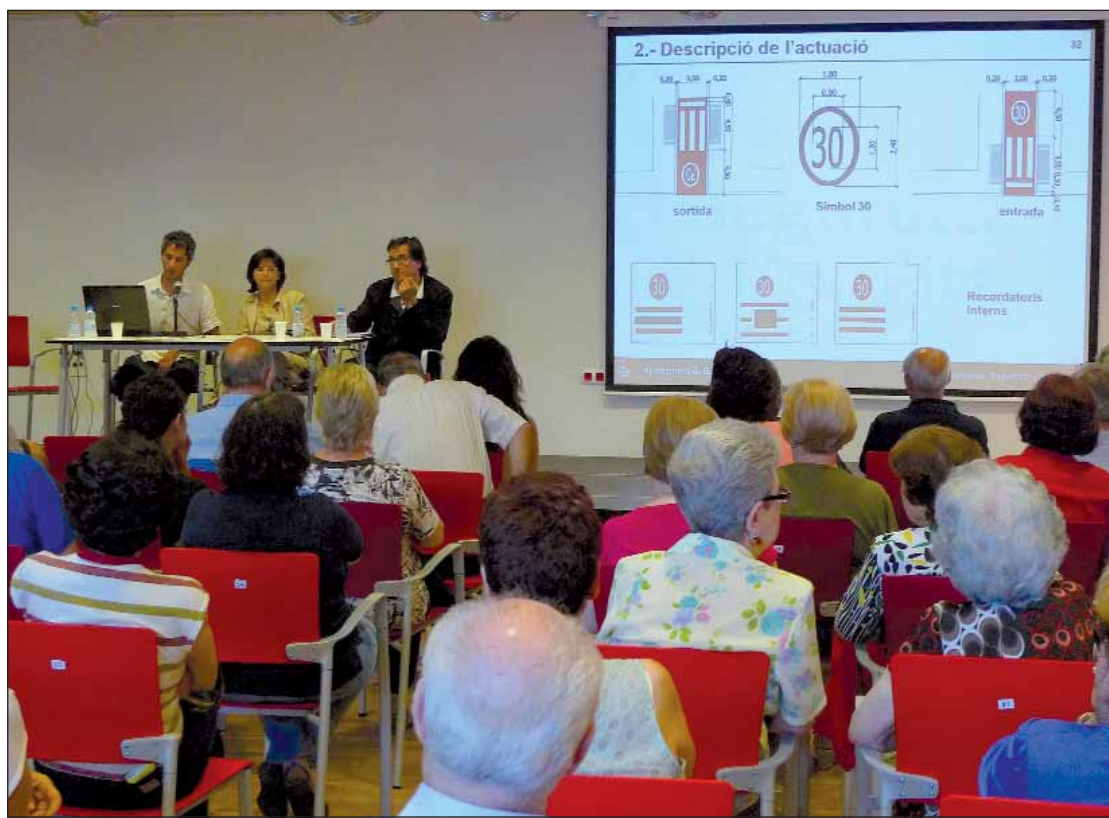
Moment de la reunió informativa al centre cívic Matas i Ramis.

Cap al mes d'agost els carrers centrals del barri d'Horta passaran a formar part de la Zona 30, que limita la velocitat dels vehicles a 30 km/h. L'objectiu és millorar la seguretat viària i el medi ambient