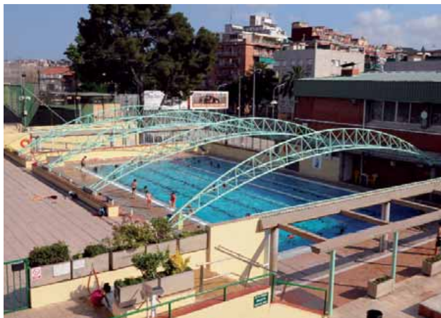
El centre tindrà dues piscines cobertes i una exterior.

El projecte global preveu la reconstrucció completa d'aquest centre esportiu d'Horta en dues fases ben diferenciades i definides, però que donaran un resultat final que facilitarà la possibilitat que els usuaris del CEM Horta puguin gaudir de dos pavellons poliesportius, dues piscines cobertes, una piscina exte-