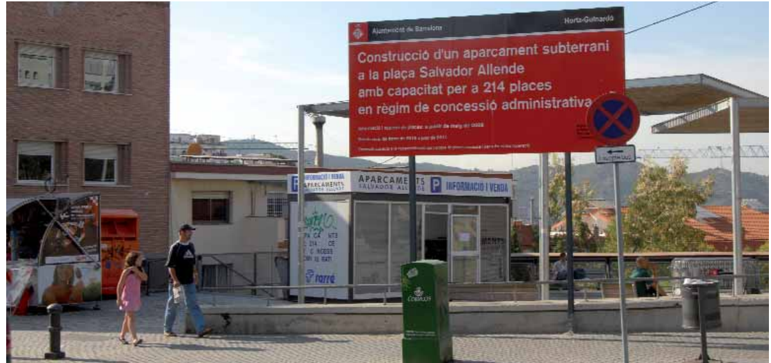
A la plaça Salvador Allende hi ha una oficina d'informació.

Els barris del Carmel i la Teixonera tindran en dos anys aparcaments subterranis per a residents, les places dels quals ja s'han començat a comercialitzar