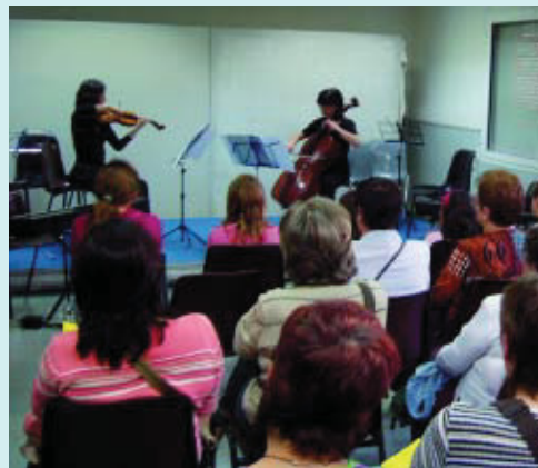
Un concert de l'anterior edició del cicle Clàssica a Horta-Guinardó.

El passat mes de març va començar el cicle Clàssica a Horta-Guinardó, que programa més d'una trentena de concerts de música clàssica interpretats per músics professionals i per joves estudiants de les escoles de música del districte. Entre les actuacions realitzades a data d'avui en diversos equipaments, hi destaquen la presentació, a la Biblioteca del Carmel-Juan Marsé, de la Jove Orquestra d'Horta-Guinardó, formada per 38 músics i impulsada per l'escola de música :UT. Ha estat molt concorregut, d'altra banda, el concert de l'Orquestra de Cambra Catalana, que oferí una magnífica audició al Casal de Gent Gran del Baix Guinardó. Dissent músics van interpretar peces de Mozart i Schubert amb instruments de corda. Cal ressaltar, també, les actuacions dels finalistes del concurs internacional de piano Maria Canals i del concurs internacional de guitarra de Barcelona. La qualitat dels concerts i les