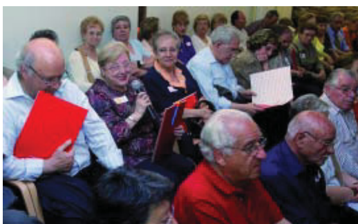
Assistents a una jornada de participació.