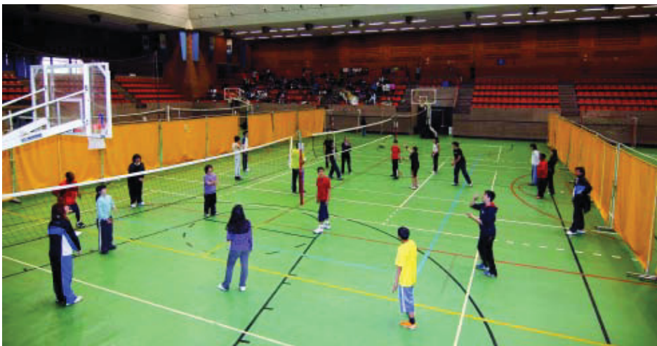
Alumnes d'ESO d'Horta-Guinardó, al poliesportiu de la Vall d'Hebron.