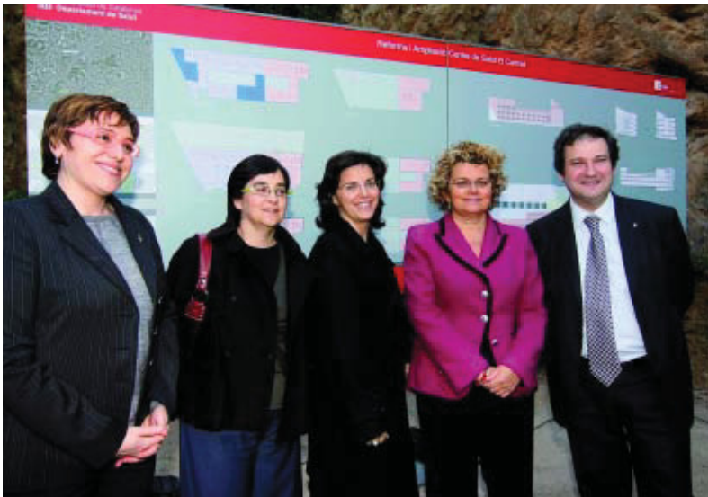
D'esquerra a dreta, la presidenta del Districte, la delegada de Salut pública, la regidora del Districte, la consellera de Salut i l'alcalde de Barcelona, davant del plànol del nou equipament.

El centre d'atenció primària creixerà en més de mil metres quadrats en un solar adjacent cedit pel Districte d'Horta-Guinardó. Les obres acabaran al llarg del 2010