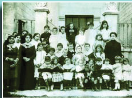
Entrada al centre pel carrer de Feliu el 1914.

Si té fotografies o documents del seu barri, en pot fer donació a l'Arxiu Municipal del Districte, 93 291 67 26