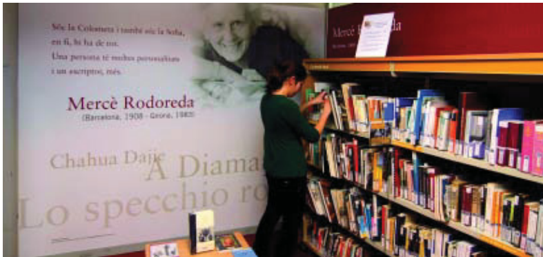
Espai de la col·lecció local de la Biblioteca Guinardó-Mercè Rodoreda.