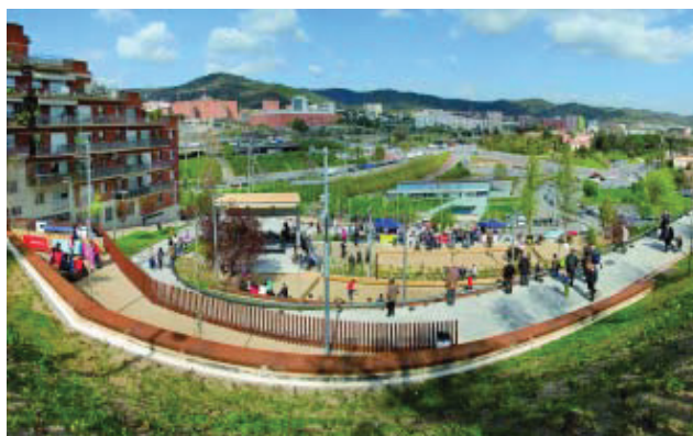
El parc dels Garrofers, el dia de la inauguració.

Els veïns de la Teixonera han recuperat un espai públic, el situat entre els carrers Josep Sanguenís i Coll i Alentorn, el qual, després d'una remodelació, es va inaugurar al final de març amb dues pistes de petanca, una àrea de jocs infantils renovada i amplificada, nou mobiliari urbà i enllumenat, així com nou arbrat i una nova pèrgola que amplia les zones d'ombra. Les característiques de la seva superfície i l'existència d'unes grades permetran utilitzar-la com a escenari d'activitats de Festa Major.