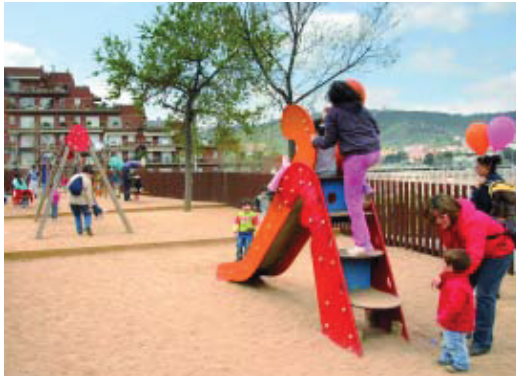
Àrea de jocs infantils al nou parc dels Garrofers.

La Teixonera ha recuperat un espai per a ús ciutadà, amb zones de descans i de jocs. L'espai Cortada ocupa 5.500 metres quadrats situats entre el carrer Josep Sanguenís i el de Coll i Alentorn