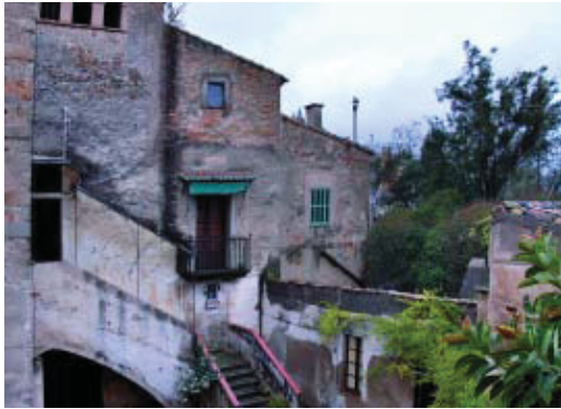
Aspecte actual de la masia de Can Fargues.

Justament el dia anterior, l'Ajuntament havia adquirit la masia –que és inclosa en el Pla Especial de Protecció del Patrimoni Arquitectònic i Catàleg del Districte d'Horta-Guinardó– per un preu just de 5 milions d'euros, segons valoració feta per l'Ajuntament i validat pel Jurat Provincial d'Expropiació. Ha estat la resolució després de