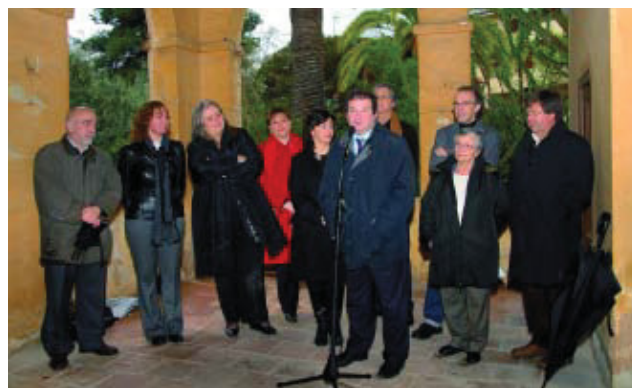
Moment en què es van fer els parlaments el dia de la visita a la masia.

L'Ajuntament de Barcelona va adquirir la masia Can Fargues el passat 2 de febrer. Un dia després, durant la jornada de portes obertes, la finca va ser "presa" per autoritats, representants de la plataforma Salvem Can Fargues, entitats i veïns en general, els quals van entrar-hi per primera vegada per veure com és l'espai que acollirà l'escola municipal de música del districte, la qual tindrà capacitat per a 400 alumnes i 20 professors. La finca, que és inclosa en el Pla Especial de Protecció del Patrimoni Arquitectònic i Catàleg del Districte d'Horta-Guinardó, té una superfície de 4.880 m 2 , dels quals 2.000 corresponen als jardins romàntics, que s'obriran a la gent del barri independentment de l'escola.