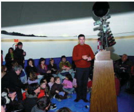
Activitat a l'interior del planetari.

El Planetari municipal de Barcelona, situat a l'Escola del Mar del Guinardó, ha reobert les portes després de modernitzar-ne les instal·lacions