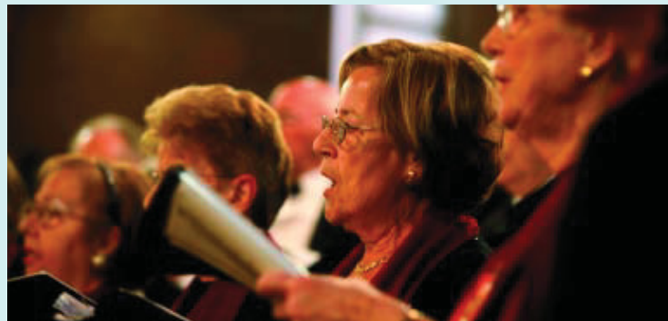
Un concert de la passada edició del cicle Clàssica a Horta-Guinardó.