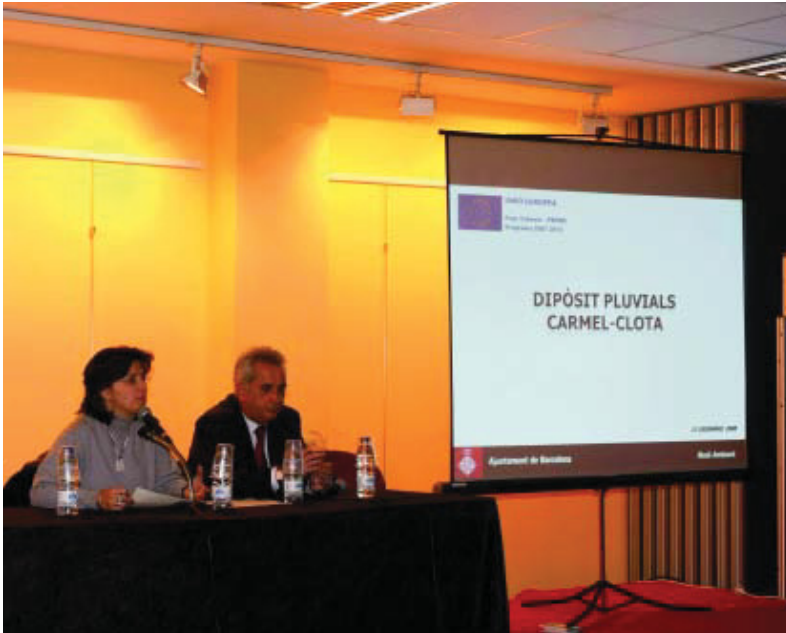
Moment de la reunió informativa al centre cívic Matas i Ramis.

A sota del dipòsit, el qual quedarà enllestit el juliol del 2010, s'hi farà un centre de neteja, i després començaran les obres d'urbanització i del parc de l'avinguda de l'Estatut