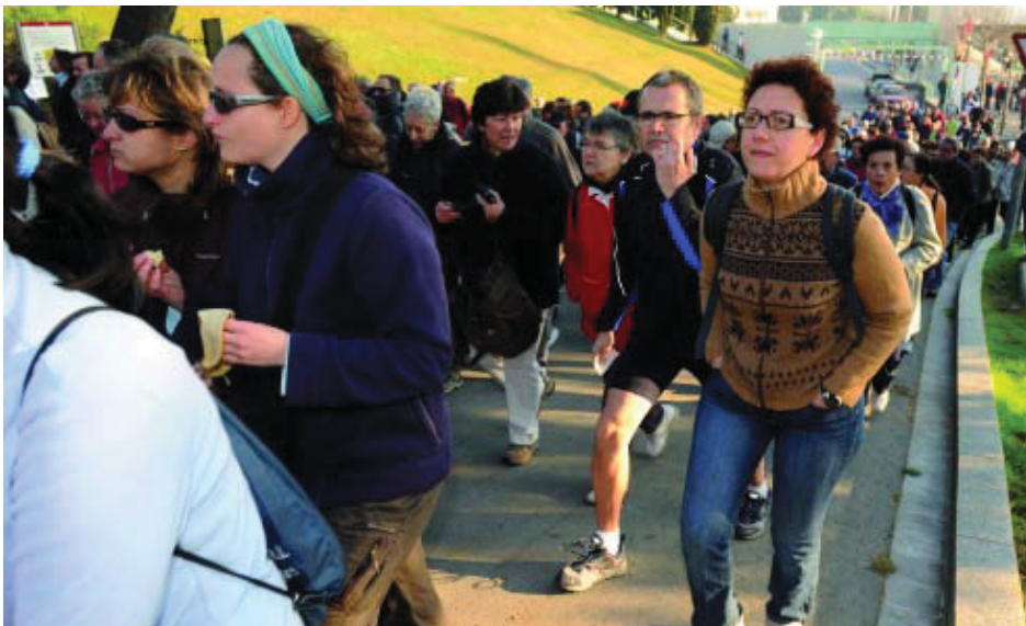
Un moment de l'inici de la caminada del dia 22 de febrer.