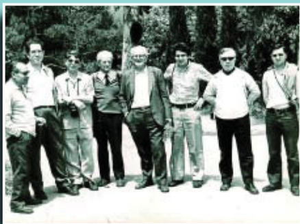
Membres del grup en una sortida fotogràfica l'any 1963.

Si té fotografies o documents del seu barri, en pot fer donació a l'Arxiu Municipal del Districte, 93 291 67 26