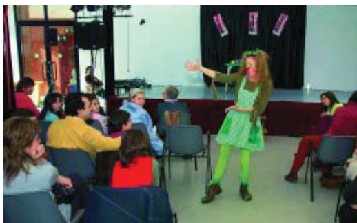
Espectacle infantil al centre cívic Casa Grogà.