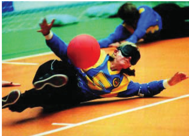
El golbol és un dels esports que formen part del programa.

"Poden jugar dos equips amb dos jugadors cadascun, deixant uns