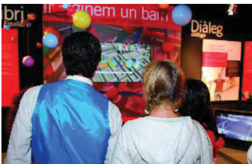
Imatge de l'exposició “El meu carrer, el nostre barri”.