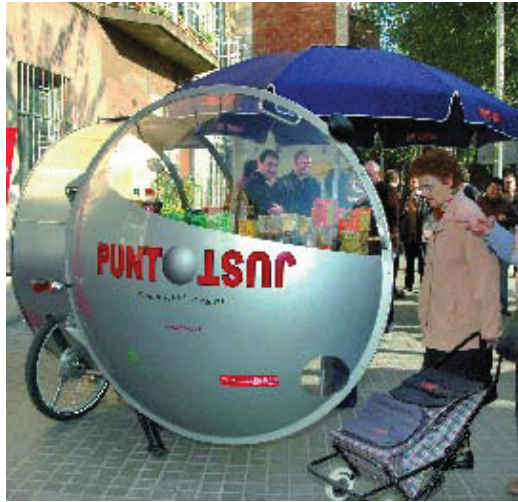
El tricicle de comerç just.