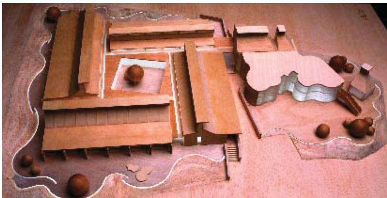
Maqueta de la Casa dels Xuclis.

La residència vol evitar que les famílies afectades s'hagin de desplaçar i millorar així la qualitat de vida de nens i pares