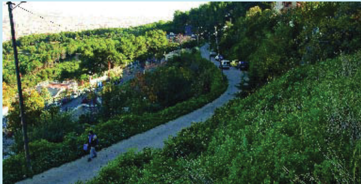
El carrer del Turó de la Rovira és la frontera entre el Carmel i Can Baró.