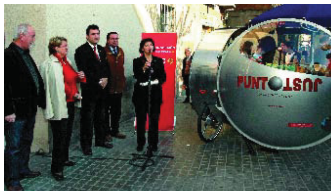
El Punt Just va ser inaugurat el mes de desembre.

Un vehicle instal·lat davant del mercat d'Horta ofereix begudes i productes de comerç just i ecològics. És l'anomenat PuntJust, una iniciativa de la Fundació Futur que neix amb el suport del Districte i de la Fundació Un Sol Món. El vehicle, fet d'alumini i de manera artesana, ha estat dissenyat expressament per a aquesta activitat. És autosuficient des d'un punt de vista energètic –té bateria pròpia– i un motoret, imprescindible en cas de pujada, que s'engega quan es comença a pedalar. La previsió és instal·lar en el transcurs de l'any 2007 quatre vehicles més repartits en diferents indrets del districte d'Horta-Guinardó.