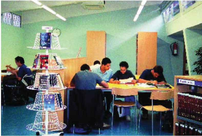
Imatge de la biblioteca de Montbau-Pérez Baró.

El Consell Plenari del Districte d'Horta-Guinardó ha aprovat amb la unanimitat de tots els grups municipals el Pla d'Equipaments 2006-2020, el qual preveu la posada en marxa de 73 nous equipaments