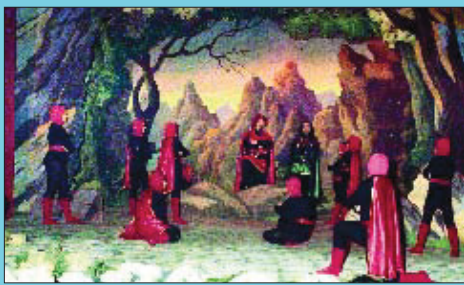
Imatge d'una de les primeres representacions dels Pastorets on el contrapunt del dimoni sempre ha estat la part divertida de l'obra.

Si té fotografies o documents del seu barri, en pot fer donació a l'Arxiu Municipal del Districte. T. 93 291 67 26