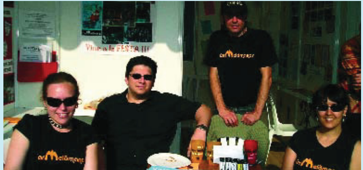
Carmelömanos va nèixer per actualitzar les festes del barri.