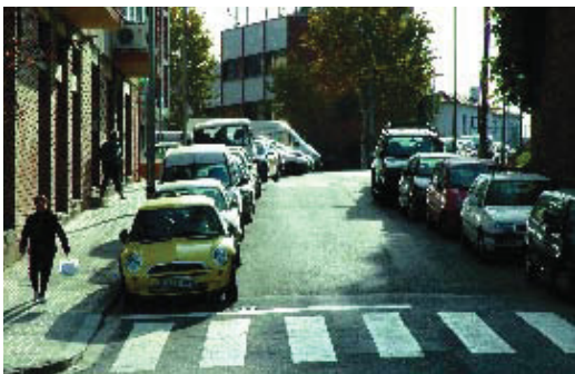
El carrer Natzaret és un dels que s'han pogut reurbanitzar.