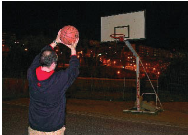
La pista de la Clota és oberta a tothom.

La pista, que compta amb dues porteries de futbol sala i dues cistelles de bàsquet, és gestionada pel Centre Municipal d'Esports Vall d'Hebron i està situada a l'aire lliu-