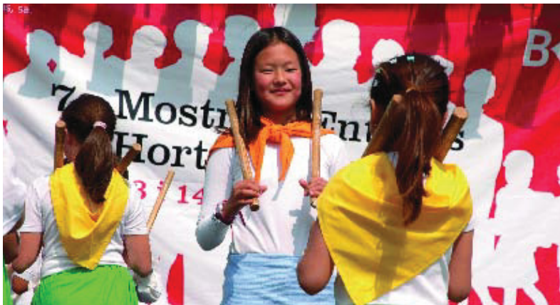
Actuació infantil durant la Mostra.