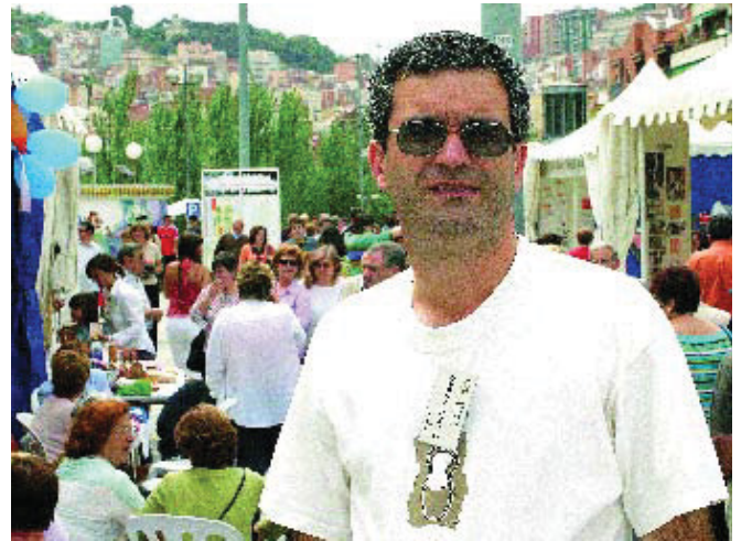
A part de la informàtica, les bitlles catalanes són la seva altra passió.

A la Mostra, hi hem pogut trobar entitats de tot tipus, des de les que potenciaven el comerç just fins a les que t'animaven a ballar danses de l'Amèrica Llatina o d'Àsia. És molt important