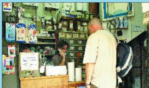
L'establiment va obrir el 1969, com el mercat.