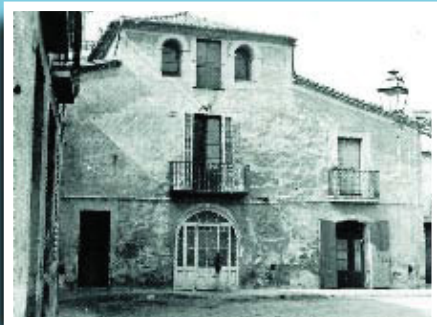
La masia de Can Gras a la plaça de Santes Creus.

Si té fotografies o documents del seu barri, en pot fer donació a l'Arxiu Municipal del Districte, 93 291 67 26