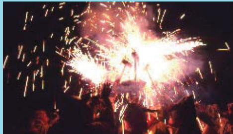
Els focs artificials són millors si els utilitzem amb seguretat.