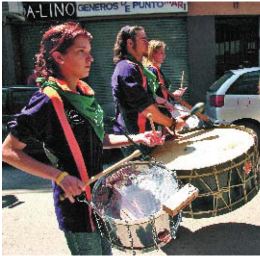
Els tambors són protagonistes de les cercaviles a les festes majors.

Els actes centrals de les festes del Baix Guinardó seran la gran cercavila de dissabte al matí, la sardinada popular de diumenge, els balls amb orquestra, la cantada d'havaneres i els correfocs amb les Fures de Can Baró. El cap de setmana següent, el districte celebrarà de manera simultània les festes de la Font d'en Fargues, Can Baró, Sant Genís dels Agudells i la Vall d'Hebron. A la Vall d'Hebron, s'hi instal·larà un parc infantil als jardins de Can Brassó amb atraccions com la pista americana, la piscina de boles i un tobogan pallaso. Aquest serà l'escenari de la majoria dels actes, com la cantada d'havaneres, la xocolatada infantil, el II Concurs