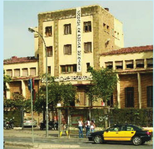
L'IES Joan Brossa guanyarà en alçada per tenir noves sales administratives.

D'altra banda, el Plenari va proposar l'atorgament de les Medalles d'Honor de Barcelona de 2006 al Foment Hortenc per la seva important contribució a la vida social i cultural del districte en el transcurs de gairebé 90 anys –forma part de la Coordinadora d'Entitats d'Horta i organitza cada any muntatges