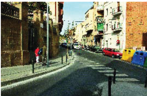
El carrer Josep Serrano.