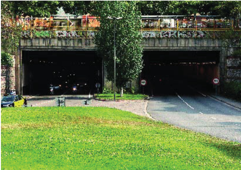
Entrada al túnel per la boca sud.