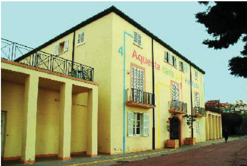
El Centre Cívic Guinardó.

Ja està en marxa el procés participatiu per a l'elaboració del Pla d'equipaments del districte per als anys 2006-2020. Es tracta d'establir, de manera consensuada, quines són les necessitats reals dels barris