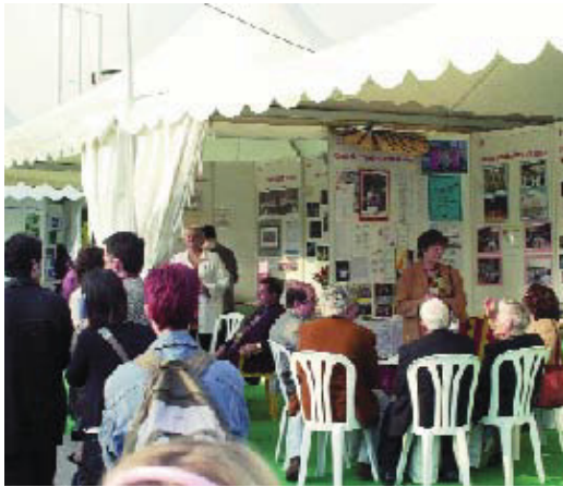
Una imatge de l'anterior Mostra, celebrada el 2004.

El nou emplaçament de la rambla del Carmel, entre el carrer de Dante Alighieri i el Mirador d'Horta, dona cabuda a 10 carpes, una mostra de gastronomia, 3 escenaris i nombrosos tallers. Les més de 215 entitats que hi parti-