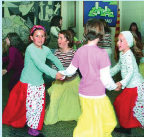
L'entitat té un esbart infantil amb 20 nenes.