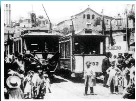
El 21 de juny de 1901, el tramvia d'Horta va canviar de tracció i d'itinerari.

Si té fotografies o documents del seu barri, en pot fer donació a l'Arxiu Municipal del Districte, 93 291 67 26