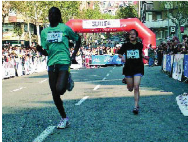
La competició escolar va reunir a 3.000 participants d'unes 30 escoles.

Però no només aquí es va batre un rècord. El nombre de col·legis que s'hi van apuntar varen superar la trentena. Així, els carrers del Guinardó eren trepitjats per