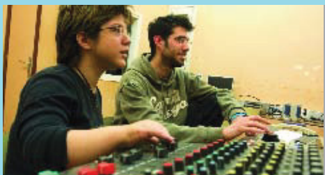
El servei ofereix orientació laboral als joves.