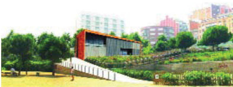
El nou casal s'enllestirà cap a l'abril de 2007.

els jardins que l'envolten, un entorn verd franquejat per altres equipaments i serveis públics. A la banda del carrer de Lepant hi ha l'edifici que acull el vell casal, la comissaria dels Mossos d'Esquadra i dependències del Districte d'Horta-Guinardó. A la banda del carrer de la Marina, el nou local tindrà