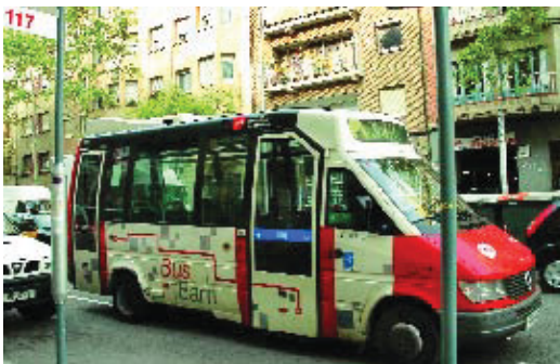
La línia 117 (Font d'en Fargas-Guinardó).