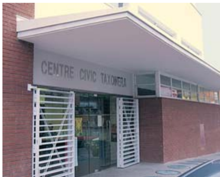
L'edifici del centre cívic, al carrer Arenys, núm. 75.

Des de 1995, el barri de La Taxonera té al seu servei aquest equipament, que compta amb un centre de serveis socials, un centre infantil, un servei d'accés públic a Internet i una sala de lectura