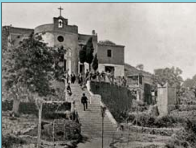
Abans L'ermita del Carmel al final de segle XIX.

Si té fotografies o documents del seu barri, en pot fer donació a l'Arxiu Municipal del Districte, 93 285 03 57