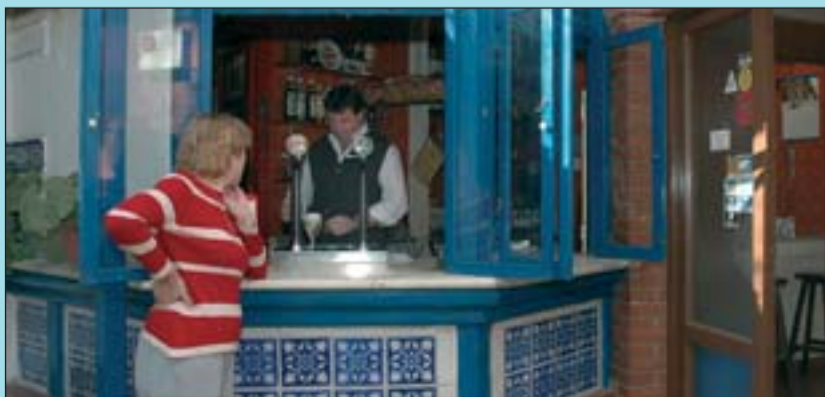
El restaurant està situat on hi ha una font modernista del segle XIX.