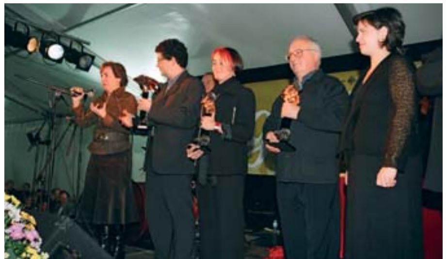
Un moment del lliurament de premis de l'any passat.