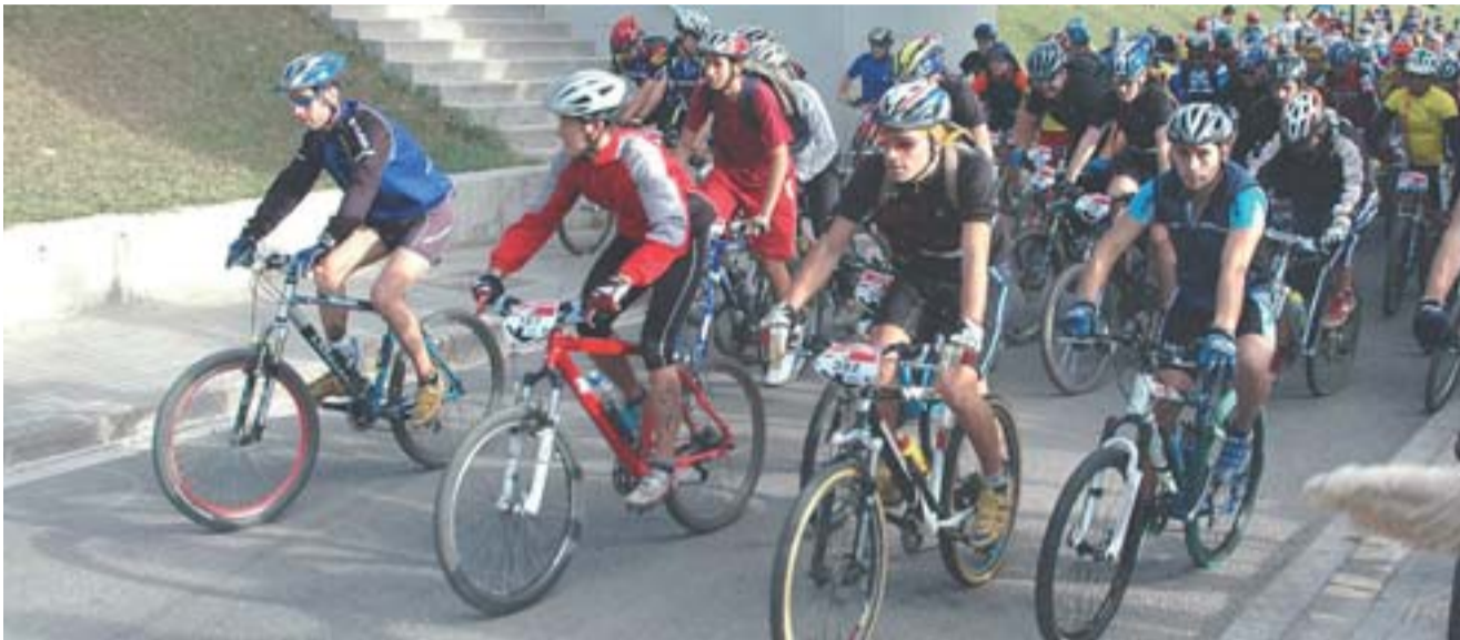
El Velòdrom d'Horta va ser el punt de sortida i arribada d'aquesta prova.