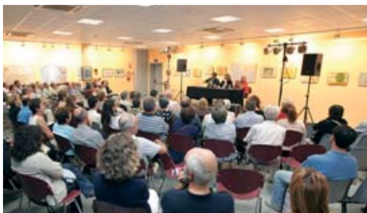
Debat "Encants i Desencants" al Centre Cívic Matas i Ramis.

Horta continua celebrant el centenari de l'annexió a Barcelona. La novetat principal d'aquest mes de novembre és la presentació d'una carpeta commemorativa que recull reproduccions de documents històrics seleccionats per l'Arxiu de Districte d'Horta-Guinardó: l'acta d'agregació, una selecció de fotografies, plànols i altres documents antics. Tots els as-