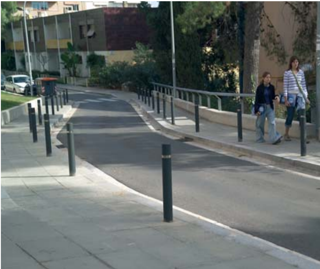
El carrer de Benlliure uneix els de la Poesia i de l'Arquitectura.

Voreres més amples i contínues, zona d'aparcament regulada i nou mobiliari urbà són els canvis més evidents que ha portat la remodelació d'aquest carrer, al barri de Montbau