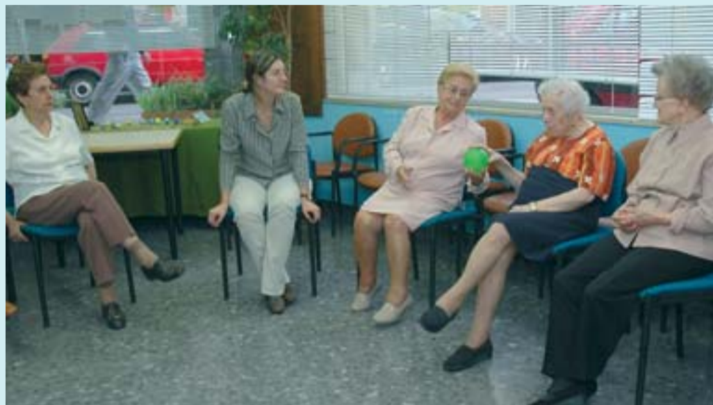
L'Associació Nou Horitzó ofereix tallers a persones grans amb discapacitats o sense.