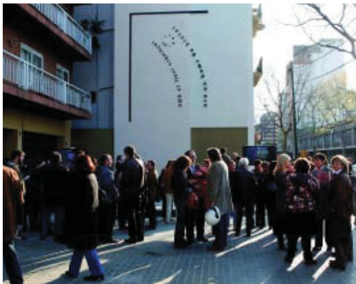
Ambient que hi havia el dia de la inauguració de la mitgera.

Una paret mitgera és una paret divisòria entre edificis que queda al descobert com a conseqüència dels canvis urbanístics. La situada a travessera de les Corts, 72, té des del passat mes de març una nova fesomia. Se la coneix ja com la "Mitgera Futbol". I no només perquè estigui situada davant del Camp Nou, sinó perquè s'ha volgut anar més enllà de la simple reparació per incorporar-hi el cal·ligrama esportiu "Futbol", escrit pel periodista i escriptor Carles Sindreu (1900-1974), pioner en la incorporació del cal·ligrama i del gènere poètic en les publicacions esportives. Els cal·ligrames són