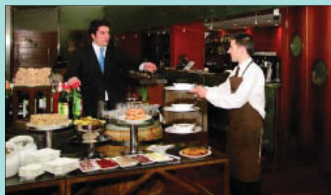
El restaurant és ideal per a celebracions.