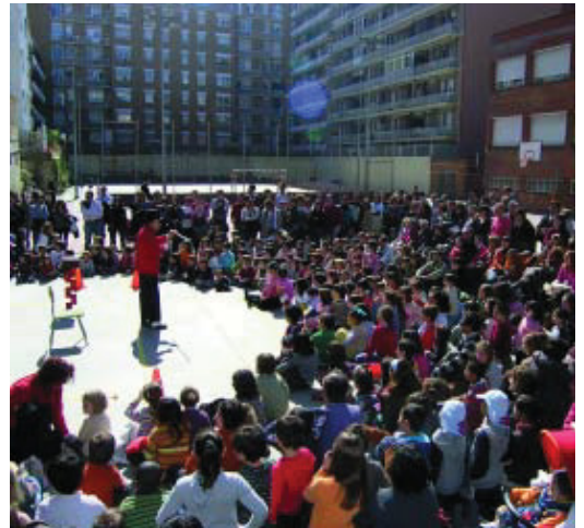
Exhibició del taller de màgia al CEIP Barcelona.

De moment, només s'ha obert el pati del CEIP Les Corts, que funciona dissabtes i diumenges de 10.30 a 13.30 h i en algunes ocasions en períodes de vacances, com ara la Setmana Santa. Els infants poden fer servir les seves instal·lacions del pati per jugar o fer esports de forma totalment lliure, amb