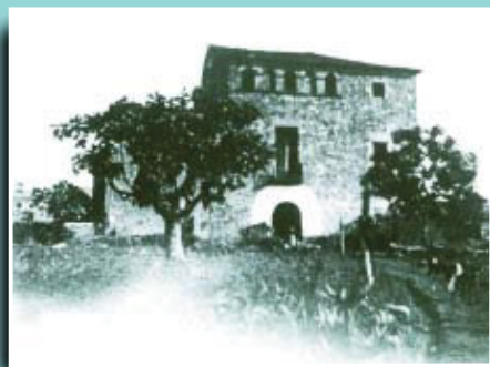
Imatge de la masia de Can Novell.

Si té fotografies o documents del seu barri, en pot fer donació a l'Arxiu Municipal del Districte, 93 221 94 44