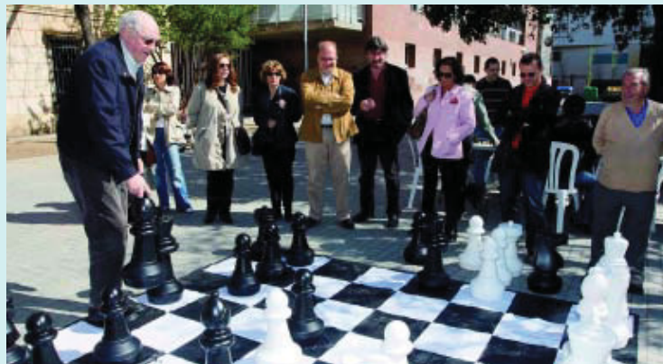
Els escacs gegants, el dia de la seva estrena.