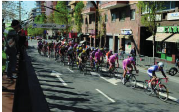
Els corredors van fer voltes per l'avinguda Gran Via Carles III.