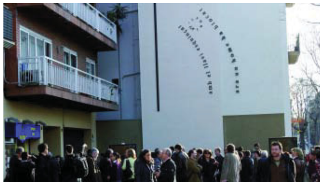
La nova paret mitgera de la travessera de les Corts, el dia de la inauguració.

La paret mitgera de travessera de les Corts, 72, presumeix des de fa setmanes d'un aspecte renovat. Molt propera al Camp Nou, s'ha escollit un cal·ligrama del periodista i escriptor Carles Sindreu, inspirat en un partit de l'any 1928 entre el FC Barcelona i la Real Sociedad, per complementar la reparació arquitectònica de la paret, tot enriquint visualment un espai urbà. La inauguració oficial de l'obra, el passat 22 de març, va comptar amb la presència de nombroses personalitats polítiques i institucionals, com també d'alguns familiars del desaparegut Sindreu.