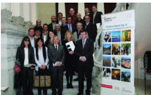
El quart tinent d'alcalde, a la dreta, amb els premiats.