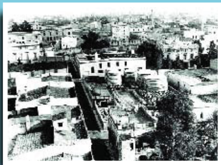
Vista general, l'any 1920, de la indústria de vins i anissos dels Deu, on sobresurten les grans tines per emmagatzemar-los.

Si té fotografies o documents del seu barri, en pot fer donació a l'Arxiu Municipal del Districte, 93 291 64 32