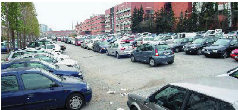
L'aparcament es construirà al carrer Menéndez y Pelayo.

La construcció d'aquest nou aparcament municipal i la subestació elèctrica subterrànica formen part del Pla especial d'ordenació del subsòl del carrer de Menéndez y Pelayo, aprovat pel Consell del Districte el passat mes de novembre. El nou aparcament també és una de les actuacions previstes per l'Ajuntament dins del seu pla d'aparcaments municipals, que està permetent la construcció de 31 nous aparcaments públics a tota la ciutat.