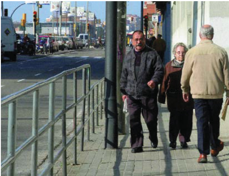
Les voreres de la carretera de Collblanc seran ampliades i tindran més de 4 metres.

L'objectiu és igualar les voreres a les de la carretera de Sants. Se suprimirà la mitjana, però es mantindran els 4 carrils de circulació. Les obres es faran entre aquest any i el 2007