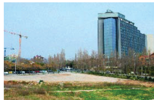
El solar es troba al costat de l'Hotel Rey Juan Carlos.