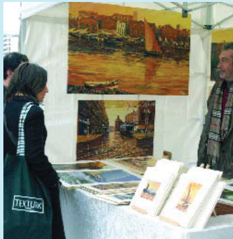
Un estand de la fira.

E ls Jardins Clara Campoamor s'omplen de pintures i de pintors cada segon dissabte de mes i durant tot el dia (a partir de les 11 h. hores). Aquest espai situat a tocar de la Diagonal i de la plaça Reina Maria Cristina, que rep el nom de qui va defensar el dret de vot per a les dones al principi del segle XX, acull aquesta trobada mensual d'artistes d'estils tan diversos com la tècnica mixta, l'oli, l'aquarel·la, l'acrílic... Els onze membres que planten el cavallet i es posen a pintar sota una carpa provenen de diferents indrets de Catalunya i formen l'Associació Art Directe, nascuda l'any 1999 amb el propòsit d'acostar l'art a la ciutadania. "Ens agrada explicar la nostra obra al públic. Explicarem les tècniques que fem servir, responem tota mena de preguntes... Són molts els barcelonins a qui els agrada la pintura, però