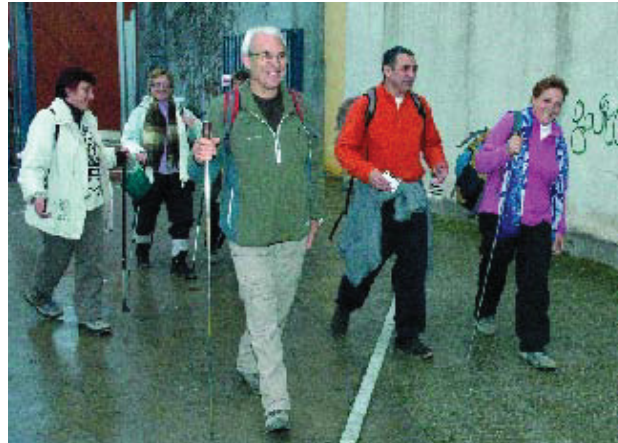
Participants de la Barnatresc.