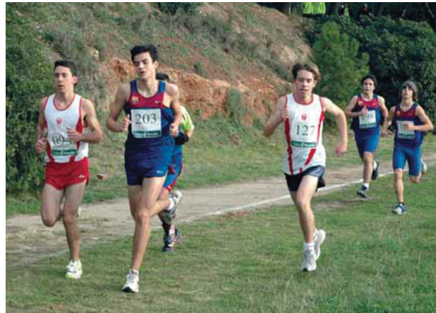
Hi participen atletes de 6 a 16 anys.

cop sumats els seus resultats en les tres proves, serà el vencedor de la Challenge.