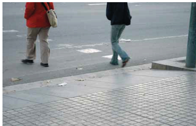
Els guals son un dels elements que es milloren.

Entre els mesos de desembre del 2005 i març del 2006 es duen a terme les obres de millora de la il·luminació pública dels voltants de l'estadi del Camp Nou, així com també la millora de la seva accessibilitat per a persones amb mobilitat reduïda mitjançant la construcció de guals. Les obres permetran la renovació integral de tota la xarxa d'il·luminació pública d'aquests espais, incloent-hi totes les canalitzacions i les unitats de fanals. Aquesta actuació forma part del Pla de millora integral dels carrers de la ciutat, el qual fou aprovat l'any 2004. Gràcies a aquest Pla, entre el 2005 i el 2007 s'hauran dut a terme actuacions de millora integral de l'espai públic en tots els barris de Barcelona.