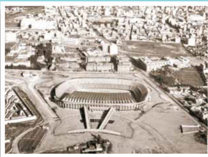
Estadi del Futbol Club Barcelona al començament de l'any 1961.

Si té fotografies o documents del seu barri, en pot fer donació a l'Arxiu Municipal del Districte, 93 291 64 32