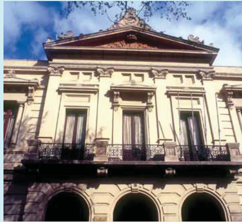
Les sessions es celebren cada dos mesos a la seu del districte.

Durant la celebració del Consell Plenari, el passat 15 de desembre, es va informar àmpliament sobre els pressupostos de 2006 del territori