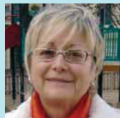
Maria Tort Administrativa

Els avis poden donar als nens molt afecte i amor, i això no es dona a les escoles. És molt necessari avui en dia. Els avis són els que poden estar més estona amb els infants, els va bé a tots dos.