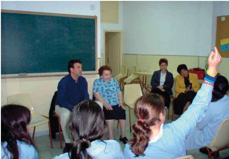
Els casals i les escoles s'apropen per fer activitats conjuntes.

El Districte ha posat en marxa un projecte intergeneracional que té com a objectiu que les persones grans i els infants de les Corts es coneguin més enllà d'una relació de cuidadors