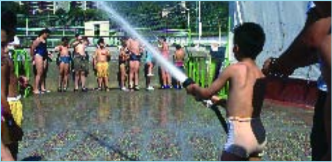
Les activitats van adreçades a infants i joves fins a 17 anys.