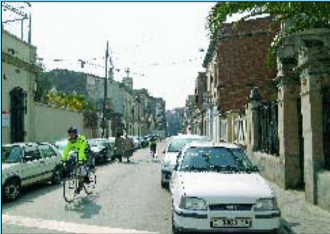
Ara Les edificacions han canviat poc i els cotxes han ocupat bona part de l'espai.