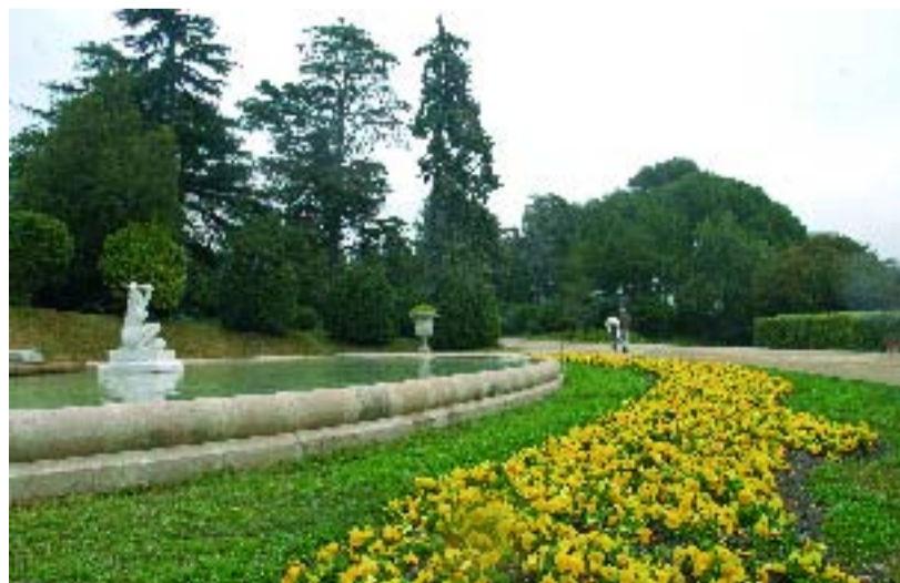
A Pedralbes es renovarà l'enjardinament.

Entre les actuacions que ha programat l'Ajuntament a uns 37 parcs i jardins de tota la ciutat, hi figuren els Jardins del Palau de Pedralbes, on es farà una actuació de regeneració total del verd, la substitució d'exemplars morts, el replantament d'arbres i treballs de poda. L'Ajuntament ha programat també treballs de millora a dos jardins més de les Corts: el Roserar de Cervantes, on es renovarà el paviment i l'enllumenat, i els Jardins de la Font dels Ocellets, on es renovarà el clavegueram i els embornals.