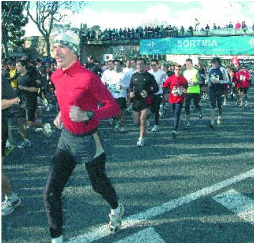
Uns 2.000 atletes van córrer per Barcelona el 6 de març.

El temps també va fer costat a l'organització i als participants, i