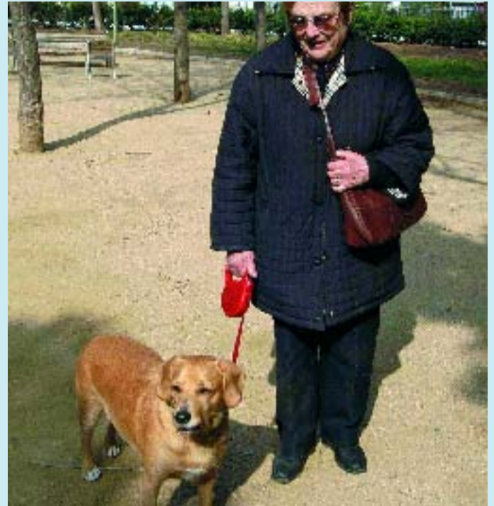
Els gossos necessiten els seus espais per no envair els de les persones.

Amb l'objectiu d'educar simultàniament els amos de mascotes i les persones que no tenen cap animal a casa, s'ha elaborat un programa d'activitats en coordinació amb el Districte. De l'abril al juny es realitzarà un taller de continguts bàsics sobre tractament de gossos i es faran un seguit de conferències als centres cívics de Can Déu i Joan Oliver. L'Associació de Mascotes de les Corts també donarà a conèixer la seva activitat en la Mostra d'Enti-