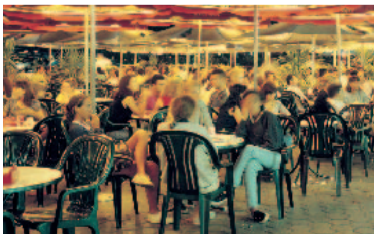
Una vintena de joves emetrà un informe sobre opcions per a la nit.

Una vintena de joves d'entre 15 i 29 anys escollits aleatòriament han participat en el primer Jurat de Joves del districte per opinar sobre com millorar la nit a la ciutat. En dues jornades, el 17 i 18 de març, els joves també van escoltar diversos conferencians que van tractar temes com els models d'oci nocturn d'altres ciutats, l'ús dels espais públics, les normatives vigents (horaris,