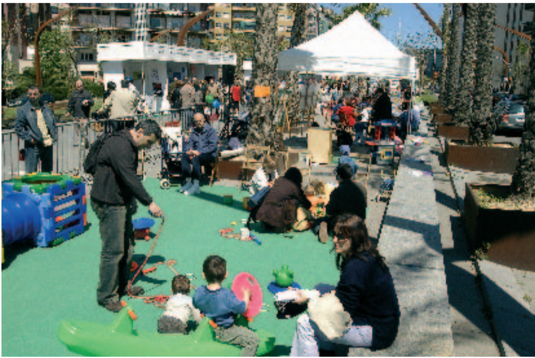
La Mostra d'Entitats es fa a la nova Rambla sorgida de la cobertura de la Ronda del Mig.