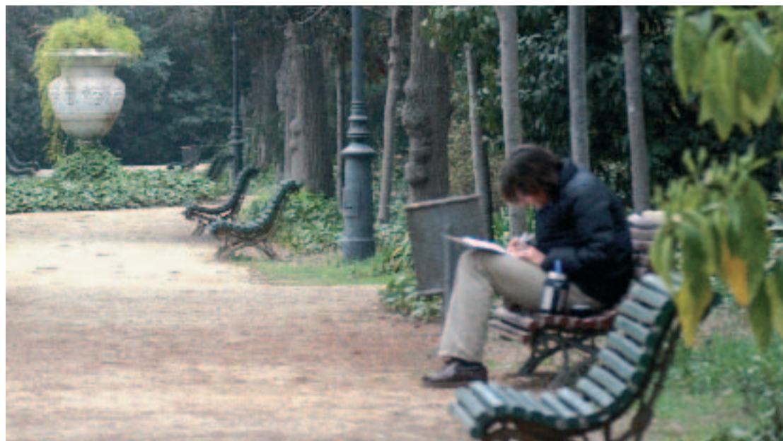
Als jardins de Pedralbes, d'ús públic, es farà una millora integral.

A més d'aquestes actuacions de rehabilitació total, hi ha diferents espais definits en el Pla de Manteniment Integral, gestionat pel Sector de Serveis Urbans i Medi Ambient de l'Ajuntament de Barcelona, on es preveu dur a terme des d'ara i fins al final del 2006 obres de manteniment i reforma de les infraestructures de 25 parcs. Aquestes obres consistiran principalment en la millora del paviment i la renovació de l'enllumenat i el clavegueram. En el cas del districte de les Corts, dins d'aquest Pla hi ha inclosos el Roserar de Cervantes i els Jardins de la Font dels Ocellets. Al primer, s'hi renovarà el paviment asfàltic i l'enllumenat, mentre que al segon s'hi realitzaran obres de millora en el clavegueram i en els embornals.