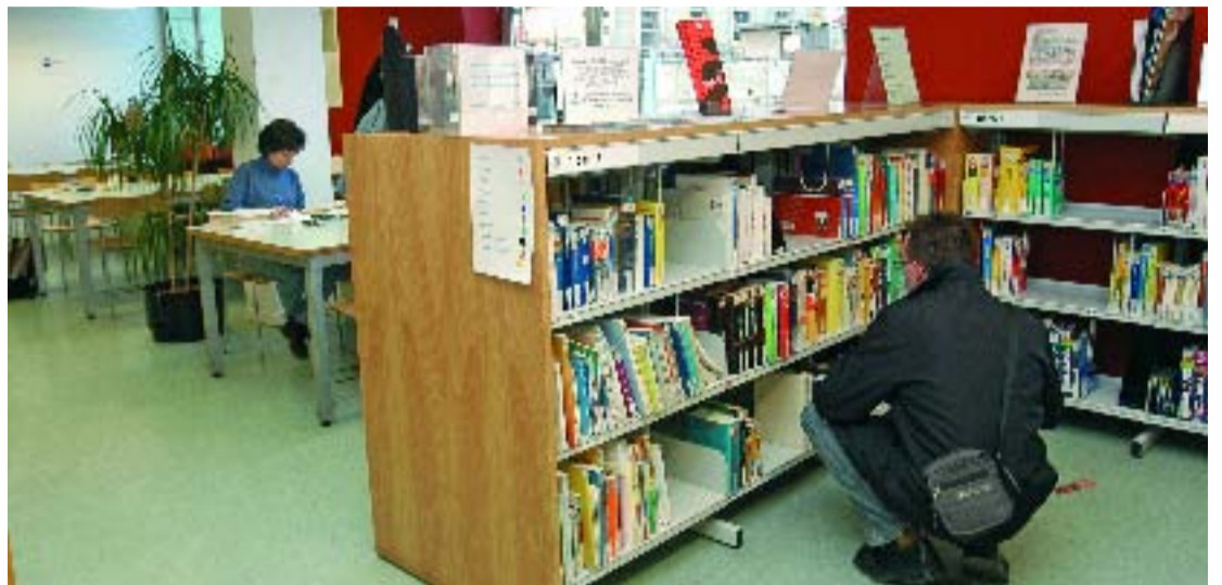
La biblioteca, ubicada al centre Riera Blanca, és un equipament de referència al Racó de les Cortes.