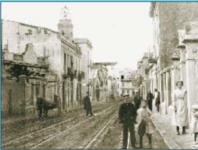
Abans Aspecte que ofería el carrer Anglesola, entre Doctor Ibáñez i Numància, l'any 1910.

Si té fotografies o documents del seu barri, en pot fer donació a l'Arxiu Municipal del Districte, 93 291 64 32