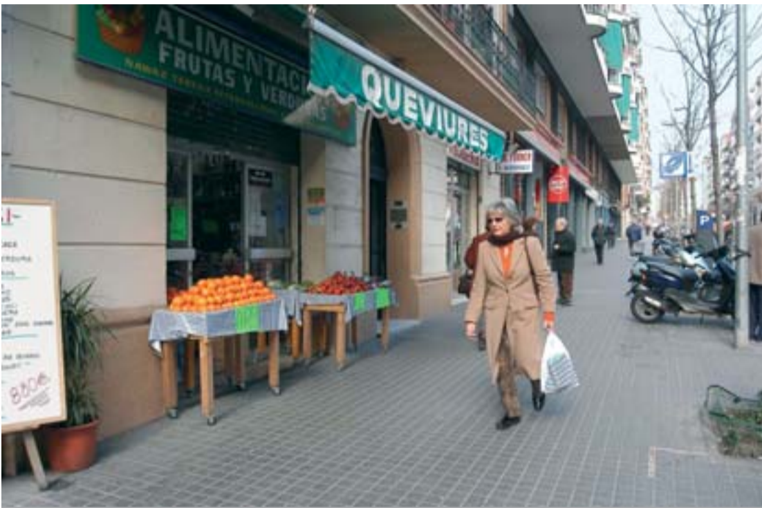
Comerços al carrer Joan Güell.