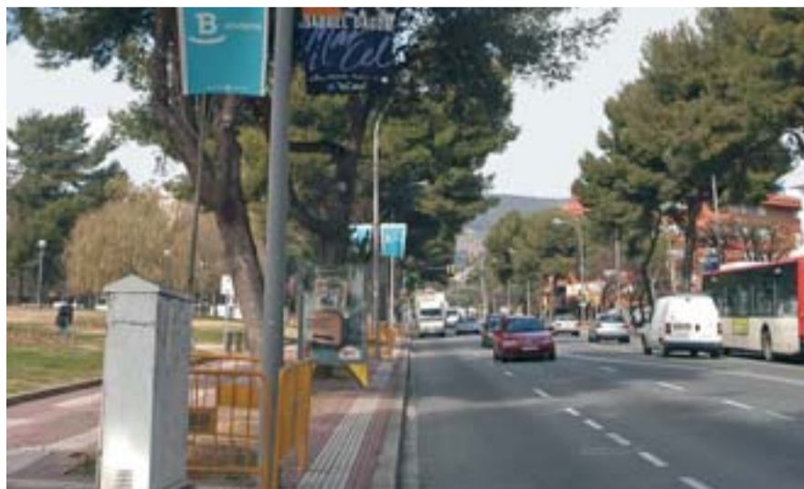
Les voreres són un dels elements que es renoven.

Les voreres, l'enllumenat, el paviment, la senyalització vertical i horitzontal, les papereres, els arbres i tots els elements de mobiliari urbà de l'avinguda de Pedralbes estan sent renovats dins el Pla de Millora Integral de l'Espai Públic que ha posat en marxa l'Ajuntament de Barcelona en diferents barris de la ciutat. El Pla de Millora Integral de l'Espai Públic és un nou concepte de gestió i millora de l'espai públic que té l'objectiu de reduir sensiblement les molèsties que les obres originen als veïns i veïnes. De fet, es tracta d'avaluar les necessitats de millora d'un determinat espai públic i programar totes les obres necessàries en una sola actuació, la qual cosa permet una millora integral d'aquell espai.