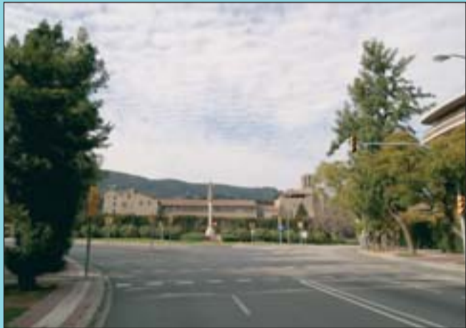
Ara La construcció d'edificis, l'enjardinament i el pas de vehicles han canviat l'espai.