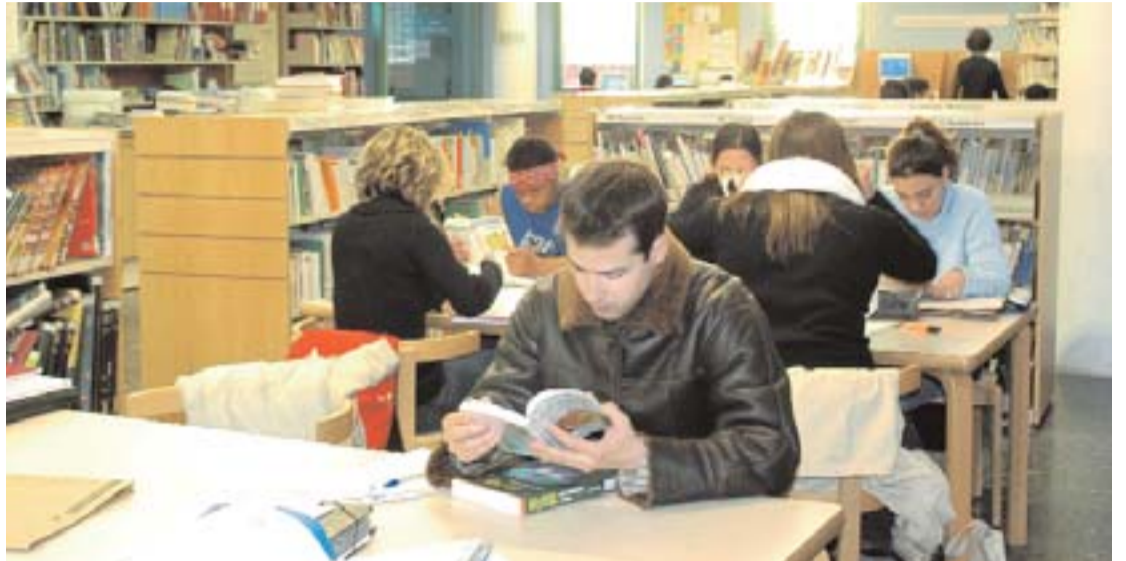
Des de fa 11 anys aquesta biblioteca té la seu a un mas rehabilitat a prop de L'Illa.

Oberta el 1994 a un mas del segle XVIII, el centre té fons especials sobre criança dels fills, salut i novel·la en llengües estrangeres