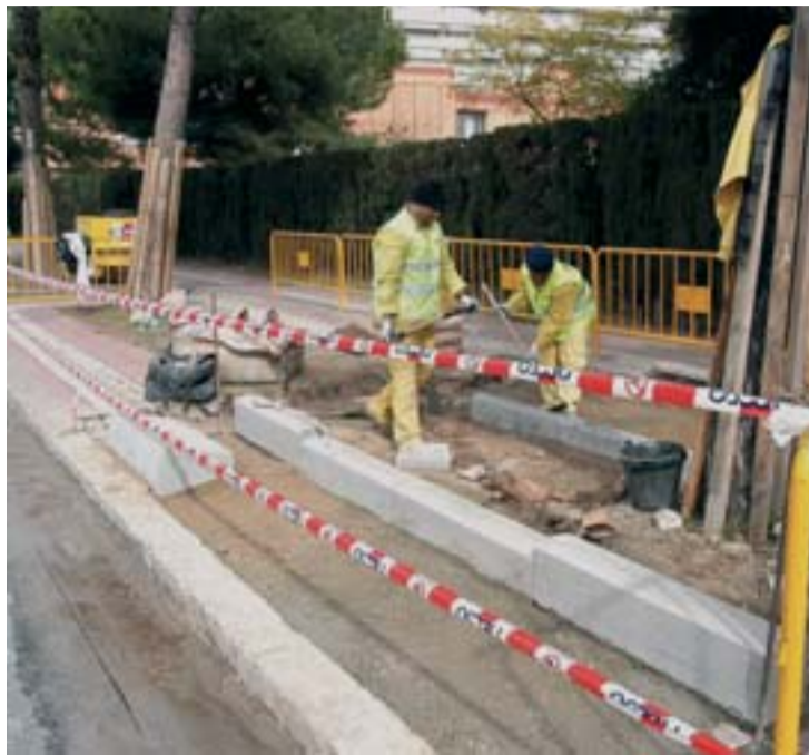
Els treballs inclouen la renovació de voreres.

Ja han començat les obres de millora de l'avinguda de Pedralbes dins del Pla de Millora Integral de l'Espai Públic a la ciutat de Barcelona 2004-2007. Les diferents actuacions s'han programat en funció de les necessitats que s'hi han detectat. Entre les obres programades es troba la renovació de l'enllumenat, tant dels suports de les lluminàries com dels quadres de llum, per tal d'incrementar la il·luminació de l'avinguda. També es refaran les voreres, que respectaran els criteris d'accessibilitat, i es col·locarà un nou paviment. La senyalització vertical que es trobi en mal estat serà substituïda