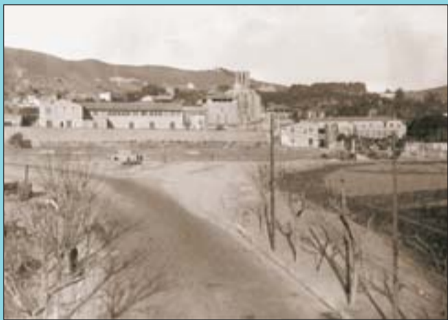
Abans Obres d'urbanització de l'entorn del monestir on encara no hi és la creu de terme.

Si té fotografies o documents del seu barri, en pot fer donació a l'Arxiu Municipal del Districte, 93 291 64 32