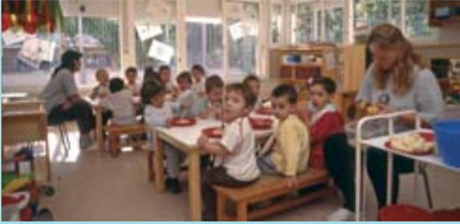
Escola Bressol Bambi, situada al Jardí de les Infantes, s/n.