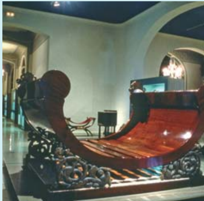
El museu està a Pedralbes des de 1932.

L'agrupació dels Museus de les Arts de l'Objecte, Museu de les Arts Decoratives, Museu Tèxtil i d'Indumentària i Museu de les Arts Gràfiques, es troben sota una única gerència que respon a la reorganització museística que l'Ajuntament de Barcelona fa amb l'objectiu d'optimitzar els recursos i donar rellevància als objectes quotidians i domèstics que representen l'essència dels tres museus. Les col·leccions s'integraran, en un futur, en el nou Museu de Disseny, Arquitectura i Moda. Es mantindrà el criteri d'unitat de col·leccions i es fomentarà la creació de lectures i projectes de caràcter transversal i interdisciplinari. La plaça de les Glòries, situada al cor que formen l'Auditori i el Teatre Nacional de Catalunya, seria el lloc per a l'edificació del nou Museu del Disseny. Aquest nou equipament cultural de