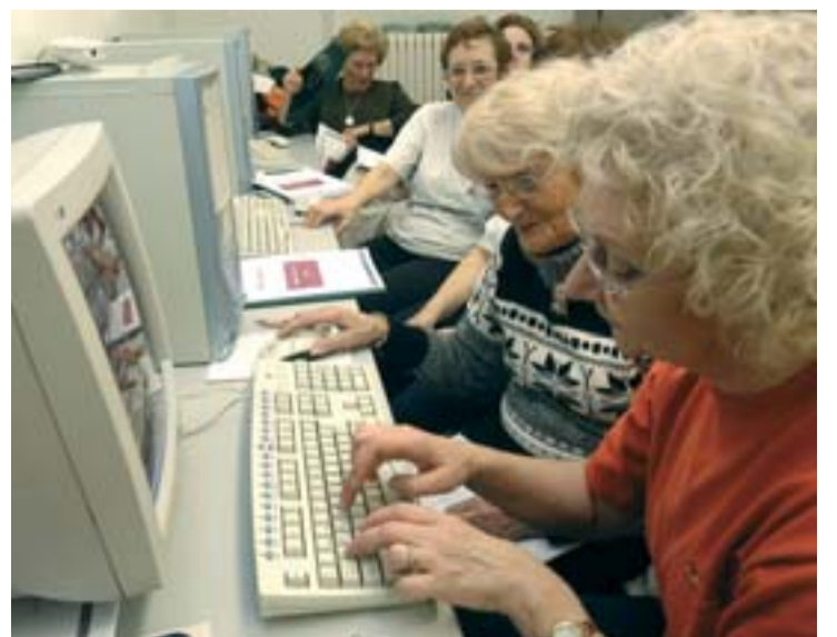
Les classes es fan cada dimecres de 19 a 21 h.

Per altra banda, per tal de donar-se a conèixer i difondre les diverses activitats que organitza, el PIAD (Punt d'Informació i Atenció a les Dones) ha elaborat uns espais que s'emeten regularment a través de COM Ràdio (91 FM) a partir d'aquest mes de març.