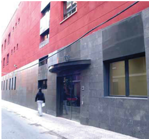
Aquesta serà l'entrada al futur casal de gent gran.

El nou espai, al qual es tindrà accés des del carrer de Caballero, núm. 29, tindrà una superfície d'uns 250 m 2 . De les seves instal·lacions destacaran dues sales polivalents que podran ser utilitzades com a aules-taller per fer-hi activitats. Segons Teresa Garrete, l'arquitecta responsable del projecte del despatx barceloní d'arquitectura Altrim, que s'ha fet càrrec de la construcció de l'edifici, "un dels aspectes singulars del nou equipament serà que tant els usuaris de la residència privada com els del casal municipal tindran accés a un jardí interior que es convertirà en