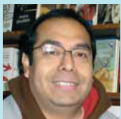
Luis E. Asensio Llibreria

Cualquier comunicación directa de los vecinos con las autoridades siempre será lo más adecuado y apropiado para intentar mejorar la calidad de vida de los barrios.