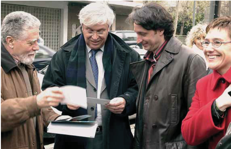
Un veí ensenya fotos a l'alcalde, Joan Clos, i al tinent d'alcalde Jordi Portabella. A la dreta de la imatge, la regidora de les Corts, Mònica Ballarín.

Del 10 al 12 de gener, l'alcalde, Joan Clos, ha traslladat la seva activitat al despatx de la Casa de la Ciutat, la històrica seu municipal de les Corts, a la plaça de Comas