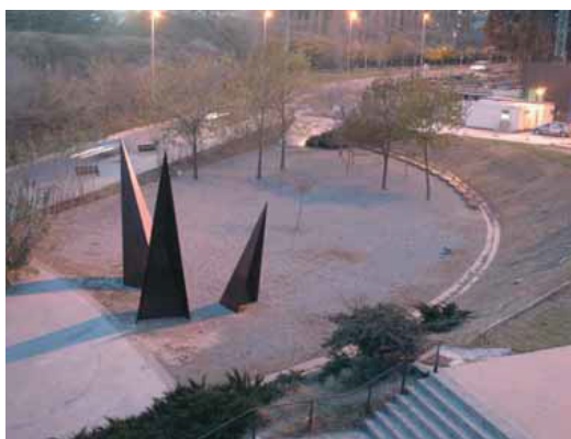
Aquest és l'espai que s'enjardinarà.