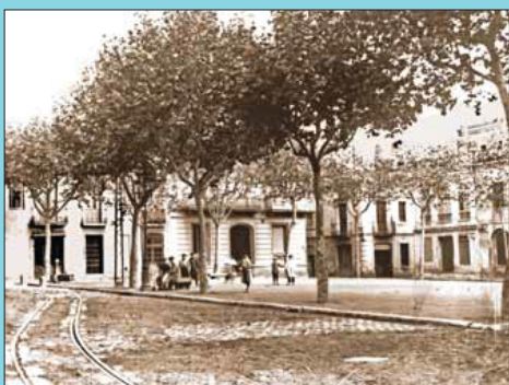
Abans Aspecte que ofería la plaça el 1910, en què destaca la via del tramvia.

Si té fotografies o documents del seu barri, en pot fer donació a l'Arxiu Municipal del Districte, 93 291 64 32