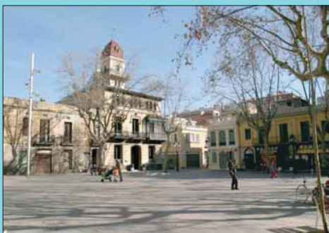
Ara Amb la integració dels carrers del voltant la plaça ha guanyat en superfície.