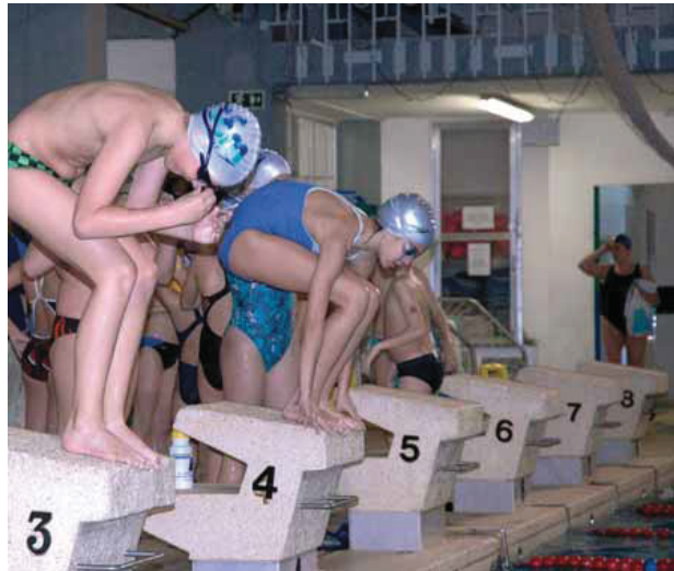
El centre del carrer Regent Mendieta té 3000 m².