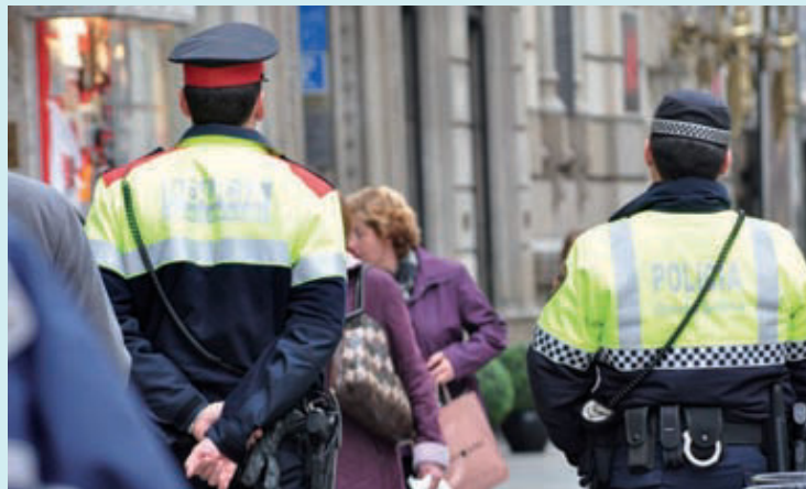
Un mossos d'esquadra i un guàrdia urbà, en una patrulla mixta.