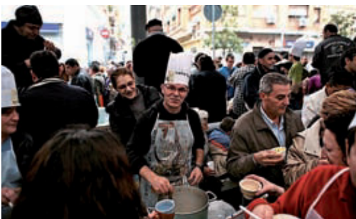
Festival de Sopes del Món Mundial del 2010.