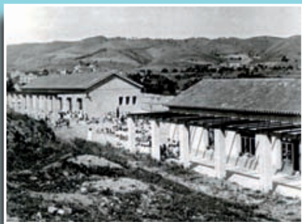
Imatge del grup escolar Giner de los Ríos, al turó de la Peira el 1932. (Foto: facilitada per Dora Serra).

Si té fotografies o documents del seu barri, en pot fer donació a l'Arxiu Municipal del Districte, 93 291 68 36