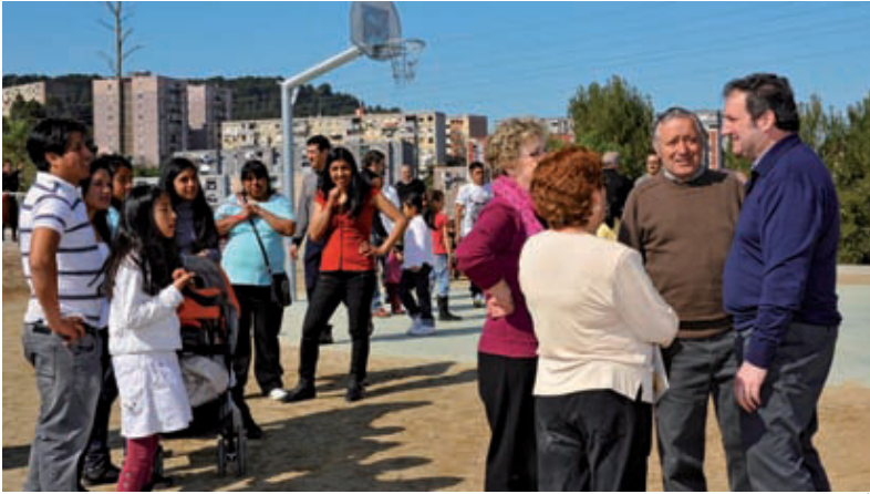
L'alcalde, Jordi Hereu, parla amb uns veïns al Campillo de la Virgen.