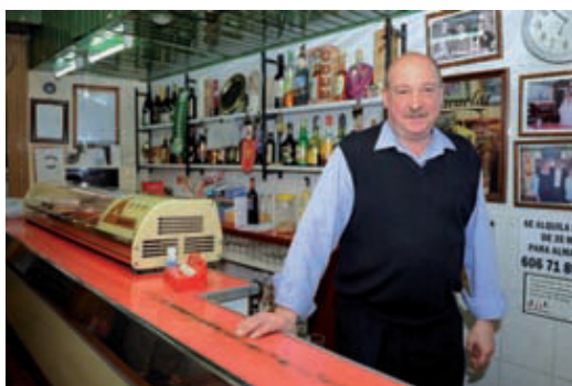
El bar Navarro va obrir el 1947.