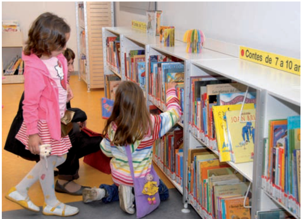
Biblioteca de Roquetes.