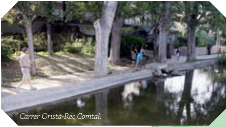
Carrer Oristà-Rec Comtal.