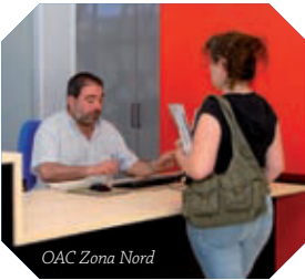
OAC Zona Nord