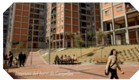
Interiors del barri de Canyelles