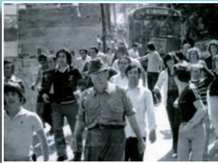
Imatge de l'autobús segrestat en mig d'una gran quantitat de veïns.

Si té fotografies o documents del seu barri, en pot fer donació a l'Arxiu Municipal del Districte, 93 291 68 36