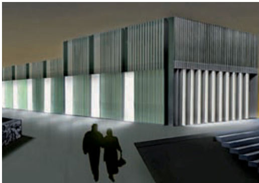
Imatge virtual del futur Ateneu Popular.

Més espai, condicions de feina més bones per als alumnes i usuaris, i una estètica molt cuidada que el convertirà en un dels edificis més singulars del districte. Són els eixos vertebrals de les obres de condicionament de l'Ateneu Popular de Nou Barris, un ambiciós projecte a càrrec de l'estudi d'arquitectes Fornari + Rojas, que requerirà gairebé dos anys d'obres i una inversió de 2,6 milions d'euros, necessaris per adequar l'equipament a les necessitats dels usuaris, sense perdre, però, ni una engruna del seu esperit. L'Ateneu, que en el transcurs de més de tres dècades d'història s'ha convertit en un espai de circ de referència, exerceix un