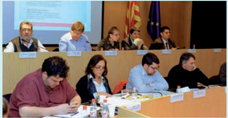
Un moment del darrer Ple de l'any 2010.