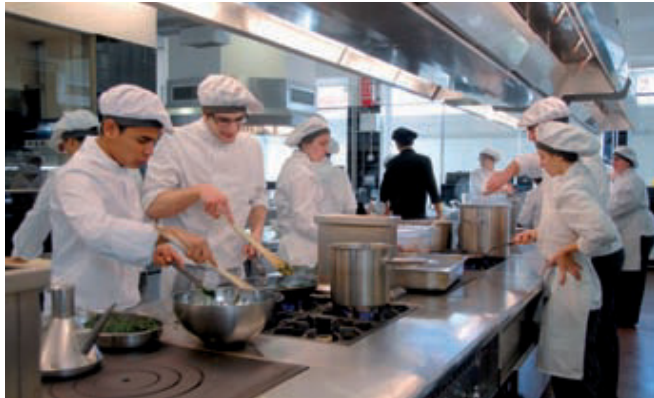
Alumnes de l'escola, a la cuina del centre.