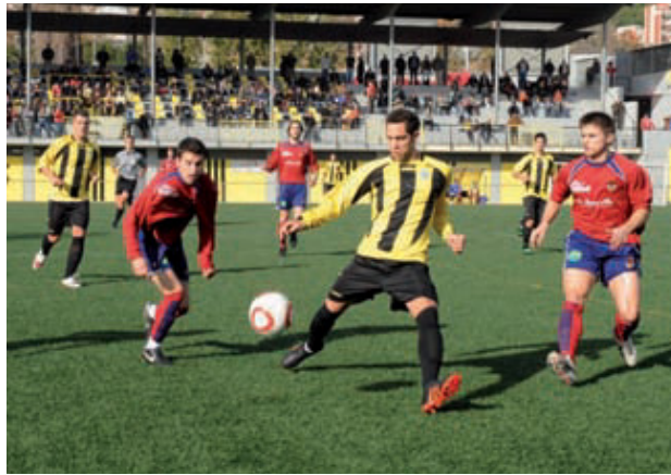
Partit de la Montañesa al seu camp.