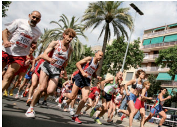
Atletes a l'última Cursa Popular, que es fa dins de la Festa Major del districte.

A les 10.30 h, començaran les curses de Promoció i Adaptada, que tenen