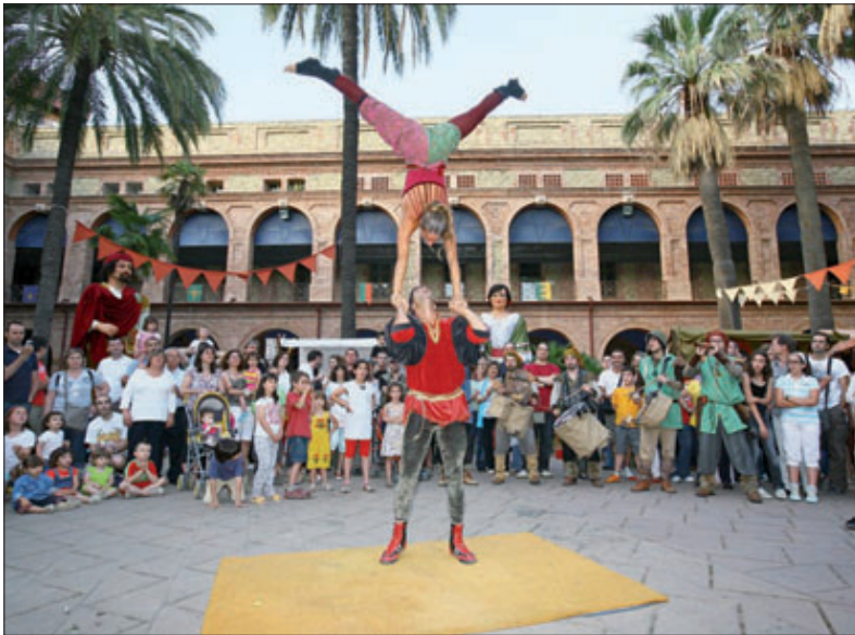
Actuació d'equilibristes a la plaça Major de Nou Barris durant una edició passada de la festa.

El districte més jove de Barcelona ha sabut consolidar aquesta cita festiva i convertir-la en ineludible per als veïns. El programa reflecteix la col·laboració entre l'Ajuntament i el teixit associatiu