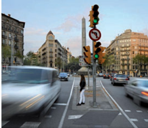
Les dues opcions de canvi proposen més espai per als vianants.

A més de convertir la via en una avinguda amable per a les persones, amb més oferta