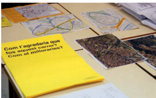
S'ha preguntat als veïns com millorar el barri amb aquestes postals.