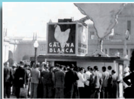
Imatge de l'estand de Gallina Blanca a la Fira de Barcelona dels anys 1950-1960.

Si té fotografies o documents del seu barri, en pot fer donació a l'Arxiu Municipal del Districte, 93 291 68 36