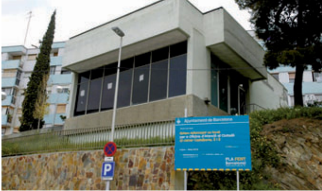
Seu de l'oficina, situada al carrer de Costabona, a la Zona Nord.