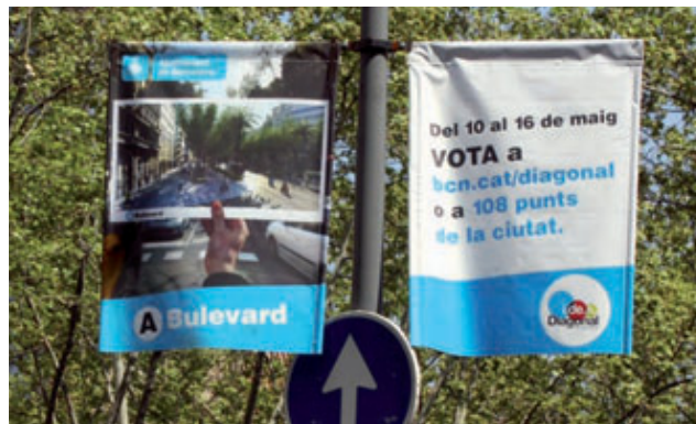
Banderoles anunciant la votació de la consulta, a la Diagonal.

Han passat gairebé dos anys des que es va decidir impulsar la reforma de la Diagonal per convertir aquesta via emblemàtica, projectada per Ildefons Cerdà al segle XIX, en un gran passeig, amable per a les persones i amb més presència del transport públic. Després d'un procés participatiu sense precedents, arriba el moment de decidir. Del 10 al 16 de maig, prop d'un milió i mig de barcelonins podran participar en la que serà la primera consulta popular electrònica que es fa en una gran ciutat i decidir com volen que sigui la Diagonal del futur. Bulevard, rambla o deixar-la tal com està? A la pàgina 5 trobareu informació sobre com votar i els punts habilitats per fer-ho.