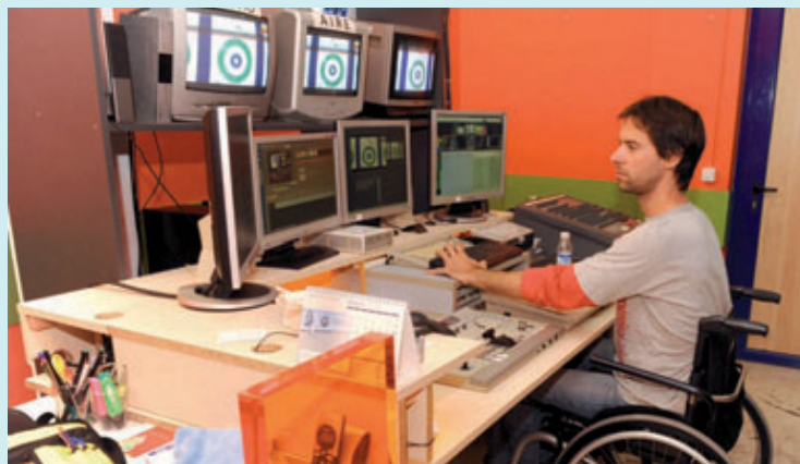
Estudis de Discapacidad Televisión, al carrer Pare Rodés.