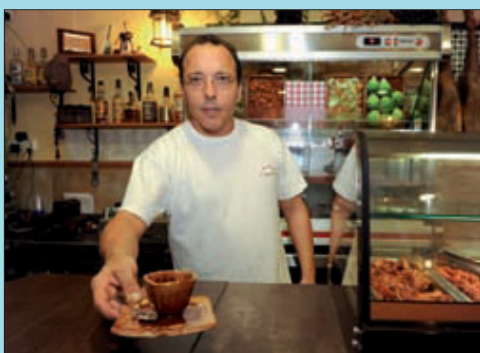
La seva especialitat són els ibèrics.