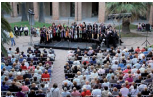
La Coral Canticorum durant l'acte commemoratiu de la Diada.