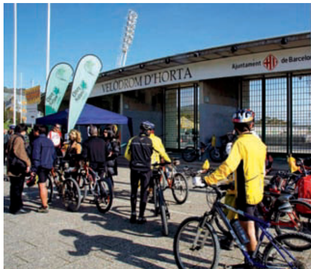
Un moment de la pedalada popular de l'any passat.

Aquest itinerari, que tindrà el seu punt de partida a la seu del Districte però que es desenvoluparà en la seva majoria pel parc, ha estat planificat i supervisat pel Consorci del parc de Collserola, òrgan regulador d'aquest espai. Es realitza sota normes cíviques –no es pot circular en bicicleta per camins de menys de tres metres d'amplada, s'ha de respectar l'entorn i els animals, no es pot llençar brossa, entre d'altres– que han anat transformant el recorregut i l'essència d'aquesta pedalada, en les seves divuit edicions anteriors, per ajustar-lo a la convivència amb aquest espai natural protegit.