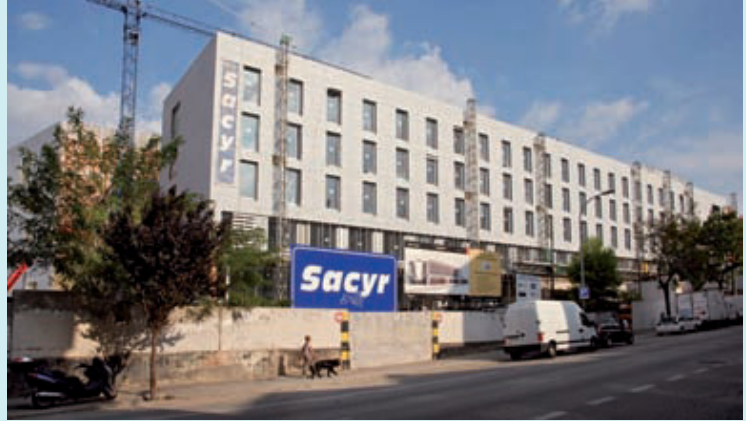
Estat actual de les obres del futur complex sociosanitari.

El futur complex sociosanitari de Cotxeres Borbó inclourà un CAP, un centre de salut mental i una residència amb 220 habitacions dobles