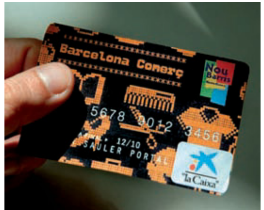
La nova targeta ja es pot utilitzar a Nou Barris.

En l'actualitat, els més de 600 establiments dedicats al comerç al detall i de serveis a l'eix comercial s'estenen pels quatre carrers principals del barri: el passeig Fabra i Puig, carrer Pi i Molist i el passeig de Verdum amb la seva continuació, la Via Júlia. Aquesta zona, que ha experimentat grans millores urbanes de manera continuada en el transcurs de les últimes dues dècades, i el dinamisme de la seva xarxa comercial, permet als seus establiments competir en avantatge amb les grans superfi-