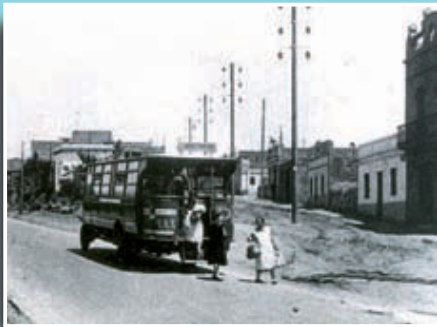
Una autobús interurbà a la carretera de Ribes al seu pas per la Trinitat el 1932.

Si té fotografies o documents del seu barri, en pot fer donació a l'Arxiu Municipal del Districte, 93 291 69 32