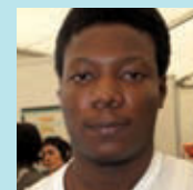
Robinson Onvorah Sense feina

Es bastante buena, muy informativa. A modo personal, me ha aclarado muchas dudas. A veces no sabes por donde buscar y aquí te ayudan y te guían.