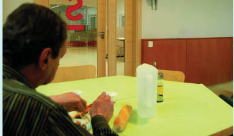
El nou centre funciona durant el dia i la nit.

Les persones "sense sostre" tenen allotjament, alimentació, atenció social i sanitària al centre que s'acaba d'obrir al carrer Marie Curie