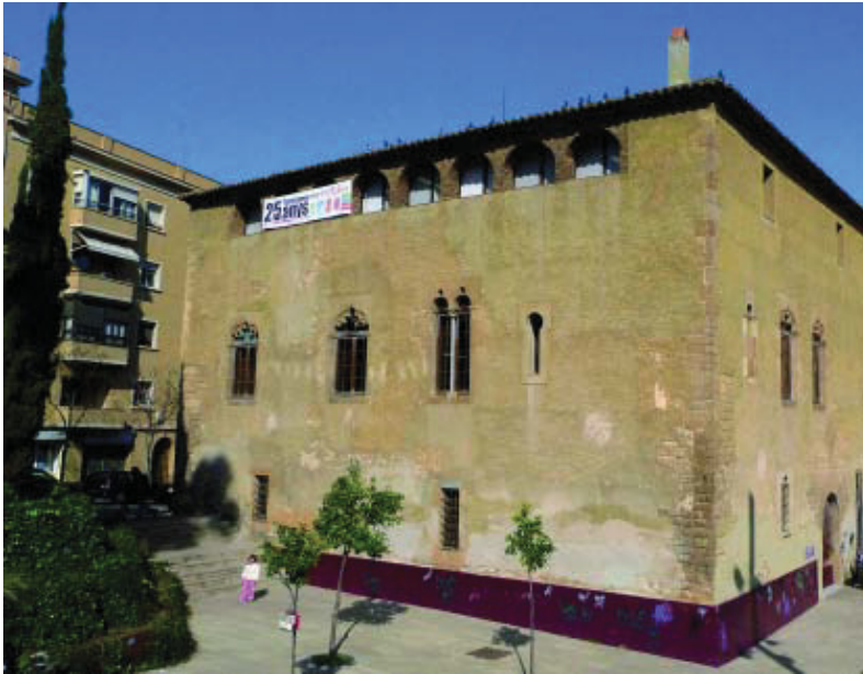
El centre cívic Torre Llobeta es rehabilitarà gràcies als diners del Fons.