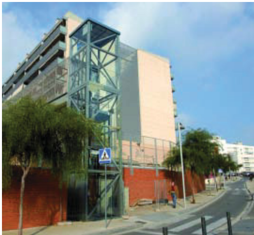
S'ha construït un ascensor per salvar el desnivell que hi ha des de la plaça Peñalara fins al carrer Amílcar.

Pel que fa a les actuacions de millora de l'espai públic, una de les més destacades ha estat la transformació dels carrers Travau i Cadí, entre el passeig de la Peira i el carrer Teide, al barri del Turó de la Peira. Es tracta d'una superfície de més de 2.700 m 2 . Les obres hi han millorat l'accessibilitat de l'espai amb la supressió de totes les barreres arquitectòniques existents. S'hi han ampliat les voreres i s'ha renovat tot el mobiliari urbà i l'enllumenat, amb la millora de la capacitat lumínica amb criteris d'estalvi