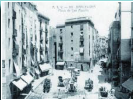
La plaça de Sant Agustí Vell, d'on sortien molts traguers que feien servir la carretera de Ribes.

Si té fotografies o documents del seu barri, en pot fer donació a l'Arxiu Municipal del Districte, 93 291 68 36