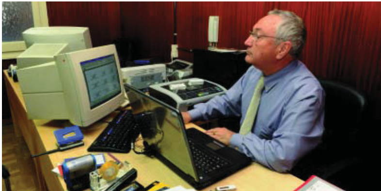
El president de l'Associació Torre Llobeta, a la seu de l'entitat.

L'entitat, amb 250 socis, organitza reunions, cursos, tallers, excursions i conferències, i no fa gaire ha creat una biblioteca