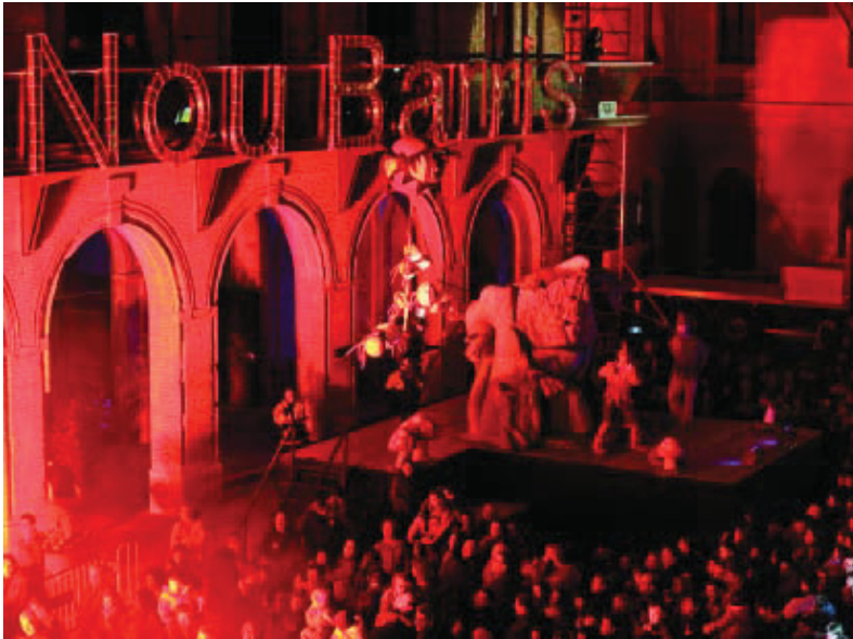
Com tots els anys, els Reis seran rebuts a la plaça Major de Nou Barris.

Des del llunyà Orient, els Reis Mags tornen a Nou Barris per visitar els nens i nenes la vigília del dia més esperat de l'any. Dies abans, el Pare Noel passejarà per l'eix comercial del districte, on repartirà caramels