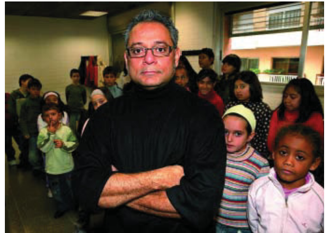
Un dels seus projectes és la dinamització de la música iberoamericana arreu d'Europa.

Nosaltres diem que hi ha una espècie de trilogia. Una és la formació en si