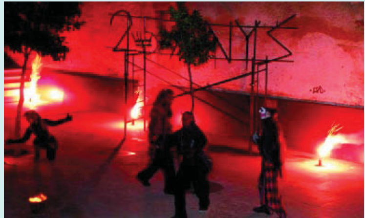
Un dels espectacles de carrer amb què es va celebrar l'aniversari el passat mes de novembre.