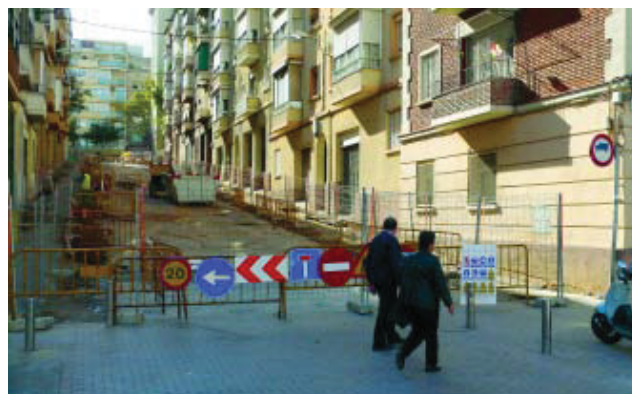
El carrer Pontons, que tindrà només un carril de circulació per a vehicles.

La millora de l'espai públic continua sent una de les prioritats del programa d'actuació del Districte. Dins d'aquest context, s'emmarquen les obres de remodelació integral dels carrers Pontons i Vèlia, aquest últim en el tram comprès entre Escòcia i Riera d'Horta. Amb les obres se suprimiran nombroses barreres arquitectòniques, s'ampliarà la superfície per a vianants, es renovarà completament el mobiliari urbà, es plantarà nou arbrat i es renovaran les xarxes d'infraestructures de serveis, entre altres actuacions de millora. Pontons tindrà plataforma única i, per tant donarà prioritat als vianants.