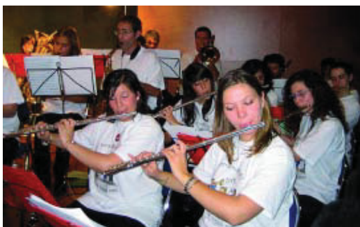
55 músics de l'orquestra de vent van participar al concert.