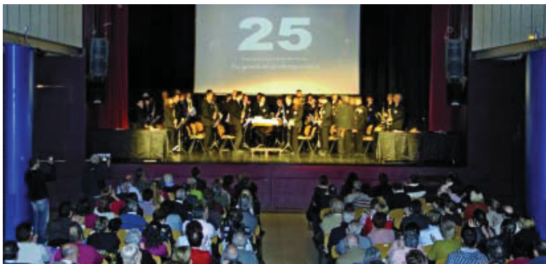
Un moment de la celebració de l'aniversari de l'entitat.

L'Arxiu Històric de Roquetes-Nou Barris acull nombrosos documents que formen part de la memòria col·lectiva. Aquest 2008 ha complert 25 anys