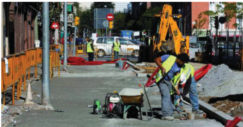
Obres de millora del carrer Vèlia.

Les obres preveuen la nova pavimentació de l'espai, l'adequació de la xarxa de sanejament, una nova xarxa d'enllumenat públic, el soterrament de les xarxes de serveis aeris existents, com també nova plantació d'arbrat i nou mobiliari urbà. Una altra característica de la intervenció és la supressió de les barres arquitectòniques.