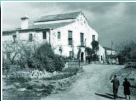
Imatge rural de la masia de can Valent.

Si té fotografies o documents del seu barri, en pot fer donació a l'Arxiu Municipal del Districte, 93 291 69 32