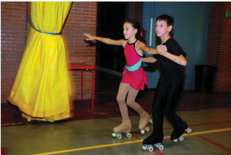
Una parella de joves patinadors durant les classes a l'escola Mercè Rodoreda.

Amb l'inici del curs escolar, comença també el programa "Esport en marxa a Nou Barris", una iniciativa que permet practicar més esport