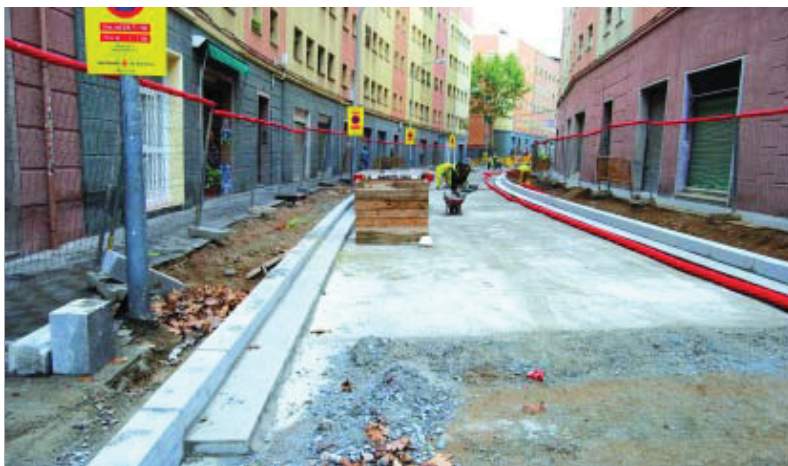
Quan finalitzin les obres, el carrer Travau serà més accessible i tindrà voreres més amples.

Les obres les duu a terme l'empresa municipal Pronoubarris, la qual s'ocupa de l'espai públic i realitza les tasques de manteniment de manera sistemàtica a través de la inspecció i també gràcies a la col·laboració ciutadana. Tots els ciutadans que vulguin ajudar a la millora de l'espai del districte ho poden fer a través del web www.pronoubarris.com o també directament a l'Oficina de Manteniment de la Via Pública, al carrer Marie Curie, 20.