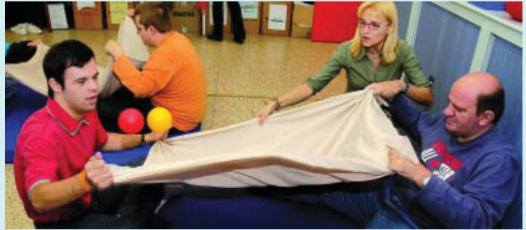
A l'inici, només s'hi feien tallers ocupacionals, però ara també es fan activitats de lleure.