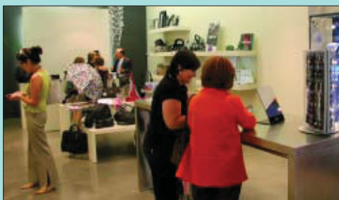
Sirius és una botiga nova molt ben acollida pels veïns del barri.