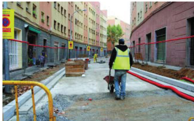
Carrer Travau, en plenes obres.

S'han iniciat les obres de reforma dels carrers Travau i Cadí. Aquestes actuacions permetran la millora de l'accessibilitat dels dos carrers amb l'eliminació de les barreres arquitectòniques i l'ampliació de les voreres actualment existents. S'hi instal·larà nou enllumenat i es construirà una nova xarxa d'embornals.