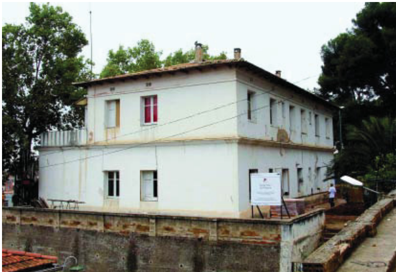
El futur casal de gent gran tindrà sales d'informàtica, de jocs i reunions i un espai per a tallers.

La remodelació integral de l'edifici, situat al carrer Camós, 1, del barri de Can Peguera, convertirà l'antiga caserna de la Guàrdia Civil en un casal de gent gran