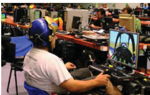
Landparty Lancelona celebrat al Palau Sant Jordi.