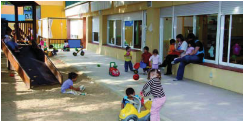
El centre és una instal·lació moderna, espaiosa i molt ben equipada.

L'escola bressol municipal Ciutat de Mallorca va obrir l'any 2002 i va permetre que la zona sud de Nou Barris gaudís d'un equipament modern, espaiós i segur