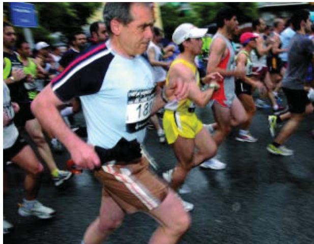
Els carrers de Nou Barris es van omplir d'atletes tot i la pluja.