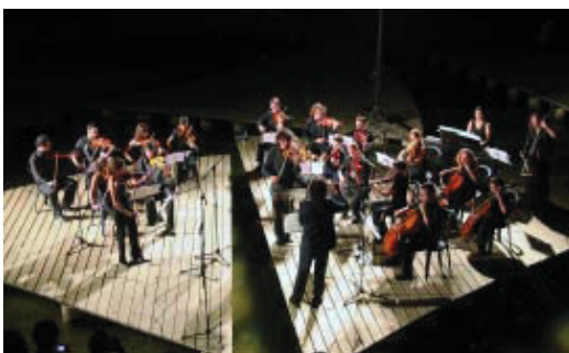
Els concerts nocturns són gratuïts.