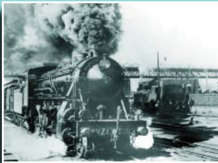
Imatge d'una locomotora al seu pas pels tallers del Nord.

Si té fotografies o documents del seu barri, en pot fer donació a l'Arxiu Municipal del Districte, 93 291 68 36