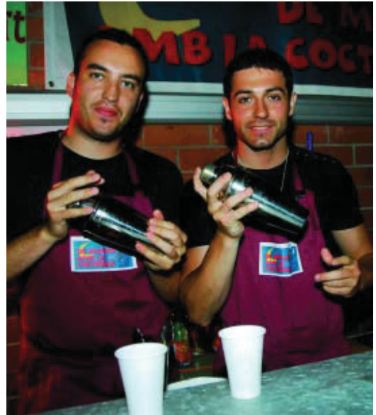
Durant el concert es van servir còctels sense alcohol.

Molts joves associen el consum d'aquestes substàncies amb el temps lliure. "Abans,