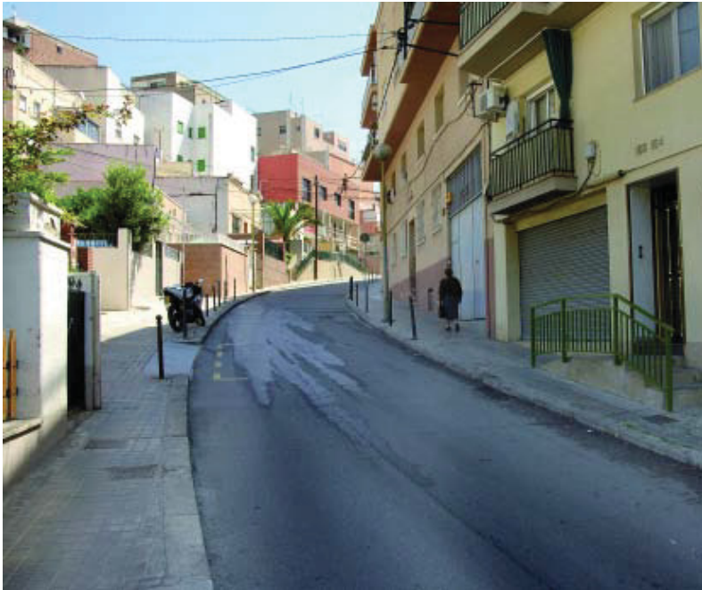
El carrer de l'Artesania tindrà les voreres més amples.

Les Roquetes es beneficia de diverses intervencions de millora urbana, com ara la transformació de l'espai públic del carrer de l'Artesania i l'adaptació de les cruïlles per als discapacitats visuals