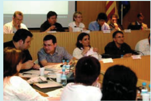
Un moment de l'últim Ple del Districte de Nou Barris.

En el Ple del Districte del passat 3 de juny es va informar de l'inici d'un pla ocupacional per rehabilitar l'antiga caserna de la Guàrdia Civil a Can Peguera com a casal per a la gent gran