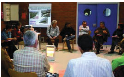
Les jornades es van celebrar el 24 i 25 de novembre.