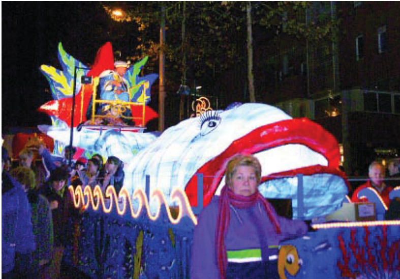
Imatge de la cavalcada de l'any passat.