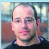
Jaume Espallargas Informàtic

M'agradaria anar-hi, però sospito que aquest any la feina no m'ho permetrà. Els altres anys sí que hi he participat.