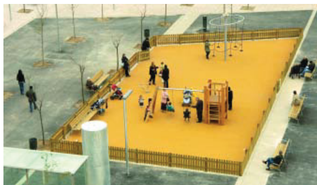
La renovada plaça Garrigó.

El passat mes de novembre va entrar en funcionament el nou aparcament soterrat de la plaça de Garrigó, que també estrena nova urbanització. D'aquesta manera, el barri de Vilapicina guanya 290 noves places d'aparcament. La rebuda d'aquesta nova instal·lació va ser celebrada amb l'organització d'una jornada de portes obertes perquè els veïns poguessin conèixer de primera mà l'aparcament. Nou Barris és un dels districtes de la ciutat on s'estan construint més aparcaments soterrats públics, amb l'objectiu de contribuir a la millora de la mobilitat i la qualitat de vida dels seus habitants.