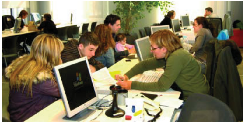
Imatge de la nova Oficina d'Atenció al Ciutadà durant un dia de funcionament.

L'Oficina d'Atenció al Ciutadà de la seu del Districte de Nou Barris, que funciona des de l'any 1993, s'ha renovat del tot i s'ha ampliat