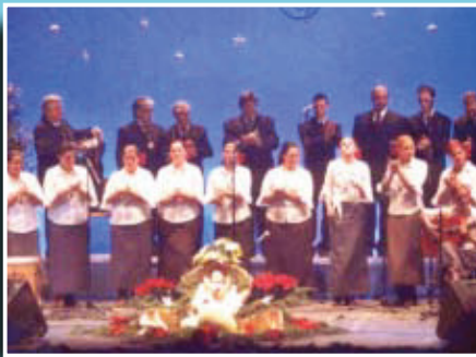
Imatge d'una de les trobades dels cors rocieros.

Si té fotografies o documents del seu barri, en pot fer donació a l'Arxiu Municipal del Districte, 93 291 68 36