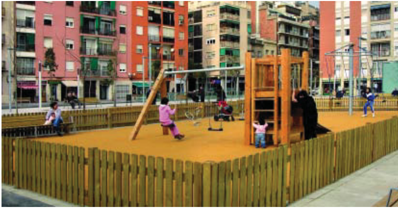
La nova plaça inclou una àrea de jocs infantils.