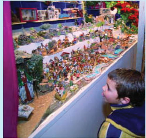
Una parada de la fira de nadal.

Un arbre de Nadal de dotze metres d'alçada decora la Via Júlia. És una iniciativa