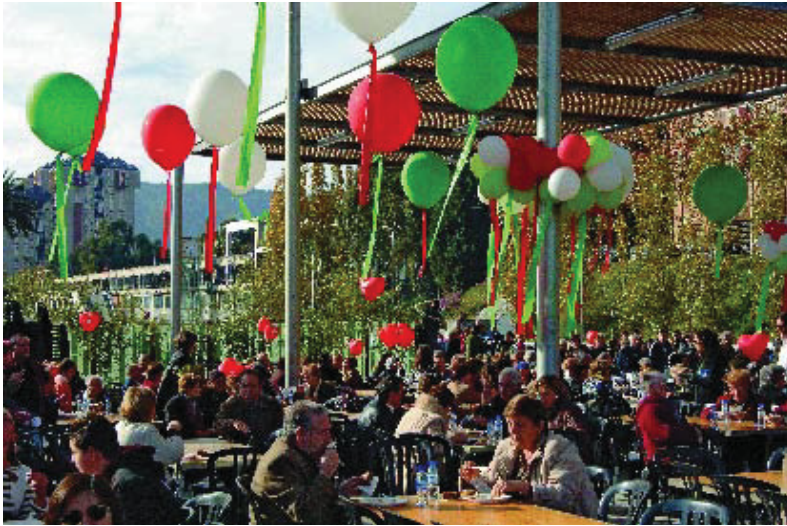
El veïnat de Nou Barris va sortir a festejar les novetats de la ronda de Dalt.