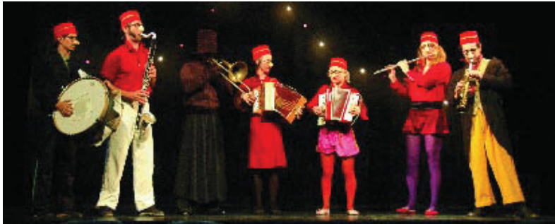
Una actuació del circ d'hivern a l'Ateneu de Nou Barris.