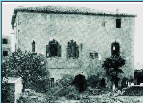
Una imatge, cap als anys cinquanta, d'una Torre Llobeta molt abandonada.

Si té fotografies o documents del seu barri, en pot fer donació a l'Arxiu Municipal del Districte. T. 93 291 68 36