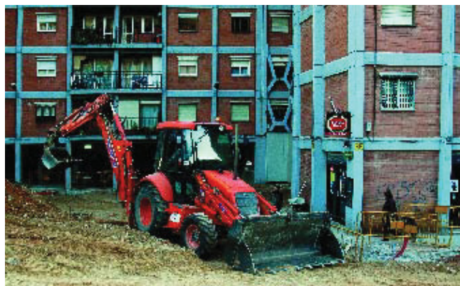
Les obres van començar al setembre.

Pronoubarris ha iniciat la reforma de l'interior d'illa entre els blocs d'habitatges delimitats per la ronda Guineueta Vella i els carrers Ignasi Agustí i Federico García Lorca. L'actuació serà molt semblant a la que ja es va fer a dos espais interiors de la zona fa quatre anys i té com a objectiu eliminar les barreres arquitectòniques i millorar l'espai amb nou enllumenat i mobiliari urbà, la renovació de la jardineria i de la pavimentació. També hi haurà dos ascensors. Les obres van començar al principi de setembre.