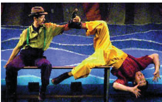
"El circ de Sara" es va estrenar el 16 de desembre.