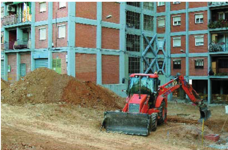
Les màquines treballen als espais interiors d'illa de Canyelles.

als blocs d'habitatges, s'habilitaran camins de vianants vorejats de parterres de gespa i arbrat, es pavimentarà la zona amb rajoles vermelles iguals que les illes ja rehabilitades, s'incrementaran els nivells lumínics amb nou enllumenat, es millorarà la xarxa de clavegueram i s'instal·larà nou mobiliari urbà. Es tracta de millorar la transparència i l'accessibilitat d'aquests espais veïnals. Per això, un dels punts més importants d'aquesta intervenció és la construcció de dos ascensors. Aquesta obra promoguda per Pronoubarris s'ha adjudicat a Fomento de Construcciones y Contratas (FCC), que va començar les obres al setembre. És la continuació d'un projecte més ampli a tot el barri i que s'estendrà durant els propers mandats a altres sectors de Canyelles.