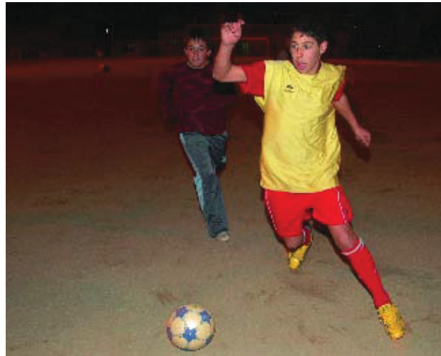
El club vol promocionar el futbol entre els joves.

"Aquest futbol base", explica Santofinía, "consistirà a disposar d'equips a totes les categories: promeses, aleví, infantil, cadet i juvenil. A més a més dels ja existents, els amateurs i els veterans".