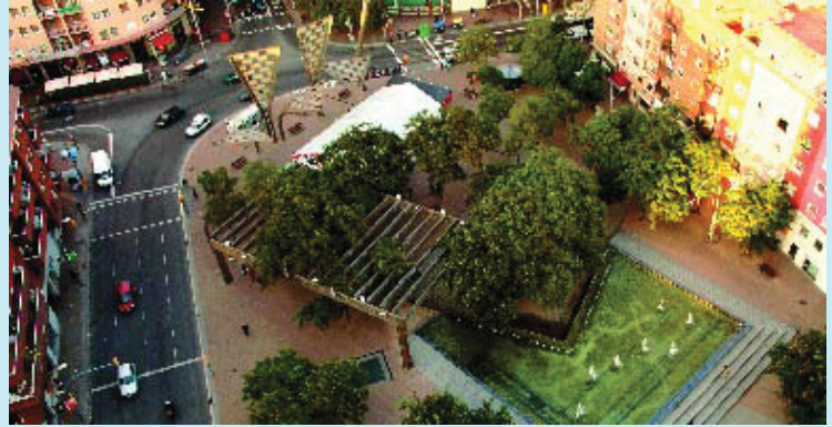
La plaça Virrei Amat és un dels punts neuràlgics del barri Vilapicina i Torre Llobeta.